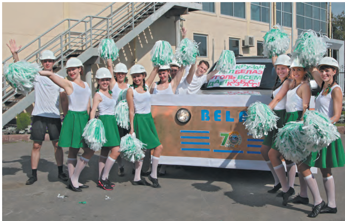
■ Выступление Молодежного совета ОАО «СКЭК»: с праздником, дорогие земляки!

жайных грядок» было заметно, что сотрудники компании с энтузиазмом занимаются домашним хозяйством! Коммунальщики «КемВода» организовали красочную ярмарку, на которой показали выращенные фрукты-овощи, а также представили блюда и заготовки на зиму, поделились любимыми рецептами. Сотрудники «Березовских электрических сетей» привезли це-