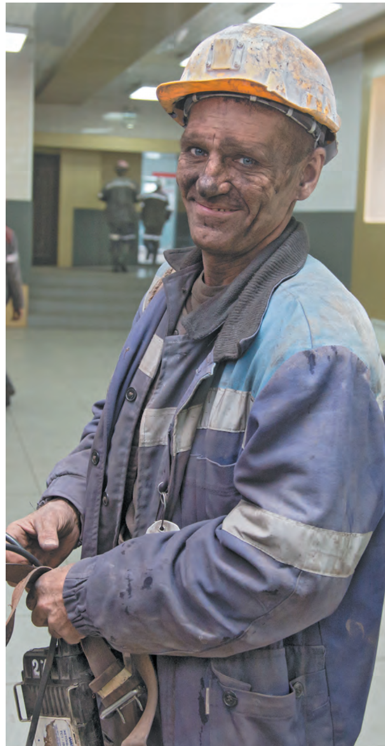
■ Потрясающих результатов в отрасли удастся добиться благодаря труду горняков и шахтеров, настоящих профессионалов своего дела.