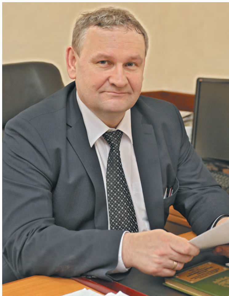
■ Заместитель губернатора Кемеровской области по топливно-энергетическому комплексу и экологии Евгений Хлебунов.

– Когда мне задают этот вопрос, я сразу вспоминаю слова астронавта Нила Армстронга во время высадки на Луну: «Это один маленький шаг для человека, но гигантский скачок для