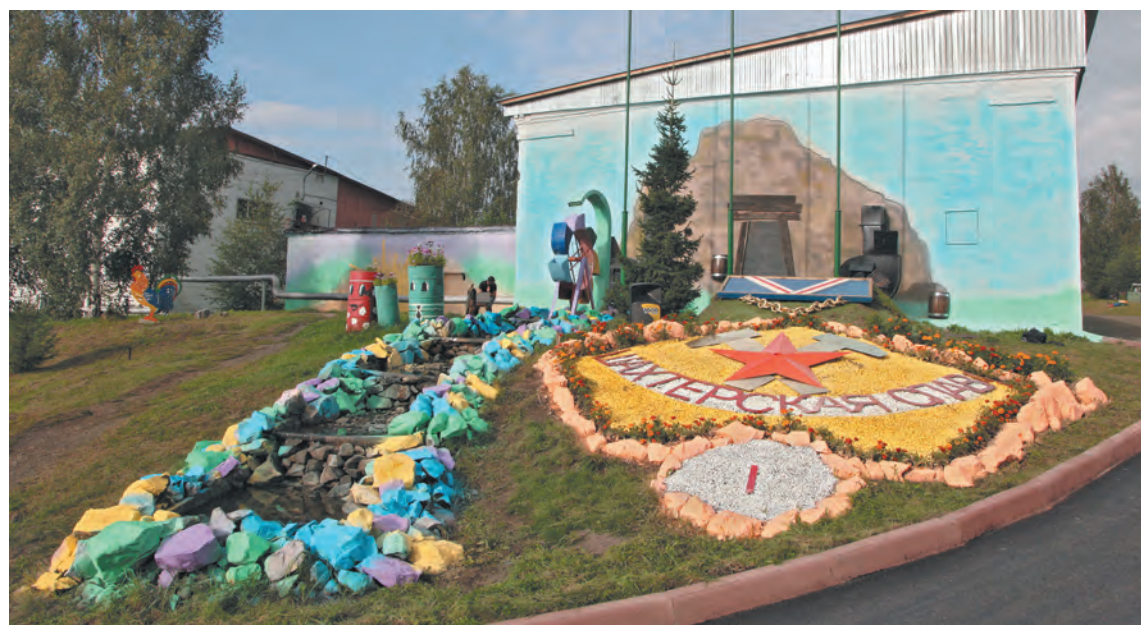
■ Яркая клумба ООО «БЭМЗ-1».