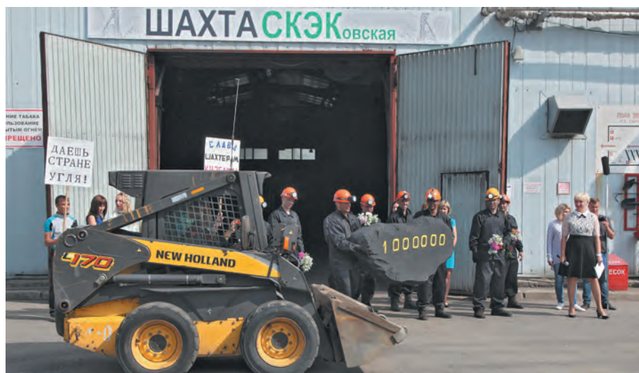
■ Масштабное представление в честь шахтерского труда от АО «Кемеровская горэлектросеть» – победителя конкурса этого года.