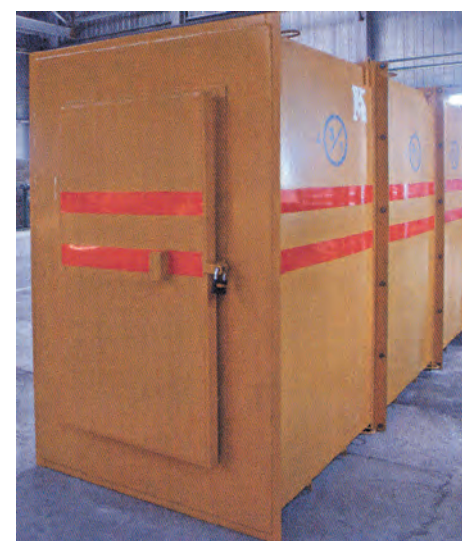
■ Пункт переключения в резервные самоспасатели.

Кемеровский мехзавод не останавливается на достигнутом. Специалисты активно изучают потребительский рынок, ведут поиск наукоемких разработок, чтобы расширить долю производства за счет конкурентоспособной продукции. В настоящее время АО «КМЗ» ведет переговоры с кузбасскими угольными предприятиями о возможности выпуска запасных частей для иностранных экскаваторов, бульдозеров, проходческих комбайнов.