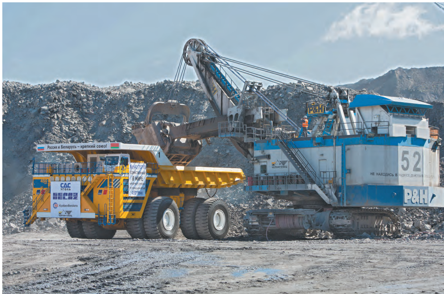
■ В 2014 году на разрезе «Черниговец» запущен в работу самый большой в мире самосвал «БелАЗ-75710» грузоподъемностью 450 тонн.

В прошлом году наши шахтеры и открытчики добыли уже 227,4 млн тонн угля – на 5,4% больше, чем в 2015-м. Среди