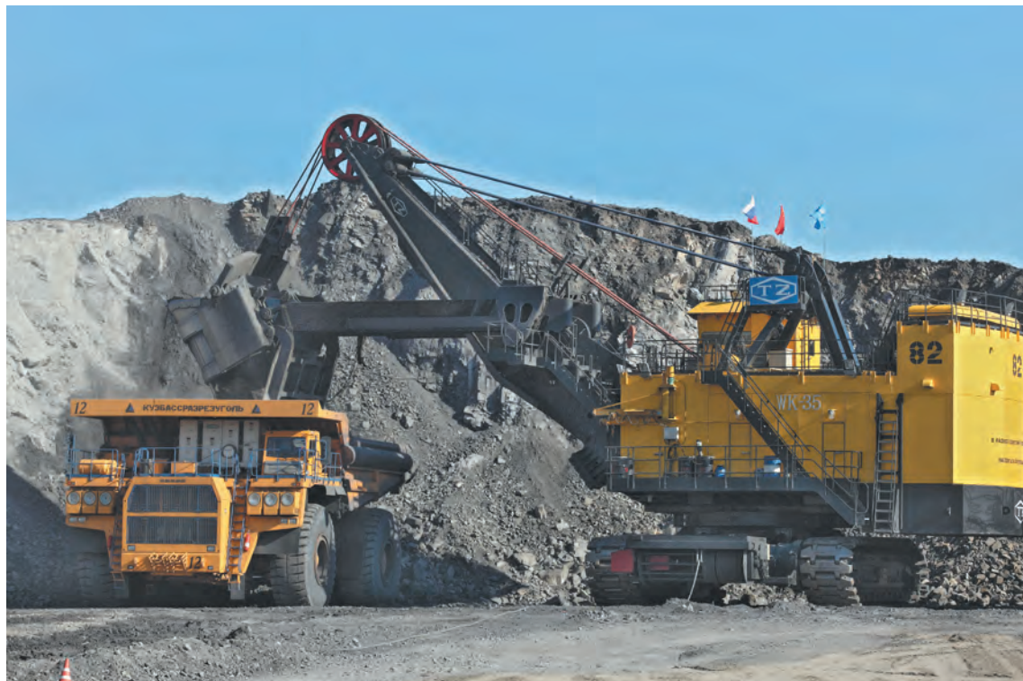
■ В сентябре 2011 года на Бачатском разрезе («Кузбассразрезуголь») приступил к эксплуатации экскаватор WK-35.

глядно показал: отрасль благополучно преодолела кризисное время. По итогам года кузбасские шахтеры и горняки добыли уже 185 млн тонн угля, перекрыв собственные рекордные показатели 2008-го. Также в 2010 году у нас было открыто совершенно новое направление в экономике не только области, но и страны в целом – добыча метана из угольных пластов. Старт этой работе дал Дмитрий Анатольевич Медведев.