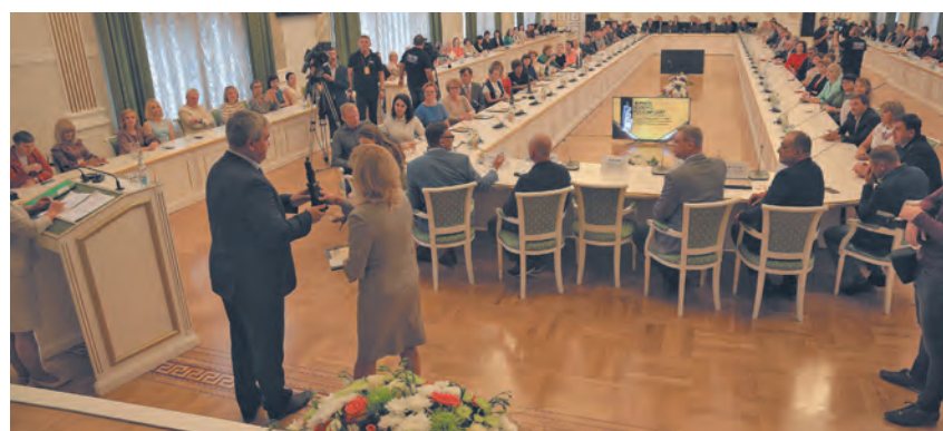
■ Момент награждения победителей.