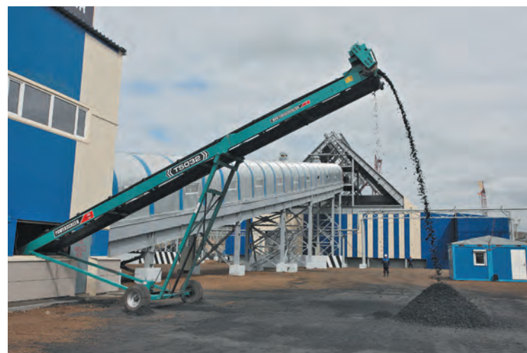
■ Обогатительная фабрика «Наспад» работает с 2013 года.

И в 2011 году позитивные тенденции усилились. В первую очередь потому, что собственники начали активно вкладывать в отрасль серьезные средства: на 50 млрд рублей больше, чем в 2010-м. «Такие вложения позволяют выйти на новый, более высокий уровень и по производи-