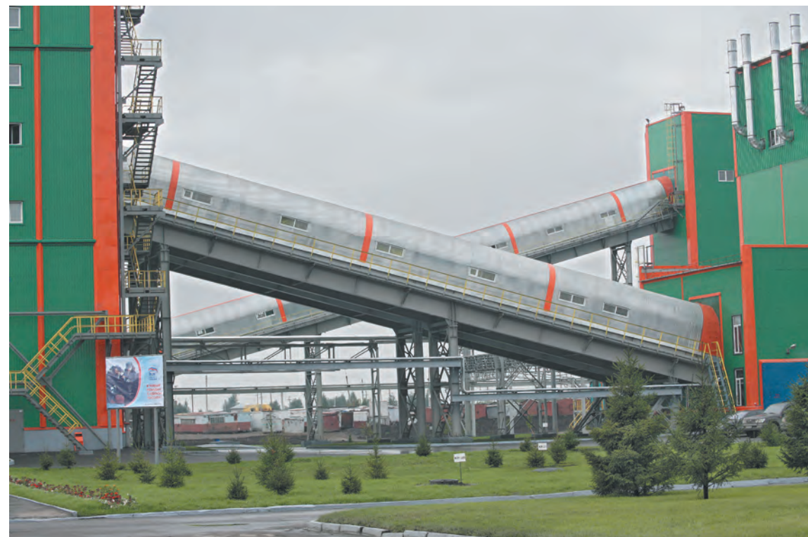
■ В 2008 году вступила в строй действующих обогатительная фабрика «Бачатская-Коксовая».

И, конечно, важнейшим для отрасли стал визит в Кузбасс Владимира Путина – именно в Кемерове в январе 2012 года была подписана долгосрочная программа развития угольной отрасли страны до 2030 года. Этот документ особенно важен потому, что уже тогда появились первые признаки второй кризисной волны: пока (до «черного вторника» декабря 2014 года) цена на нефть взлетала вверх, цена на уголь начала колебаться.