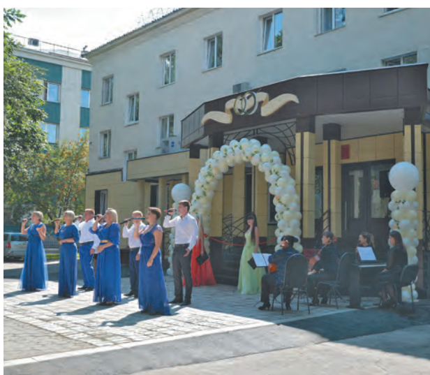
■ На открытии ЗАГСа.

К празднику сделано немало и в части благоустройства города: отремонтированы тротуары, дворы, фасады, заменены кровли многоквартирных домов. Не забыты и важные объекты соцсферы.