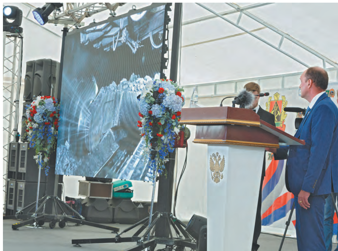
■ В июле 2017 года был дан торжественный старт работе I очереди ООО «Шахта им. Сергея Тихова» в Ленинск-Кузнецком районе и II очереди ООО «Шахта «Бутовская» в Кемерово.