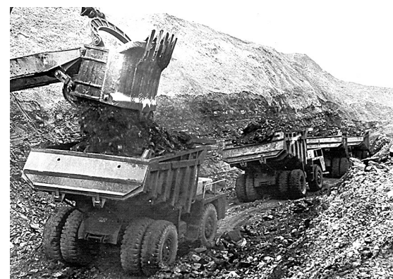
■ Карьер «Томусинский 7-8», г. Междуреченск, 1967 год.