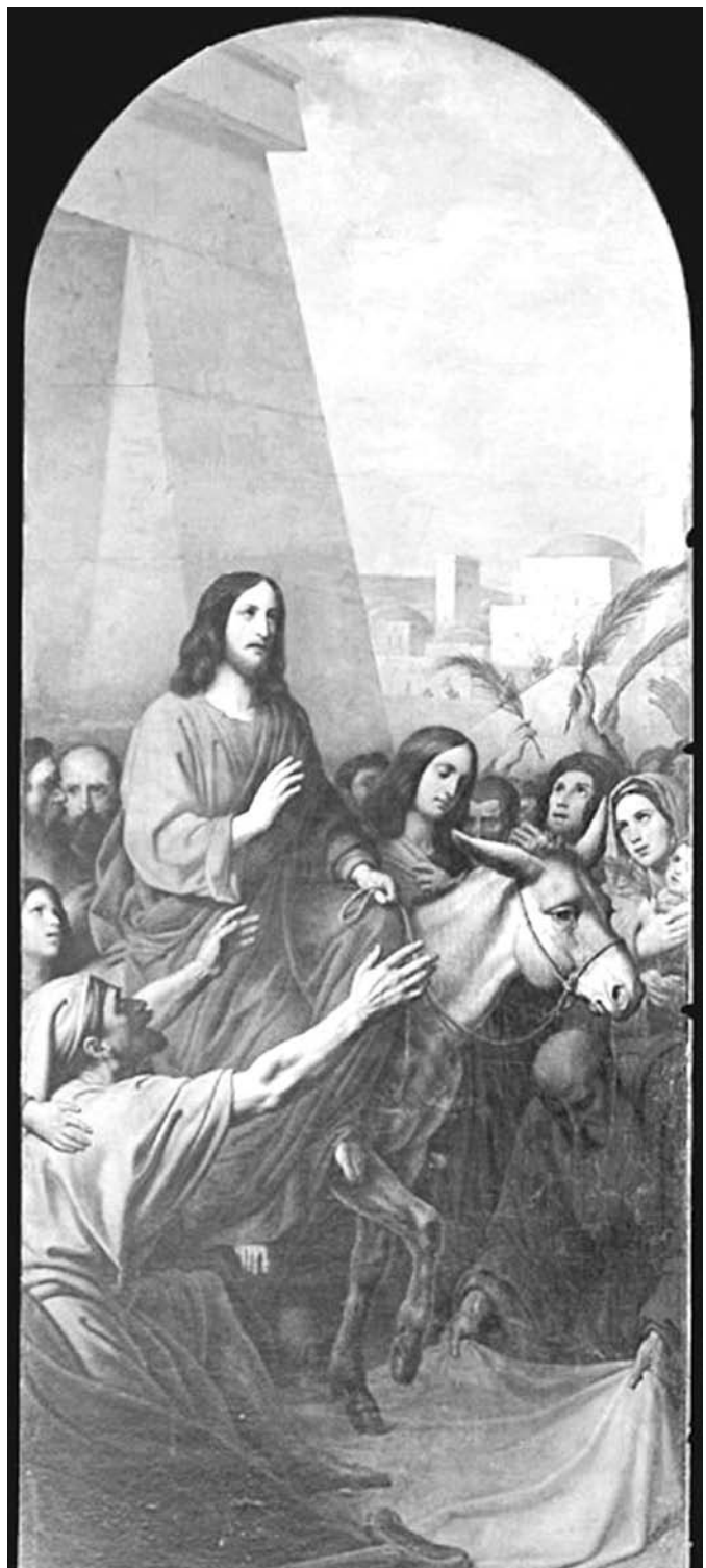
9 апреля – ВХОД ГОСПОДЕНЬ ВО ИЕРУСАЛИМ. Вербное воскресенье. «Вход Господень в Иерусалим». Карл Штейбен, 1843–1854 г.г. Исаакиевский собор, г. Санкт-Петербург.

церкви, стоявшей неподалеку от театра, вышел пасхальный крестный ход. Там было темно. Людей не видно — одни лишь свечи, тихо идущие по воздуху и поющие далекий родниковый всплеском: «Воскресение Твое Христе, Спасе, ангели поют на небеси...» Завидев крестный ход, хор комсомольцев еще пуще разошелся, путив вприкачку, с гиканьем и свистом: Эй ты, аблочко, катись, Ведь дорога скользкая. Подкузьмила всех святых Пасха комсомольская. Пасхальные свечи оставались у церковных врат и