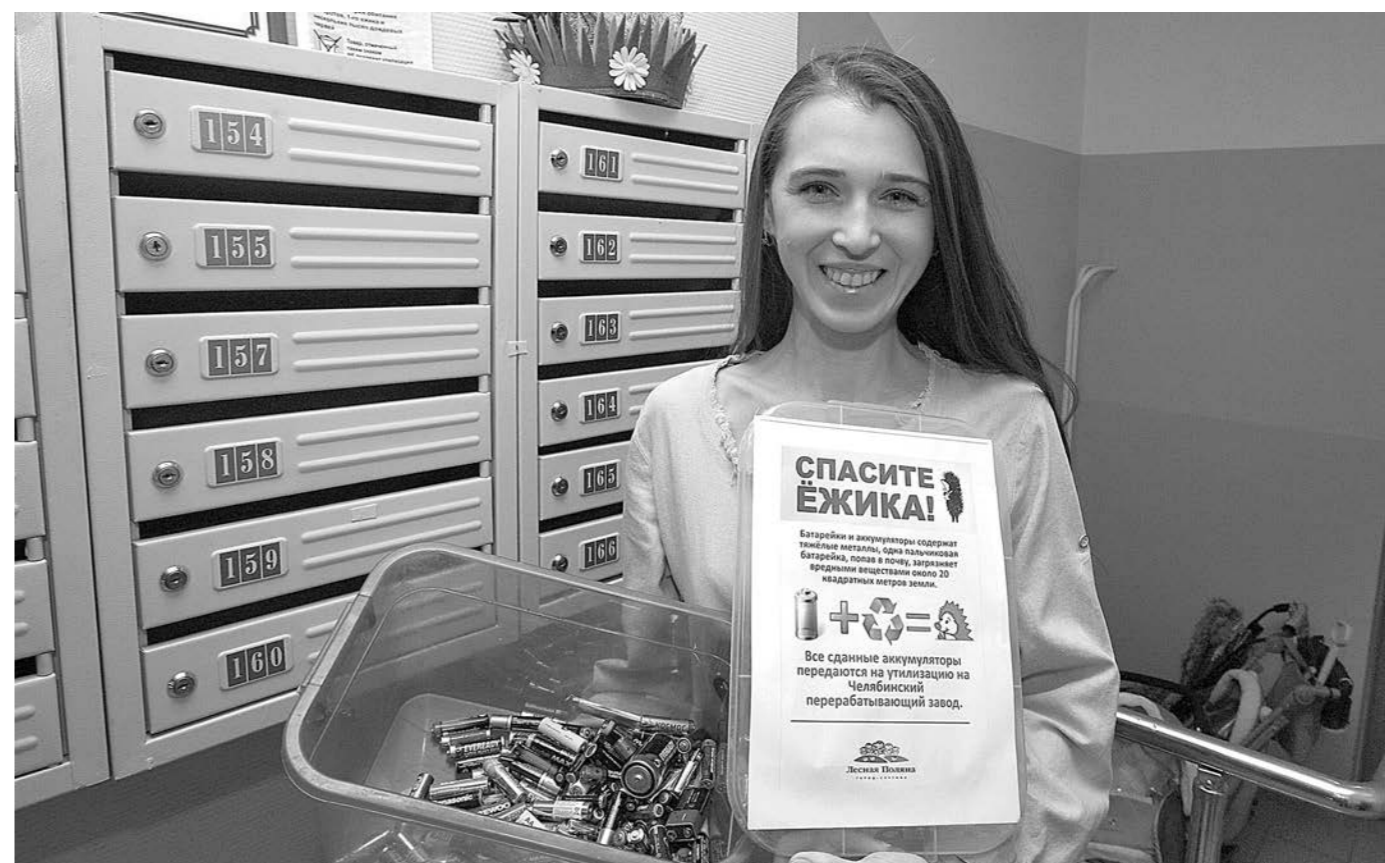
РАДИ ЁЖИКА. Более тонны отработанных батареек сдали на переработку жители Лесной Поляны. Столько они собрали за два года экологической акции «Сдай батарейку - спаси ёжика». Ёжика - потому что считается, что одна выброшенная батарейка загрязняет 20 кв. м земли, где могут обитать два крота, один ёжик и несколько тысяч дождевых червей. Все собранные батарейки отправлены на Челябинский перерабатывающий завод. С каждым годом число участников акции растёт. Коробки для сбора батареек установлены в подъездах, школах, магазинах.