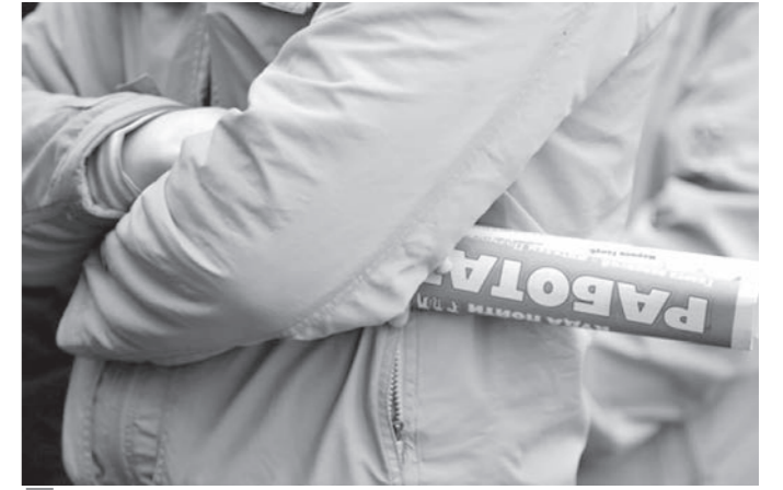
Непростая ситуация на рынке труда – на руку мошенникам.