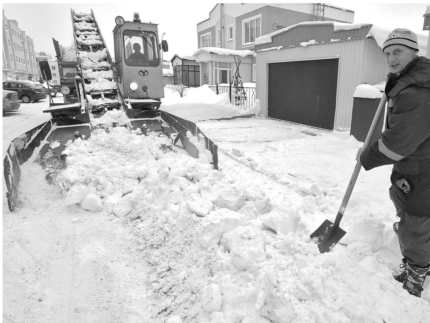
В Лесной Поляне, городе-спутнике столицы Кузбасса, снега выпало, говорят, еще больше, чем в самом Кемерове.

По предварительным подсчётам, на ликвидацию последствий снегопадов только в столице Кузбасса уже потрачено как минимум на 10% больше, чем обычно. Рост затрат подрядчиков, убирающих дороги Новокузнецка по муниципальному контракту, оценивается в 20%. В снежной экономике двух региональных столиц пытался разобраться наш корреспондент