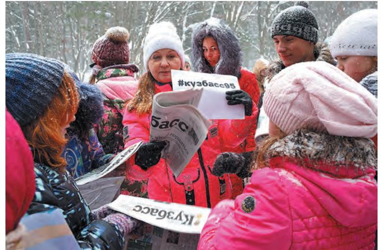
Юным экологам рассказали о конкурсах «Кузбасса» к 95-летию юбилею.