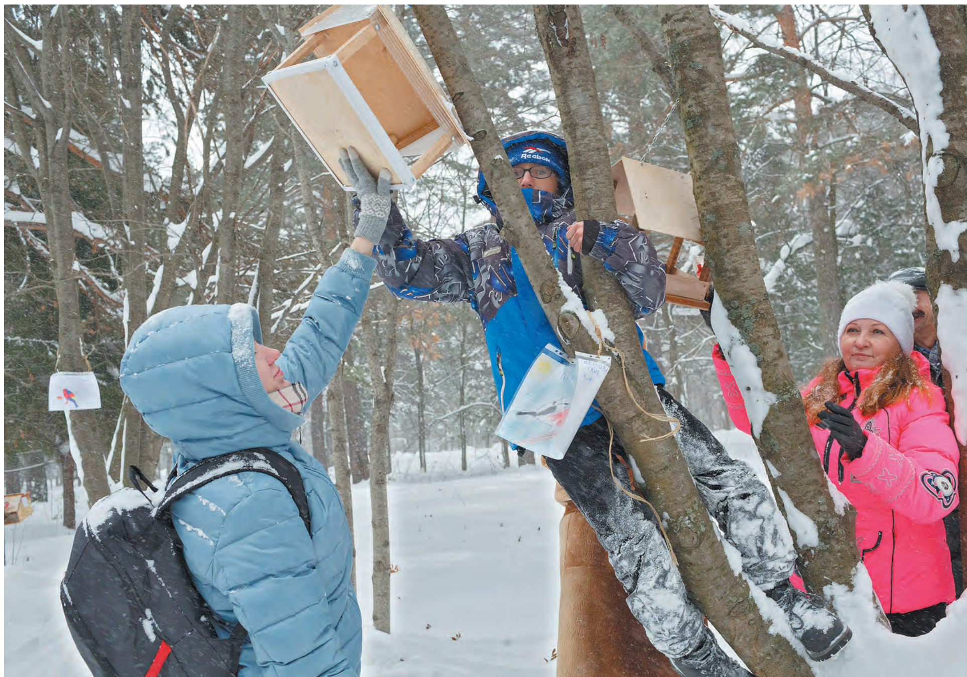
Правильно повесить кормушку – дело ответственное!