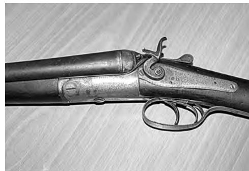
■ Изделие английских оружейников конца XIX века, сданное в полицию жительницей Юрги.

А уже в нынешнем году житель Белова добровольно выдал стражам правопорядка гладкоствольное шомпольное охотничье ружье с ударно-капсюльным замком и стволом калибра 15,4 миллиметра, произведенное в России в середине XIX века. Это оружие он нашел неподалеку от своего гаража. Несмотря на солидный возраст, ружье находилось в исправном состоянии.