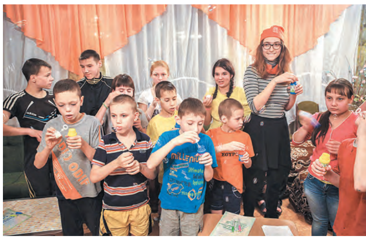
■ Фото Ярослава Беляева.