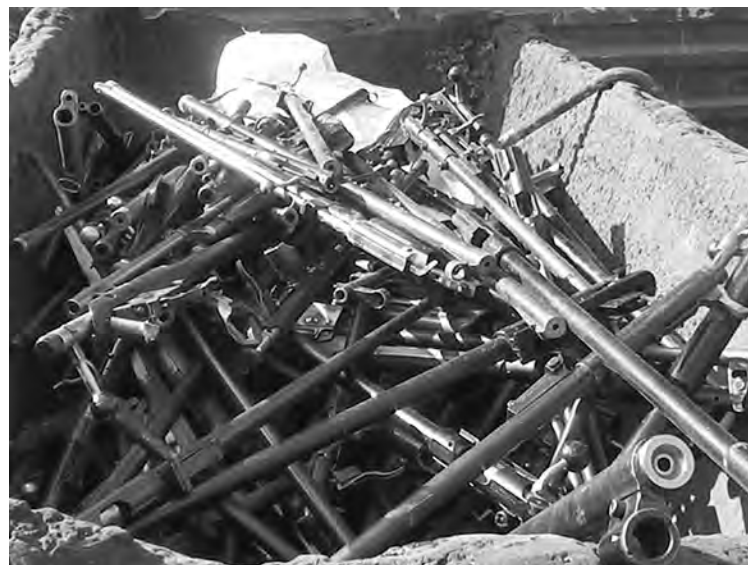
■ Всё оружие, сданное гражданами в полицию, в конечном итоге идет на переплавку и превращается в мирную продукцию – например, строительные уголки, швеллеры или арматуру.