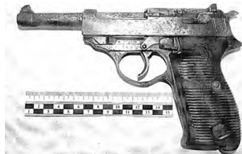
■ Немецкий пистолет «Вальтер» широко использовался в Вермахте и хорошо известен по фильмам про войну.