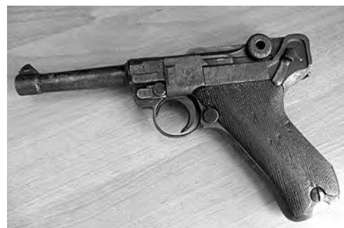
■ Такие пистолеты «Парабеллум» стояли на вооружении немецких офицеров в годы Второй мировой войны.