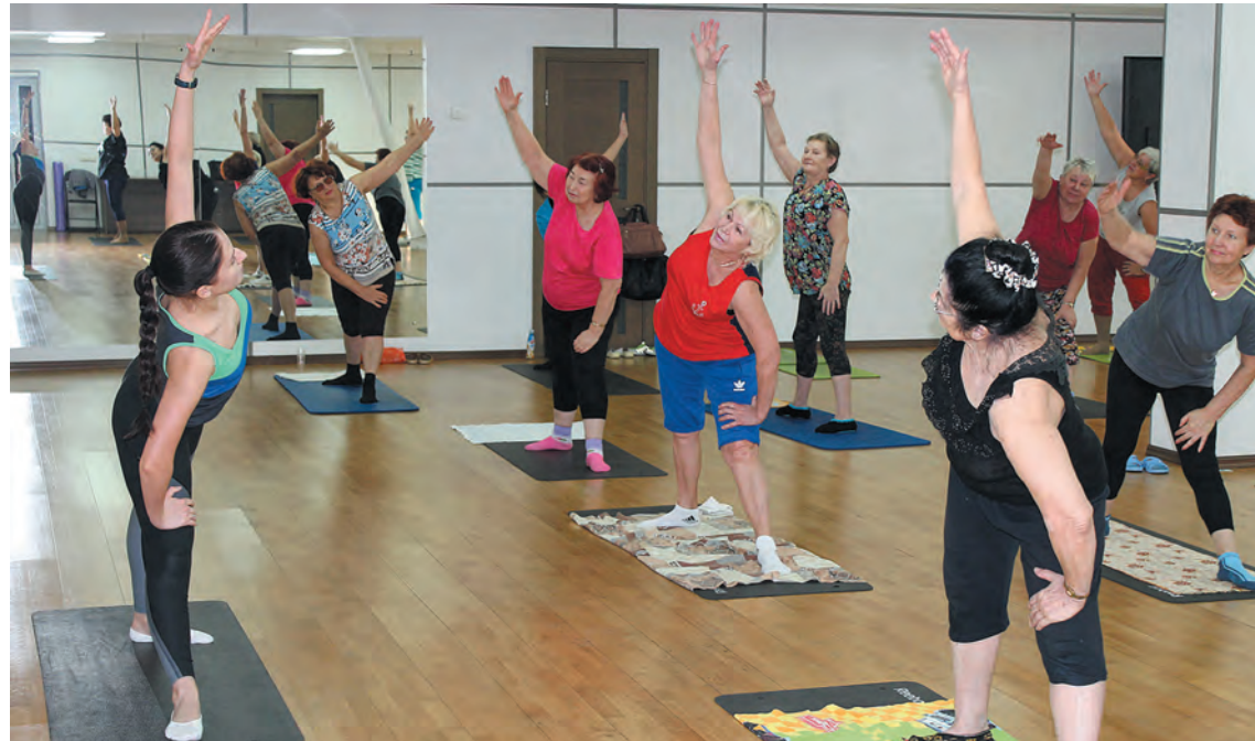
■ Фото Виктора Сохарева.

«Некоторые, например, приходят попробовать и понимают, что