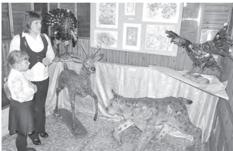
■ В экспозиции выставки более 100 работ выпускников разных лет, с том числе живопись, керамика, скульптура.

Спешите! Декада подписки 1-11 декабря. Скидки!