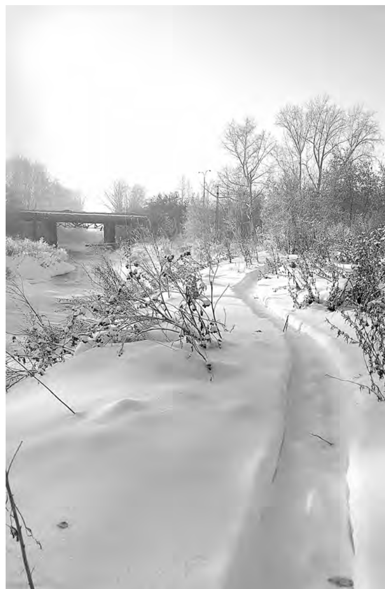
■ Зимний лес.

Но при этом нелишне помнить - мы ответственны за того, кого приручаем. Совсем уж забывать о растениях в доме не годится. Такое невнимание провоцирует набеги вредителей, появляющихся словно из ни-