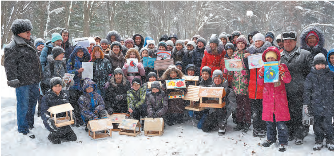
Общий снимок на память о совместной акции в Сосновом бору.