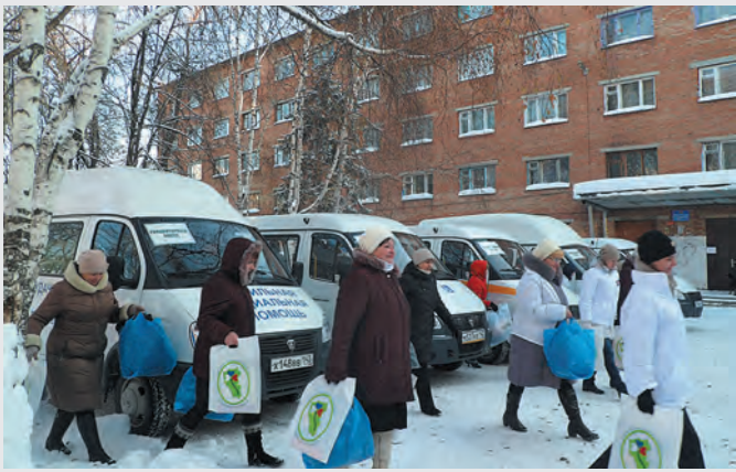
■ Мобильная социальная бригада в Юрге.