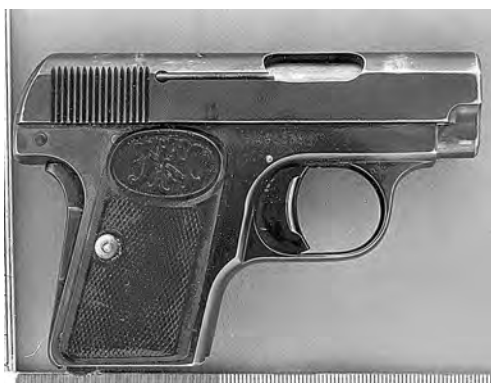
■ Примерно из такого же «Браунинга» в 1918 году было совершено покушение на В.И. Ленина.

Однако больше всего раритетного оружия сдают жители города Белово. Один здешний пенсионер, к примеру, принес в полицию немецкий пистолет «Парабеллум», который он нашел в одном из окрестных лесов. Пистолет был изготовлен в 1940 году и находился в отличном состоянии, на деталях имелась атрибутика нацистских войск – свастика и герб. Поэтому есть большая вероятность, что когда-то это оружие принадлежало офицеру фашистской армии.