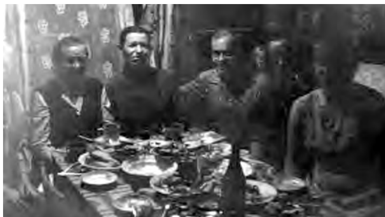
■ То самое фото с Урала, пришедшее в Кузбасс и помогшее найти своих.