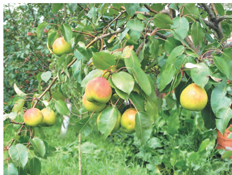
■ Сегодня сад живет и радуется людям...

В «Вишневыском» в последние годы выращивают также для ландшафтного дизайнера саженцы дуба, туи, сосны сибирской, предлагают населению цветочную рассаду.