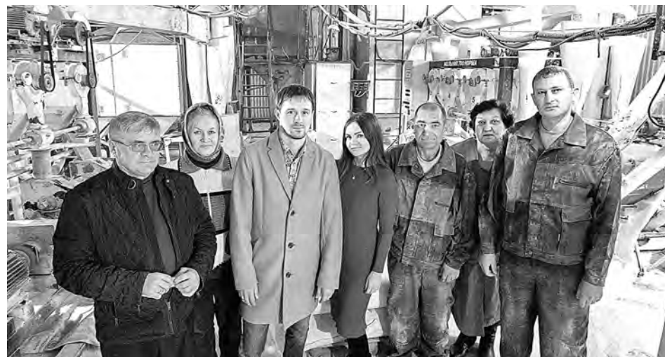
■ Хозяйство Койнова - это дружный коллектив.