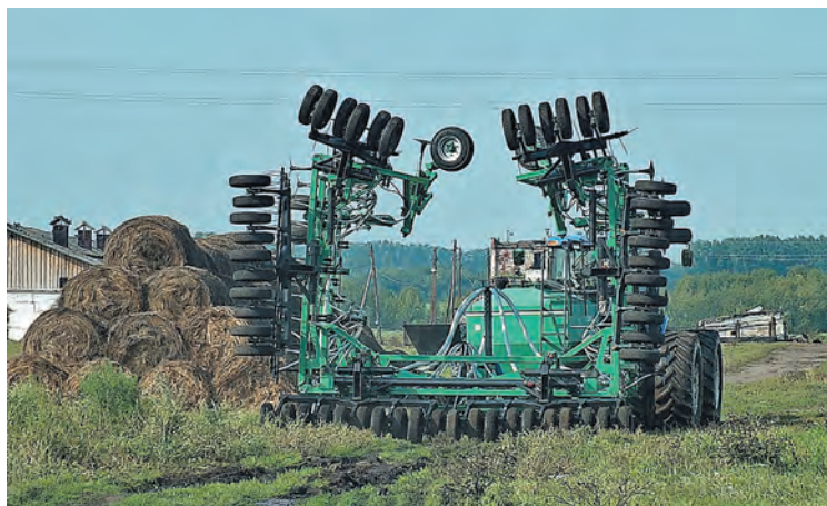
■ ПК «Кузбасс-15,8».

Ровно год назад в таком же праздничном материале на этом же газетном месте мы рассказывали, что компания «Агро» (производитель посевных комплексов «Кузбасс», «Томь», «Борон», граблей и другой сельхозтехники) увеличила объем производства в 2015 году на 70% и в 2016-м намерена сохранять темпы, дабы как минимум удвоить рост по сравнению с 2014 годом. Докладываем: эта цель достигнута. Еще мы писали, что «Агро» решила на беспрецедентный по нынешним временам шаг: построить новый цех. И это строительство сейчас в самом разгаре.