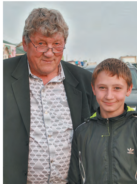
■ Ермолаев-старший с четырнадцатилетним Арсением, который, как и отец, с пчелами работает с восьми лет и бригадирует над племянниками 22 и 28 лет.

Многие хотят завести пчел не для развлечения, а для бизнеса. А из тех, кто опытнее, покупали потерявшие часть пчел во время зимовки. Мы никак не можем по настоящему проводить зимовку, она уносит до 20-30 процентов пчел. В Сибири