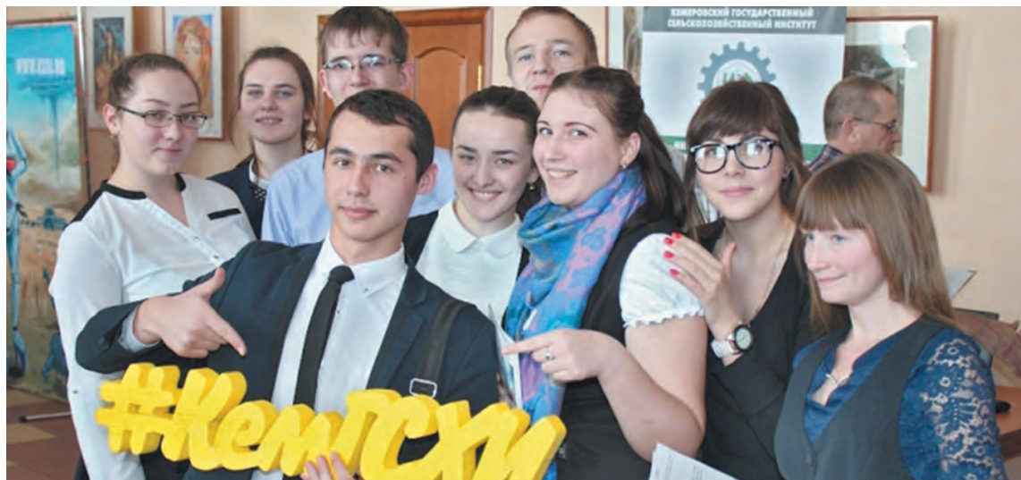
■ КемГСХИ – это круто!

В 2016 году мы начали реализацию нового профориентационного проекта «День аграрного образования и карьеры в муниципальном районе» для информирования школьников о возможностях получения аграрного