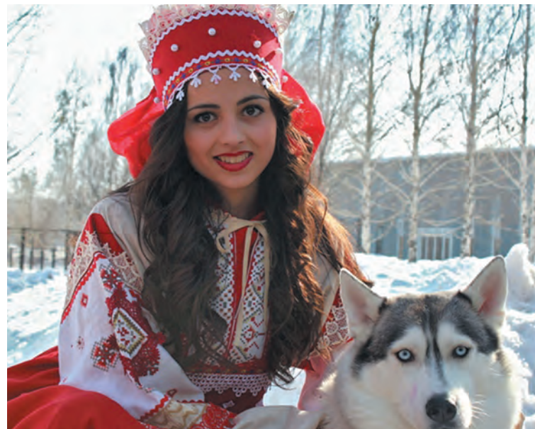
■ Не учёбой единой...