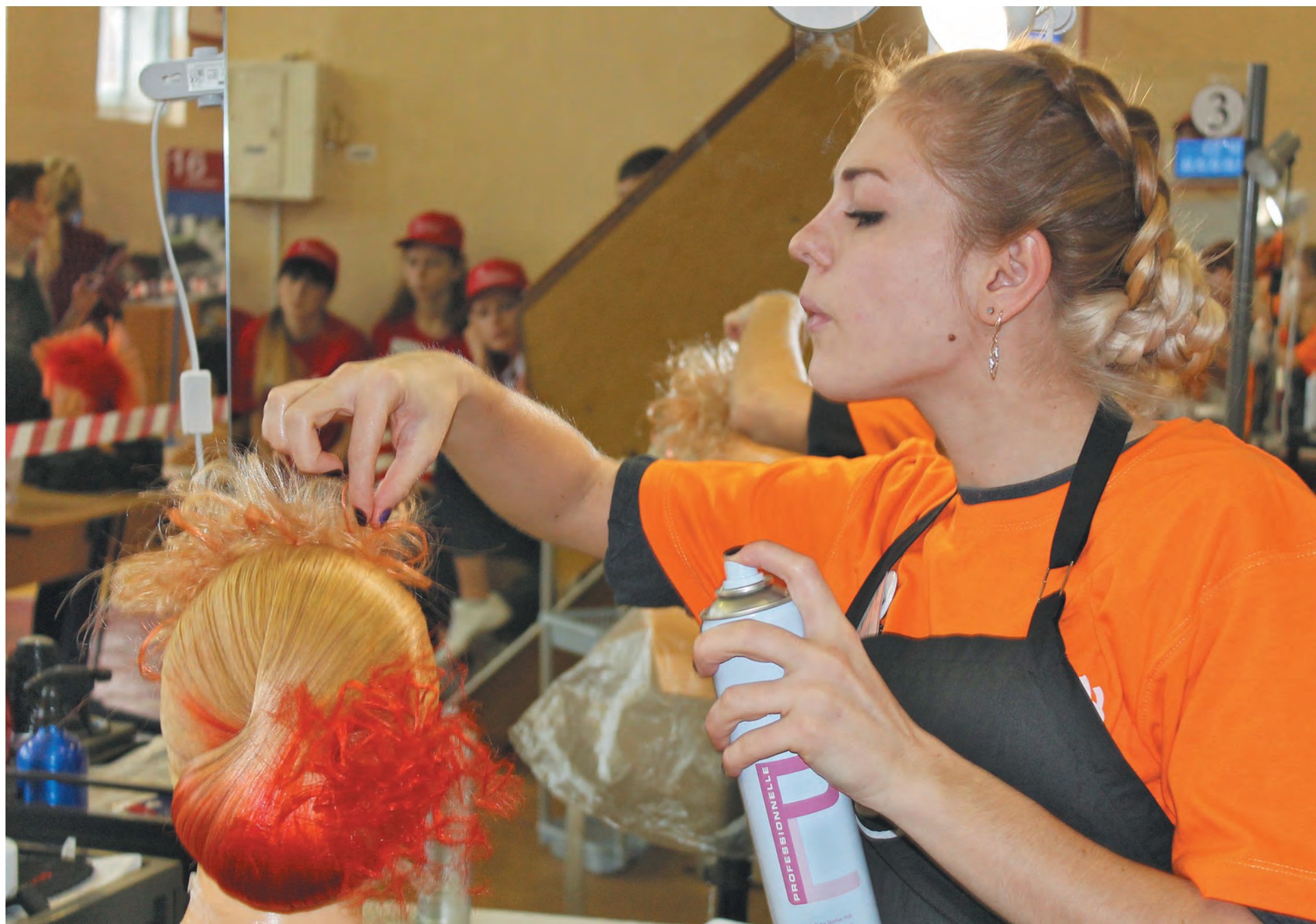
■ «Парикмахерское искусство» – одна из самых ярких и красочных компетенций чемпионата.