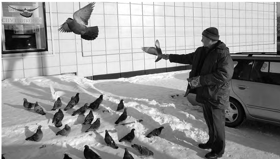
■ Голубиная стая теперь считает его своим...