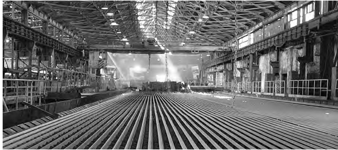
Цепной холодильник. Сортопрокатный цех.

Наступило время, когда без сложных механизмов завод раз-