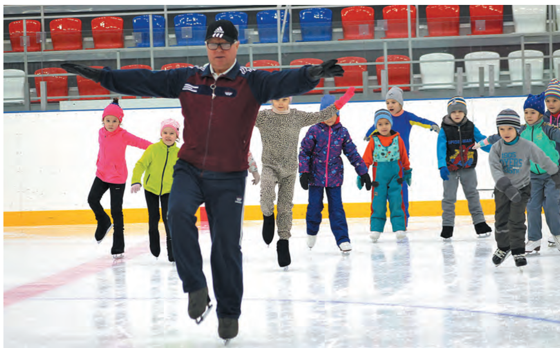
■ Фото Виктора Сохарева.

– Чем больше детей – тем больше шансов для тренера присмотреть талантливых звездочек спорта?