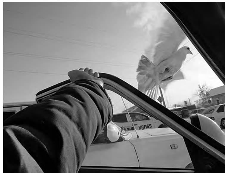
■ Голубь прилетает к другу, обедает и улетает, чтобы примчаться завтра...