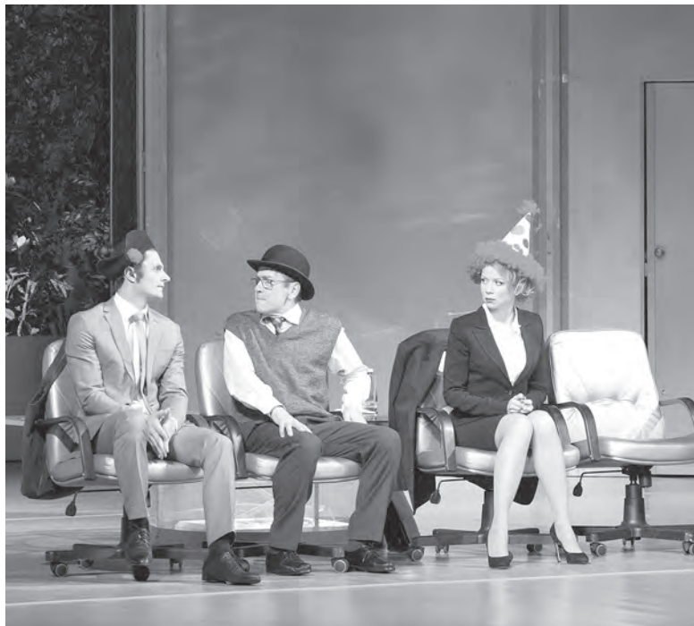
■ Сцена из спектакля «Метод Гронхольма».