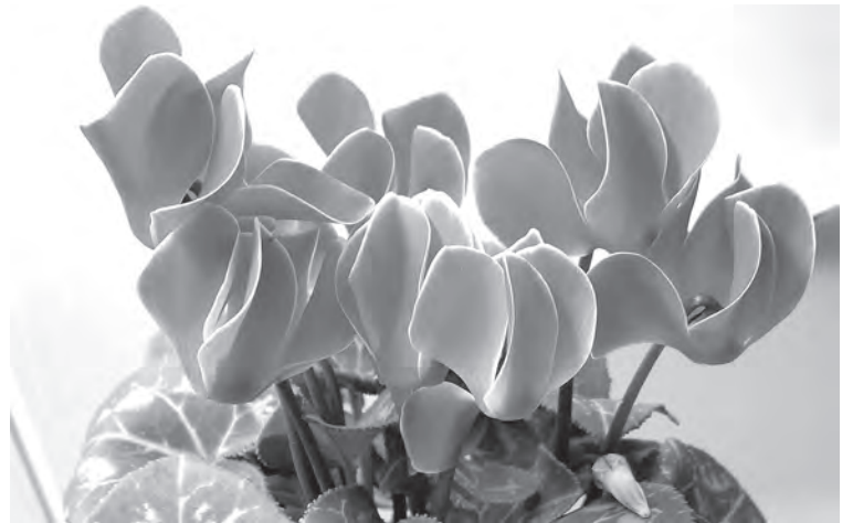
■ Цикламен в пору цветения.

Идеальное место для проживания – светлый подоконник, при температуре не выше 15 градусов и проветривании. В период цвете-