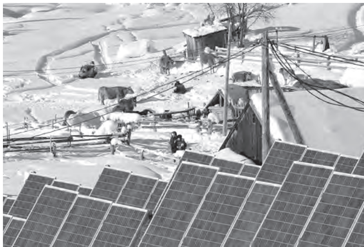
■ Солнечные батареи в Эльбеге.

Из биоэнергетических ресурсов в Кузбассе больше всего древесины. Отходы её переработки и обработки составляют в среднем около 25%. Из них делают пеллеты (производство налажено в Таштагольском районе, в Кемерове и Новокузнецке) – дешёвое и экологичное топливо. Дерево в любом случае выделит CO 2 – сгниёт; сжигая его, мы не увеличиваем выбросов углекислого газа.