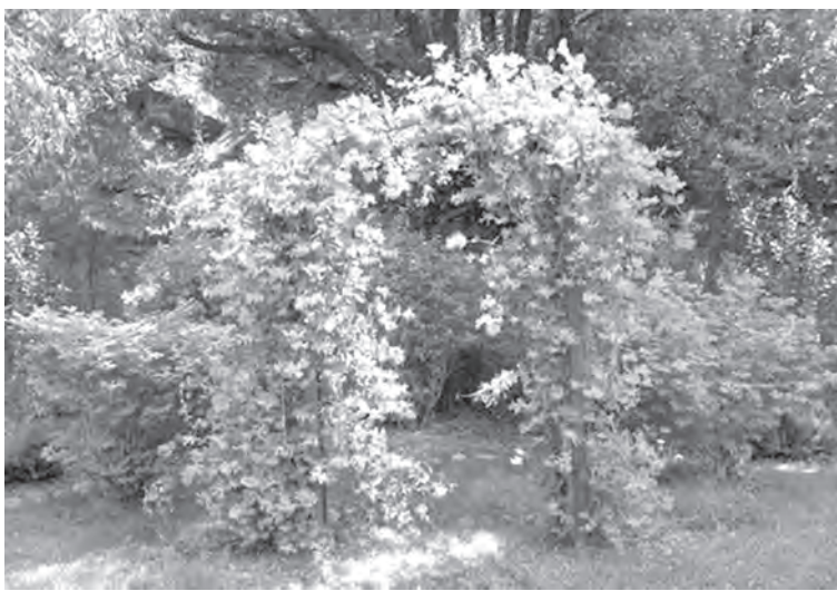
■ Жимолость вьющаяся.

Жимолость съедобная прочно обосновалась на наших садовых участках. Плоды ее – вкусные, ароматные – настоящий клад витаминов. Причем появляются они первыми, открывая ягодный сезон. Но в семействе жимолостных, а это свыше 200 видов, кроме плодоносящих, есть и декоративные лианообразные формы.