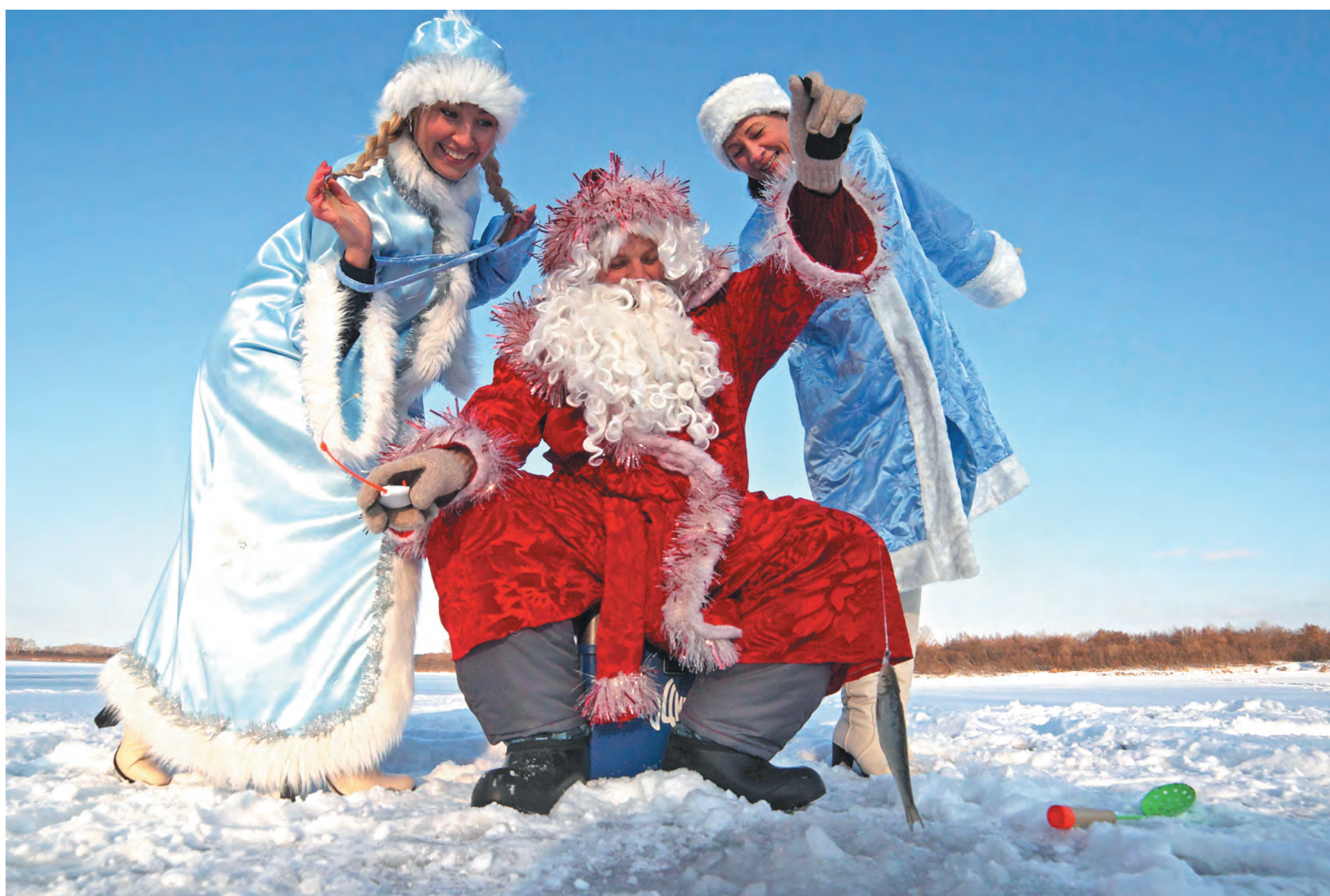
■ Юргинские рыбаки костюмированным праздником отметили начало зимней рыбалки.