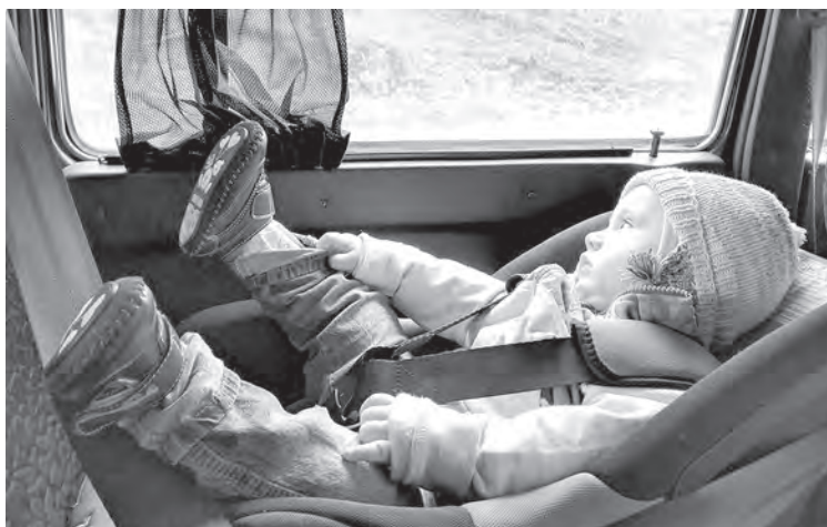
■ Фото Федора Баранова.

Цель изменений в законодательстве – исключить любую