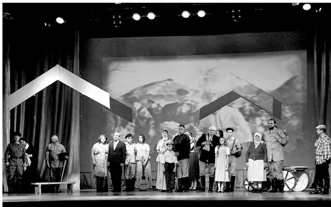
■ На Ивановской земле самодельные артисты из Тяжинского района выступили уже в третий раз.