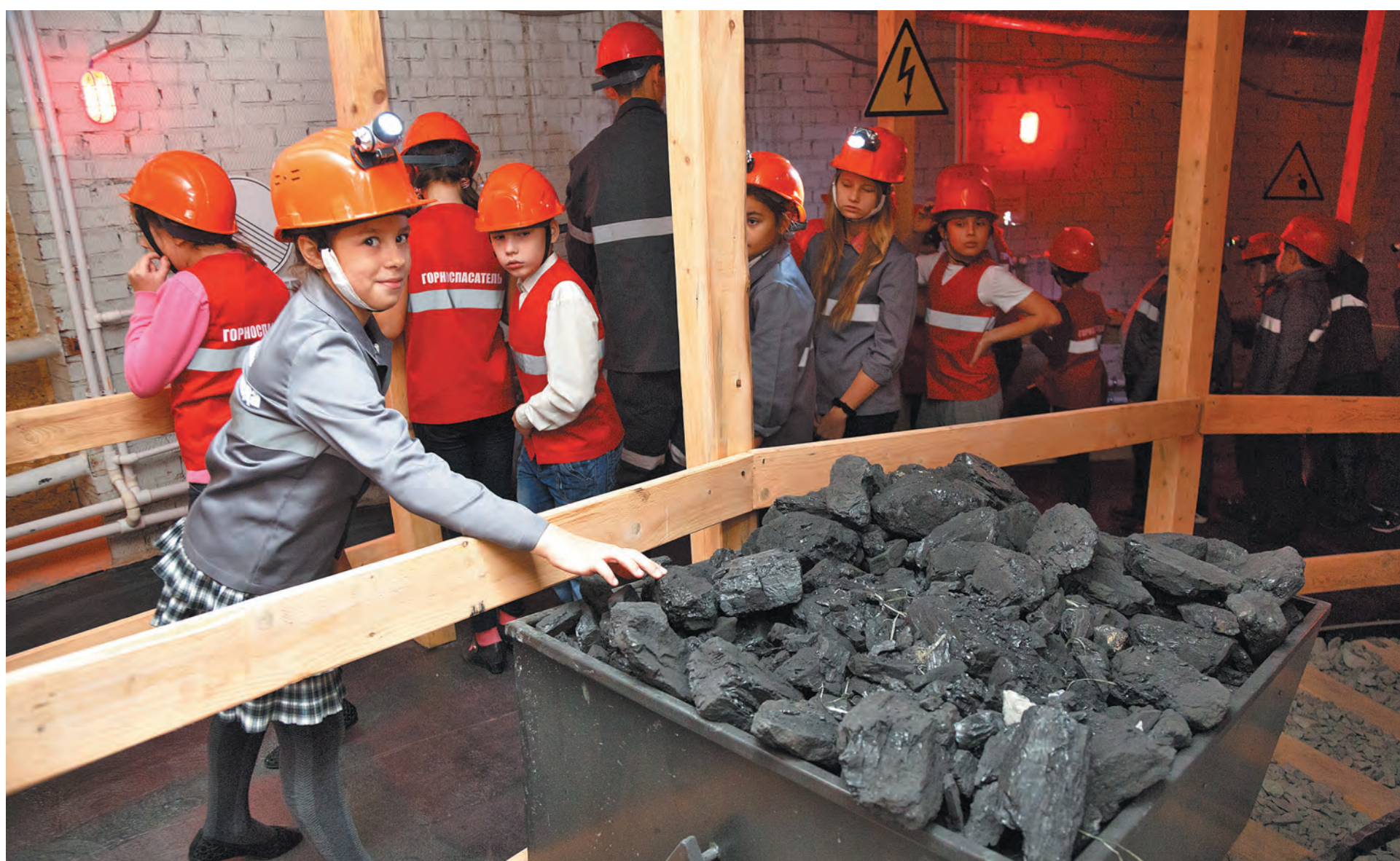
■ Честь перерезать красную ленточку выпала ученикам кемеровской школы №40 - они и примерили на себя шахтерские каски первыми.