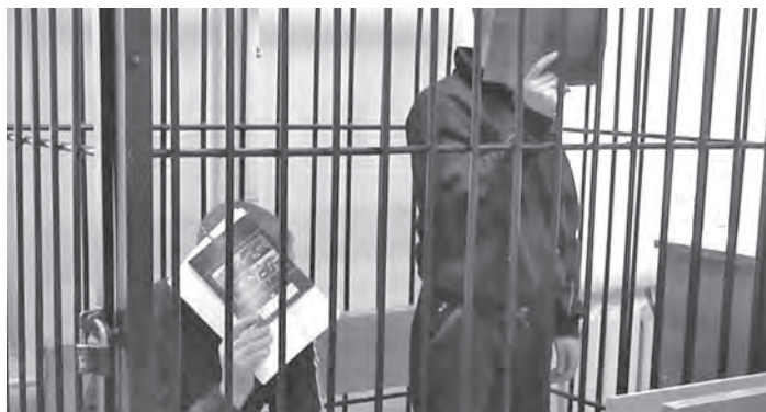
■ На судебном процессе фигуранты уголовного дела закрывались от наведенных на них фото- и видеокамер.

Как сообщает пресс-служба регионального полицейского главка, процесс в Центральном районном суде города Новокузнецка продолжался около