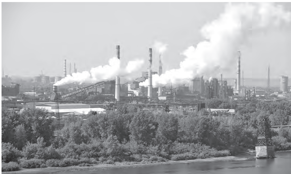
■ 77,7% промышленных выбросов в Кузбассе удаётся уловить и обезвредить.

По данным наблюдений Кемеровского гидрометцентра,