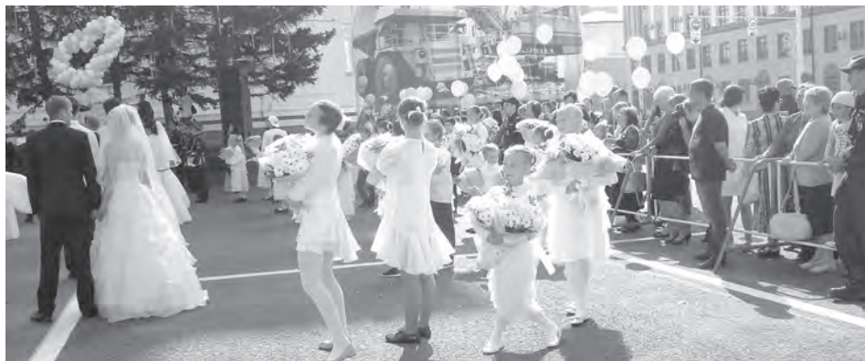
■ Такие милые свадебные ангелочки Татьяне только снились...