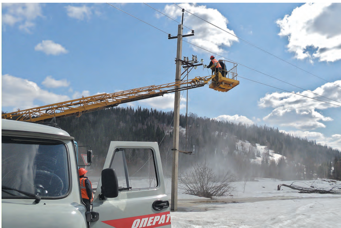
■ Работа на линии филиала «Энергосеть г. Таштагола».