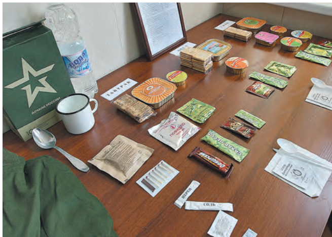
■ Солдатский сухпак на сутки – это полноценные завтрак, обед и ужин. Если содержимое пакета разложить на столе, продукты питания займут почти всю площадь.

Моего сына этой осенью должны призвать на службу в армию. Нам сказали, что перед отправкой он вместе с ребятами несколько дней будет жить в Кемерове на призывном пункте. Какие там бытовые условия, хорошо ли там кормят? Можно ли дать сыну с собой немного продуктов, чтобы наш ребенок не оголодал?