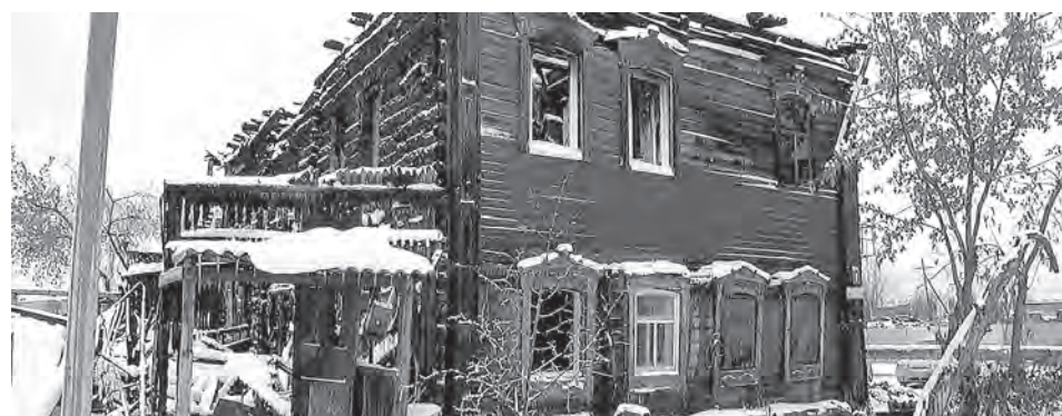
■ Сгоревший дом на улице Чердынцева в Мариинске.

В настоящее время решается вопрос о поощрении отличившихся сотрудников полиции Мариинска.