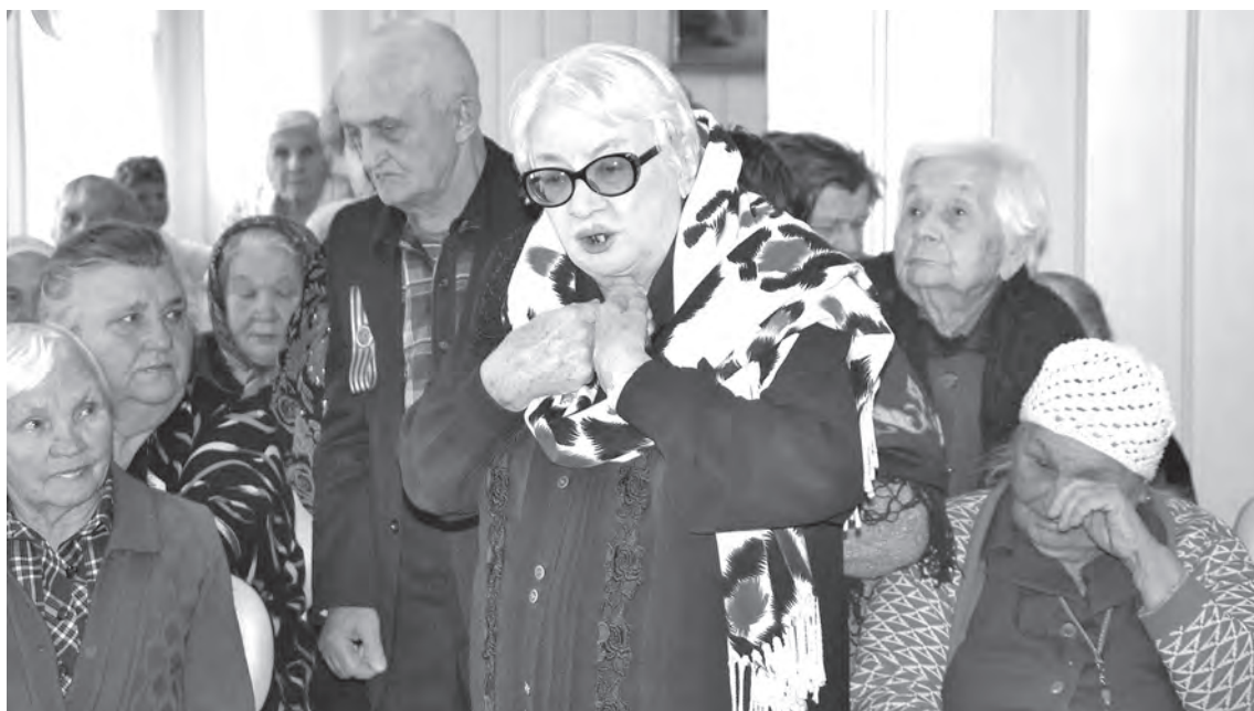
■ Жильцы Дома ветеранов не хотят попасть в жернова оптимизации.

Дом ветеранов в Прокопьевске действует с июня 1997 года. Его строили специально для участников Великой Отечественной войны и их вдов, жителей блокадного Ленинграда, узников концлагерей... Посыл был такой: помочь пожилым людям как можно дольше сохранить активный образ жизни, предоставляя при необходимости возможность для комплексного социального обслуживания. Поэтому наряду с квартирами здесь были предусмотрены общественные поме-