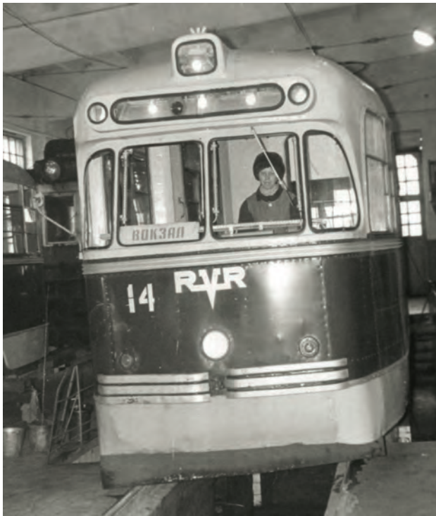
■ Знаменитый рижский трамвай в Осинниках, который перевозит пассажиров до сих пор.