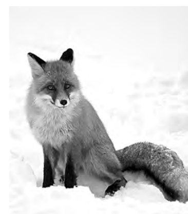
■ Лиса на горе Зеленая не боялась людей, и сфотографировать ее можно было с любого маршрута.

Выход шерэгешской лисы к людям прокомментировал «Кузбассу» завкафедрой зоологии и экологии КемГУ Николай Скалон: