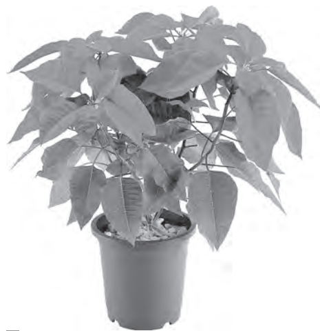
■ «Звездная» пуансетия.

Зима еще только пробует свои силы, а мы уже тоскуем по краскам лета, и поэтому так радостно видеть на подоконнике цветущие растения. И хотя зимнецветущих не так уж мало, самое, пожалуй, оригинальное растение из этого ряда — молочай красивейший, или пуансетия.