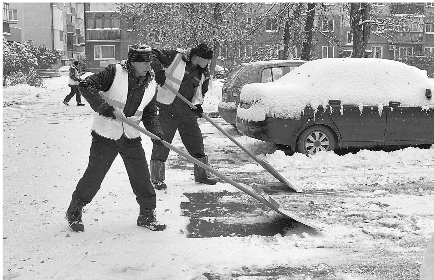
■ РЕКОРД В ПОЛМЕСЯЦА. Более 50% декадной нормы снега выпало в Кемерове только за одну ночь, с понедельника на вторник. Все городские службы благоустройства переведены на усиленный режим работы. Граждан просят воздержаться от парковки машин вдоль основных магистралей, чтобы дать возможность работать снегоуборочной технике. Кроме этого, коммунальщики очищали дворные территории вручную, с помощью обычных лопат.