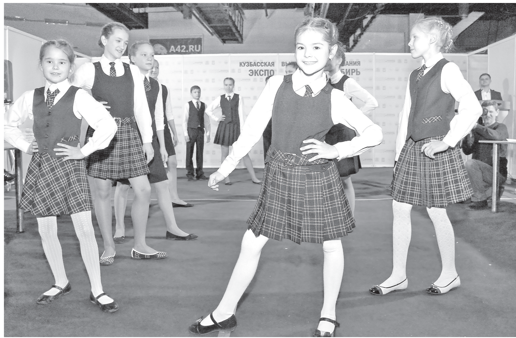
Производственные мощности кузбасских предприятий могут закрыть 100% рынка школьной формы. Цель на 2016 год – удержаться на докризисном уровне в 30%, надежда – к 2018-му выйти на 80%.

Производителей школьной формы поддержит правительство