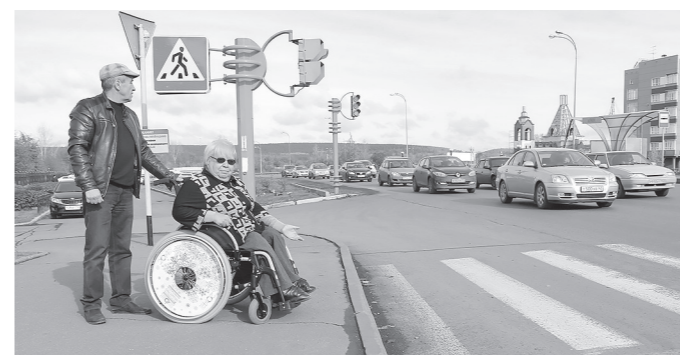
Очень много пешеходных переходов в Кемерове недоступны для инвалидов-колясочников, поскольку не оборудованы съездами на проезжую часть.