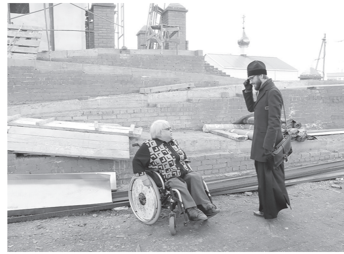
Новый храм Воскресения Христова возводится с пандусом, который пришлось делать многоуровневым, чтобы удобно было им пользоваться.