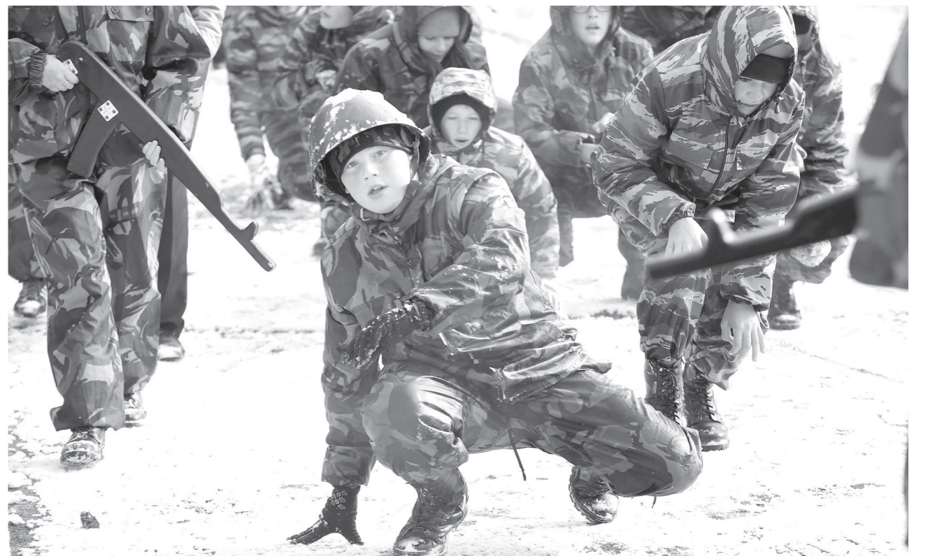
ПОСВЯЩЕНИЕ КУРСАНТОВ. В конце первой четверти в средней школе №14 Юрги восьмиклассники двух новых классов полиции, набранных с начала учебного года, прошли ритуал посвящения и стали полноправными курсантами. Почти 50 мальчишек и девчонок под ободряющие крики старших товарищей преодолели траншеи, горки, змейки и иные препятствия, построенные в школьном дворе по армейским образцам. Такое традиционное испытание на силу духа и физическую выносливость способствует выработке у подростков новых форм группового взаимодействия, коллективной сплоченности.