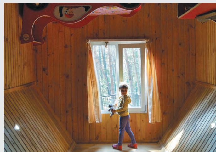
Алиса Лоскутова, 5 лет

Мы летом ездили на Байкал. И были там шесть дней. И там поймали рыбку, но она была слишком маленькой, и мы ее отпустили. Я даже видел вынырывающих нерп. Мы с братом и друзьями (которые приехали аж из Москвы) купались часто, а взрослые редко, потому что была прохладная вода. А еще я там видел скелет собаки.