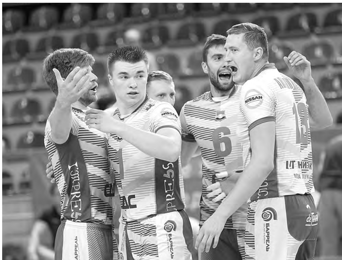
Кемеровская команда одержала победу в стартовом матче Кубка России.