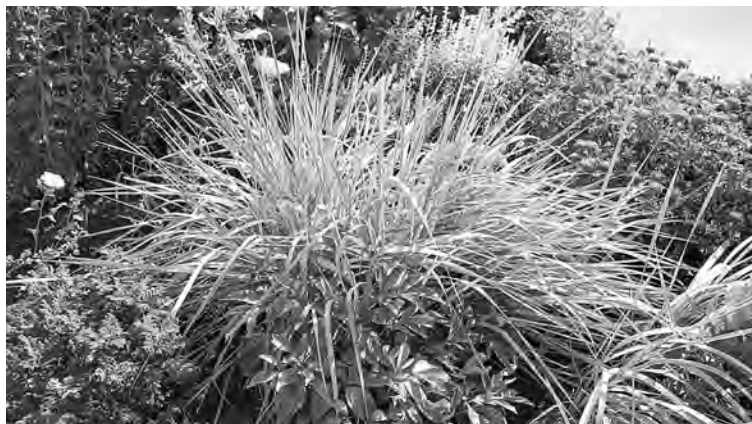
■ Колосняк на клумбе у подъезда.