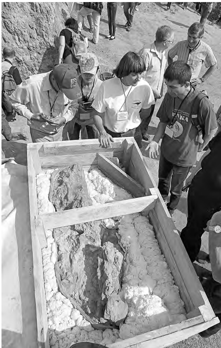
Члены симпозиума ЮНЕСКО на полевой экскурсии в Шестаково.