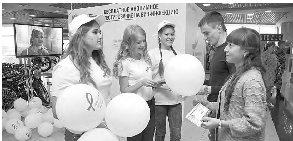
■ Акция в ТЦ «Лапландия».