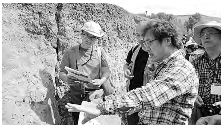
Меловые отложения, богатые на находки мезозойской фауны, представляют для мировой науки большой интерес.