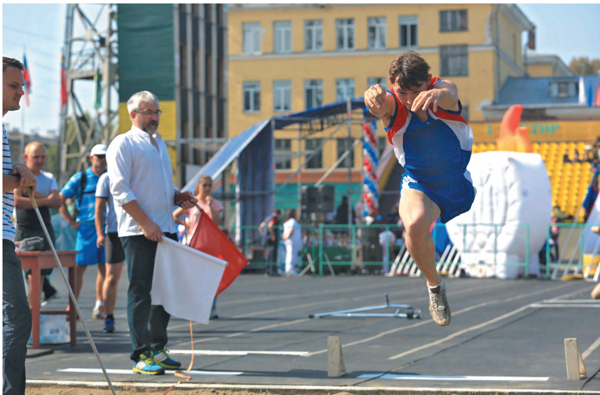
■ Фото Ярослава Беляева.