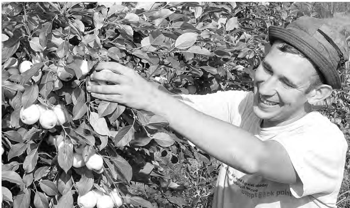
■ Дары сада.

Собирая яблочки, обязательно снимайте поврежденные или мумифицированные плоды. Их, а также испорченную падалицу непременно сжигайте или глубоко закапывайте в землю где-нибудь на меже. Тем самым вы обезопа-