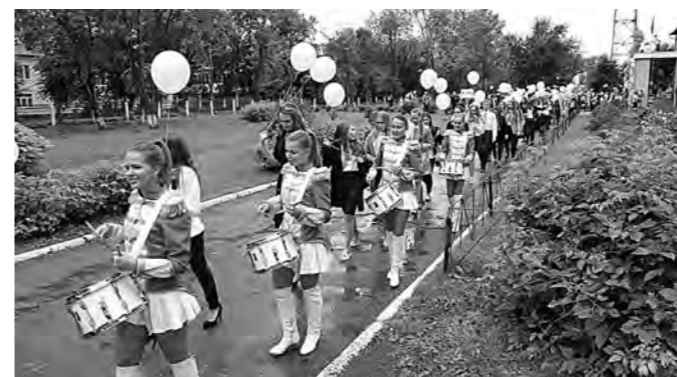
Еще секунда, и сотни гимназистов обнимут родную школу, выступив в небо воздушные шары.