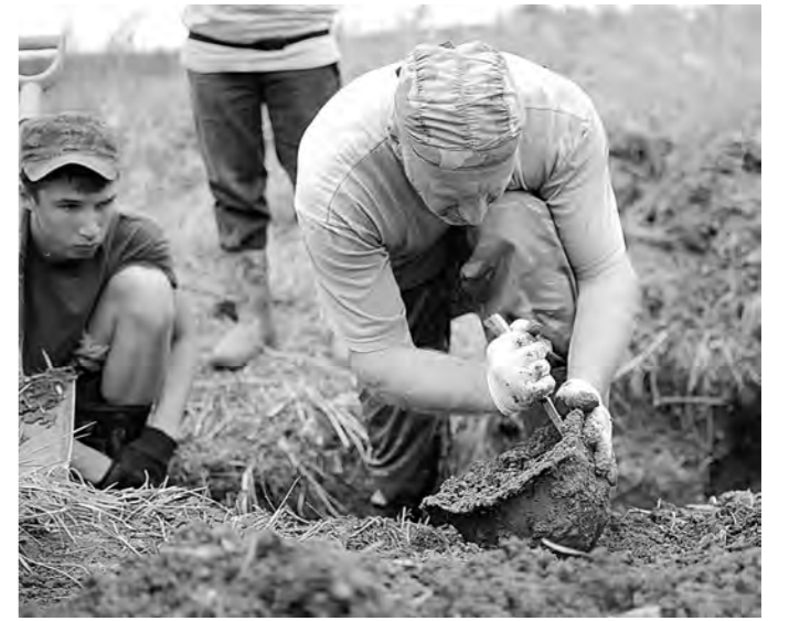
Еще одна находка.

У поисковиков есть свои традиционные приметы и суеверия. Например, они давно заметили, что природа помо-