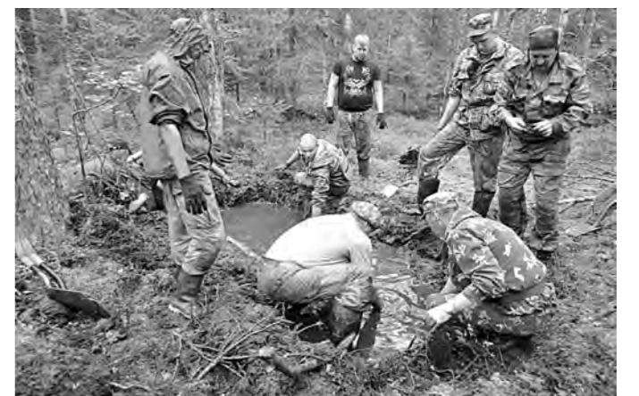
Так поднимали политрука.