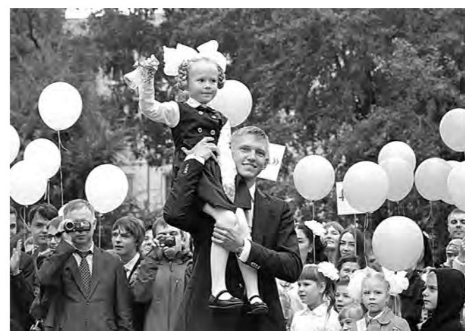
Эстафету от выпускников-гимназистов принимают первоклашки.