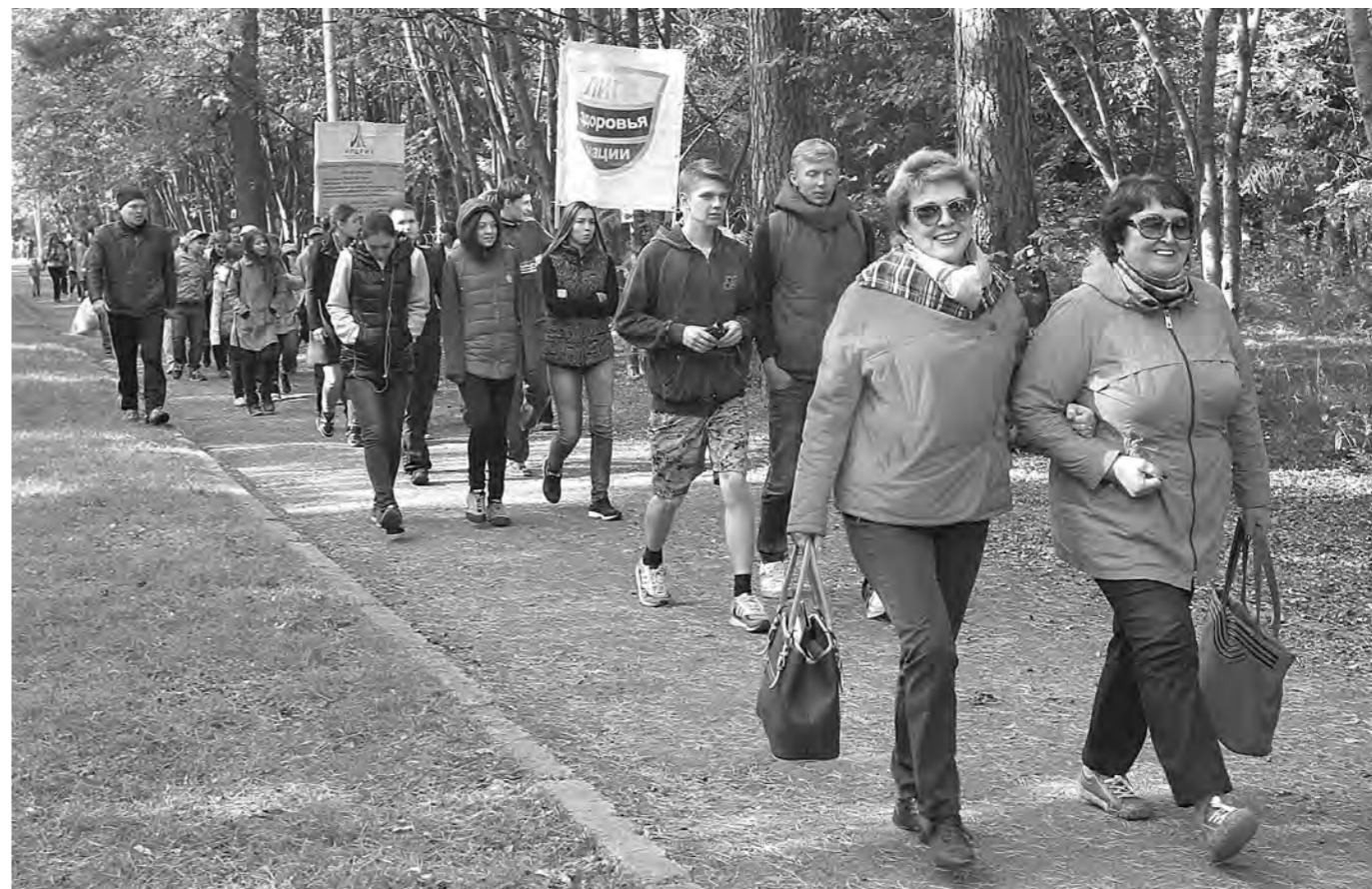
«10 000 ШАГОВ К ЖИЗНИ» – так называлось занятие, которое проводилось в Сосновом бору Кемерово в рамках одноименного проекта общероссийской общественной организации «Лига здоровья нации». Практический урок провел сертифицированный инструктор. Сначала была разминка, а затем ходьба. Цель проекта – профилактика сердечно-сосудистых заболеваний, формирование у населения культуры здорового образа жизни.