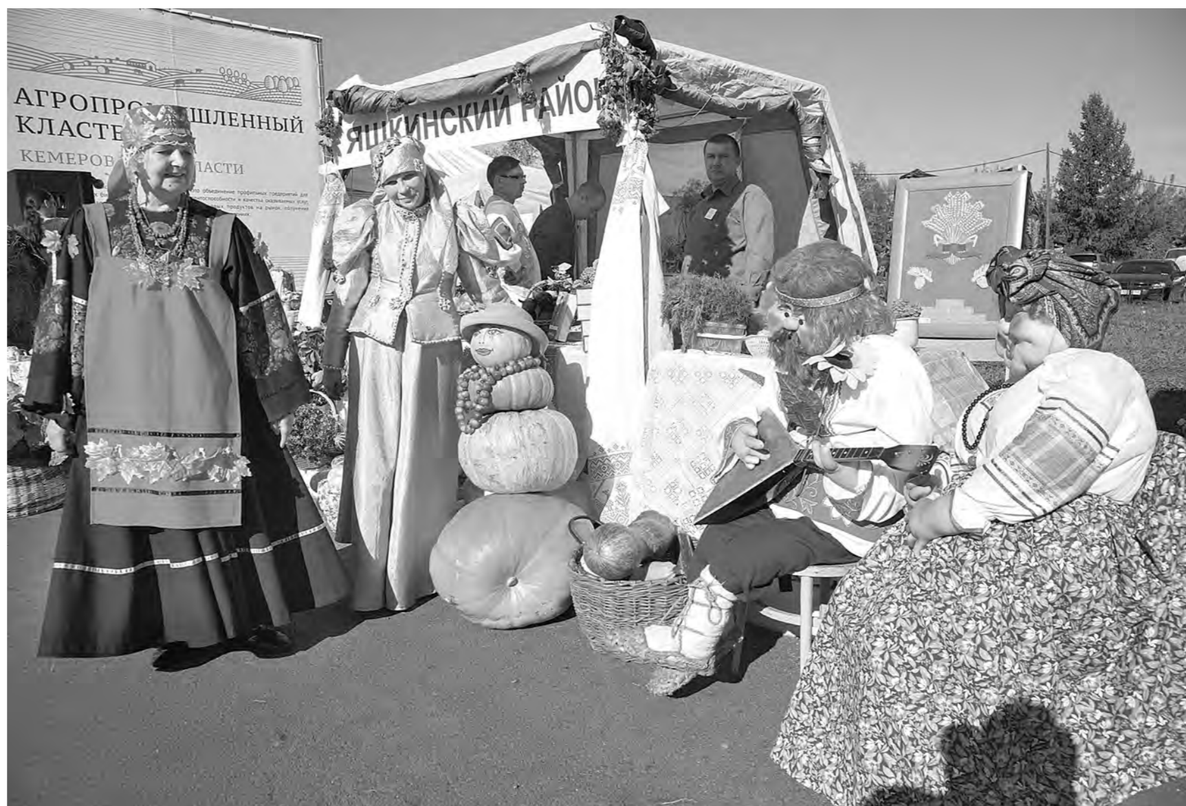
Одна из мер поддержки дачников и садоводов в Кузбассе – ярмарки, на которых они могут реализовать излишки урожая.

Снижение тарифов на электроэнергию для садовых обществ, бесплатные семинары и мастер-классы для «мичуринцев» – это далеко не полный перечень новых беспрецедентных мер поддержки дачников, вводимых в Кузбассе.