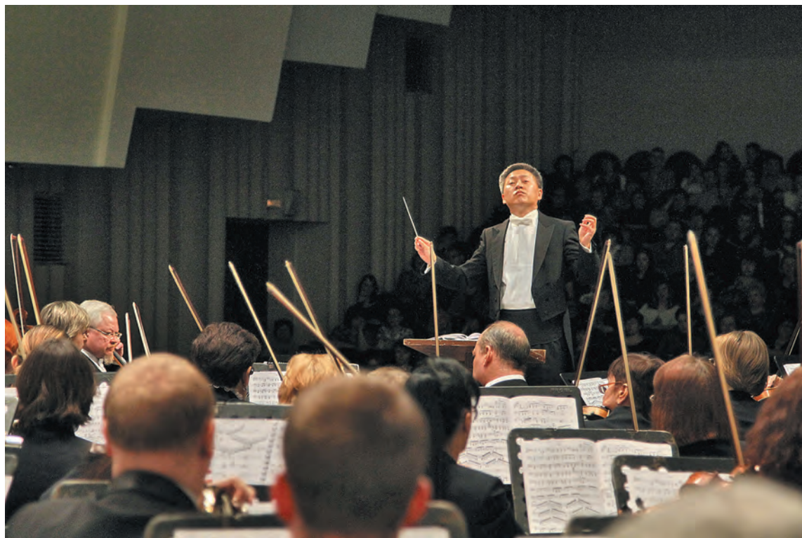
Государственный симфонический оркестр.

Сегодня Государственный оркестр – единственный профессиональный симфонический коллектив в области. Представители научного музыкознания считают: