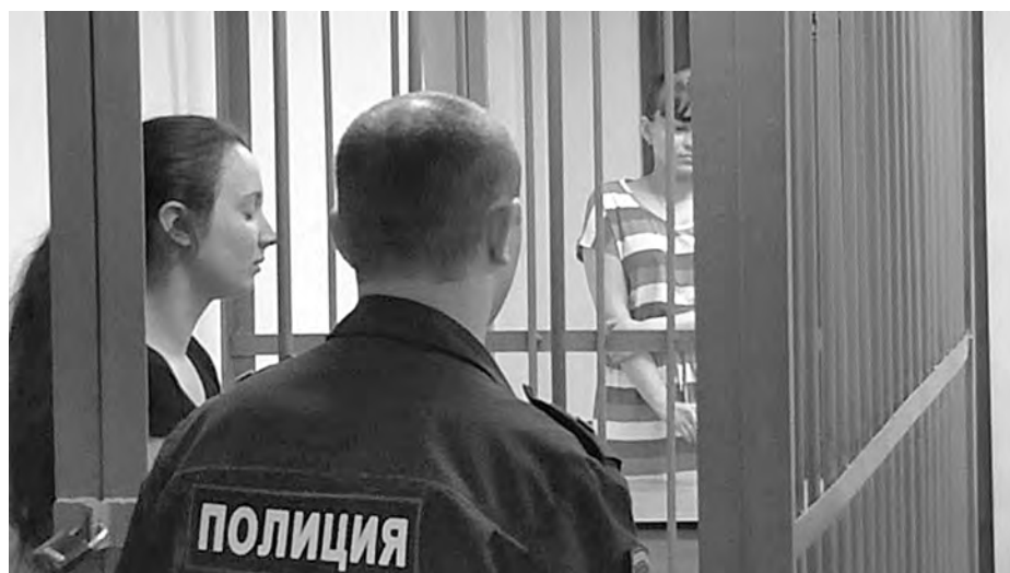
■ Момент вынесения судебного приговора девушке за приготовление к убийству по найму своего отчима.

«Под видом будущих исполнителей преступления оперативные сотрудники УМВД России по г. Новокузнецку встретились с заказчицей, обсудили способ убийства, оплату и форму отчетности. Примечательно, что сотрудники попытались выяснить, действительно ли девушка хочет расправиться с мужчиной, предложив ей просто проучить отчима, например, избить его. Но девушка