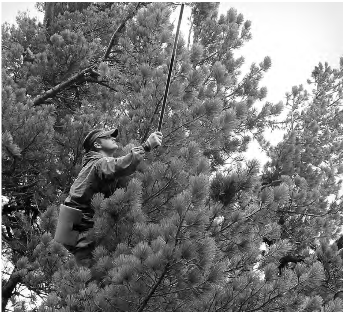
Далеко не все собирают шишку правильно – без вреда для деревьев.

В 2009 году областные законодатели в соответствии с Лесным кодексом отменили лимиты сбора грибов, ягод и орехов для собственных нужд. Раньше кузбассовцы могли вывести не более