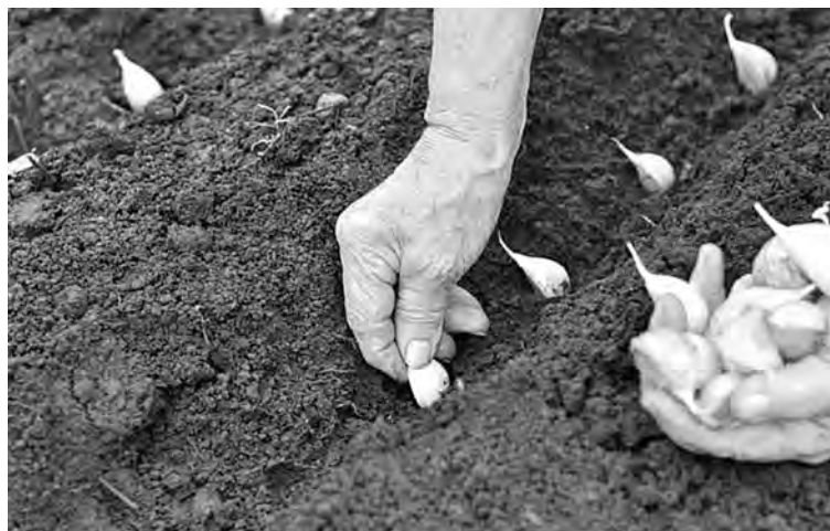
■ Посадка чеснока озимого.