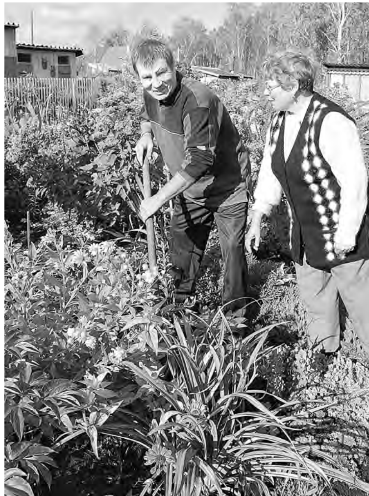
■ Осень — время пересадок.