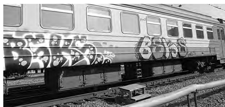
■ Вагоны электропоезда Тайга – Томск, разрисованные граффити «самодельными художниками» из Новокузнецка и Новосибирска.

В настоящее время сотрудники транспортной полиции разыскивают остальных участников