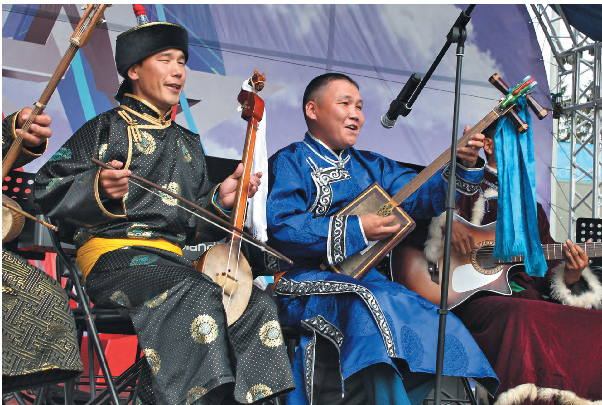
■ Студенческий фольклорный ансамбль КемГИК «Алтын Ай» является частым гостем многих кузбасских праздников.