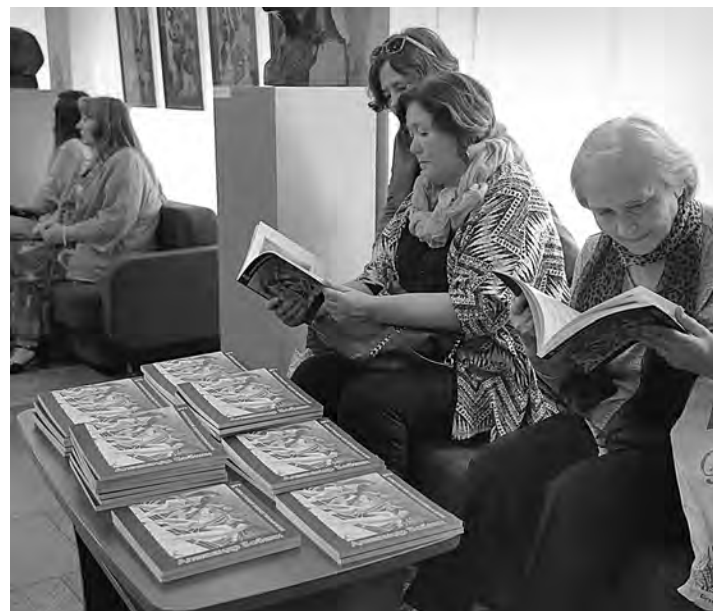
■ Многие работы художника посвящены его малой родине.

«Можно говорить не столько об уникальности его метода, сколько об уникальности его личности, – считает исследователь творчества Бобкина Лариса Данилова. – Уникаль-