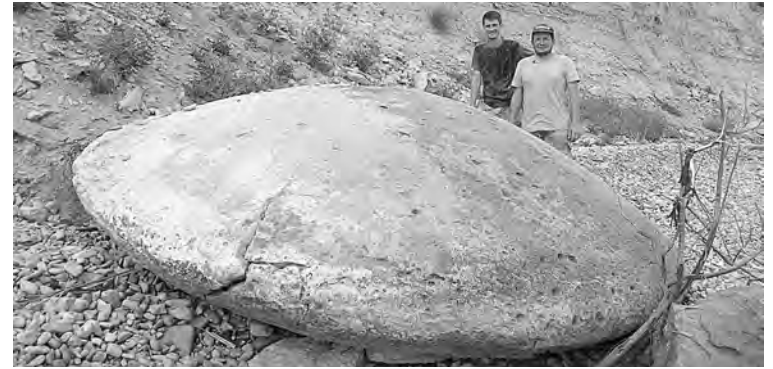
■ ... и этот диск диаметром 4 м под Волгоградом – аналог кыштымской «летающей тарелки», которую еще предстоит достать со дна уральского озера.