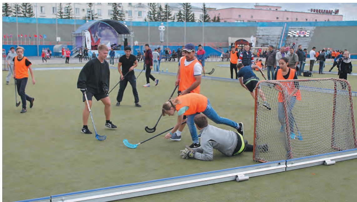
■ В составах нескольких команд играли и представительницы прекрасного пола.

Несмотря на то, что участие в «Кубке СССР» – дело добровольное, команды стараются готовиться к нему регулярно. Ну