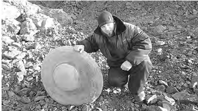
■ По версии «Космопоиска», караканский диск в Кузбассе...