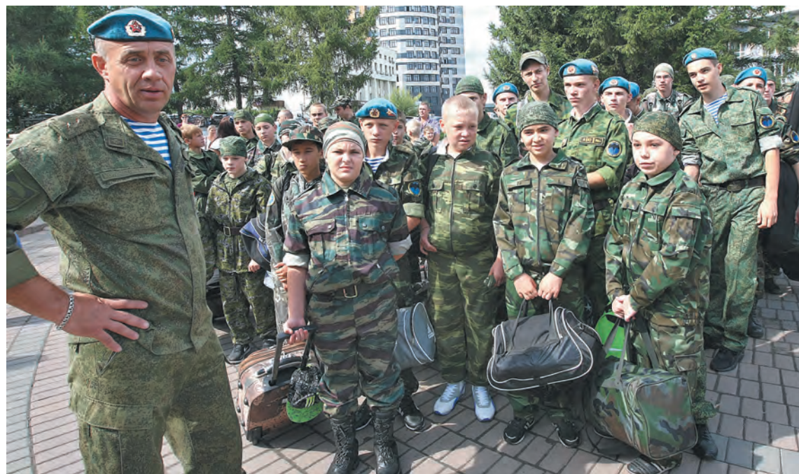
Участники военно-спортивной смены «Разведчик» в детском лагере «Спутник» в рамках патриотической программы «Юная гвардия Кузбасса». Ребята, успешно сдавшие потом все нормативы, получили символы «разведчиков» – береты и тельняшки.