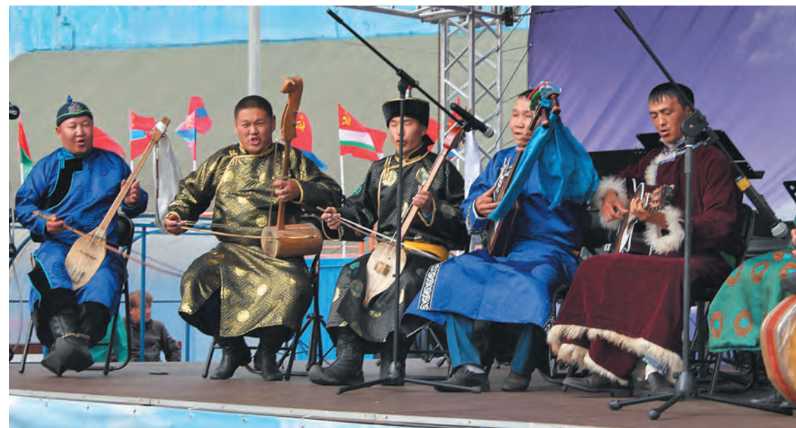
■ Культурная программа «Кубка СССР» была и познавательной, и зажигательной.