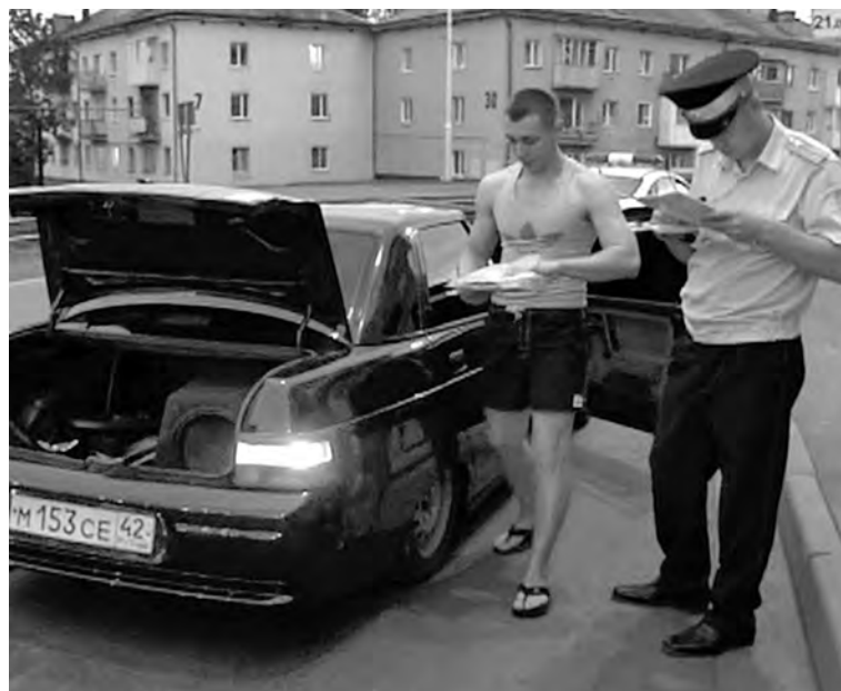
■ Этот слишком «тюнингованный» автомобиль владельцу пришлось регистрировать заново.