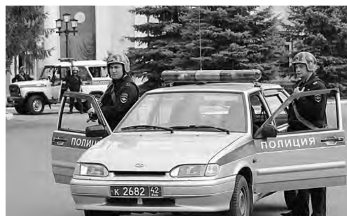
■ На каждом избирательном участке – а всего 18 сентября их в Кузбассе будет открыться 1750 – будут дежурить не менее двух сотрудников полиции.