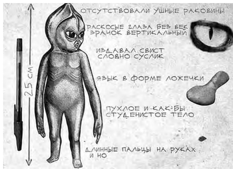
■ Алешенька, реконструкция существа со слов очевидцев, рис. Черноброва, «Космопоиск».

Но все же – искать кого? Точно не землян?