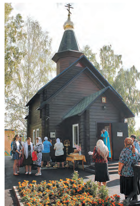
Освящение часовни в честь иконы Божией Матери «Взыскание погибших» в пос. Малиновка.

Дорогие земляки! Природа щедро одарила наш край богатейшими недрами, поэтому уголь для нас – это сама жизнь: свет, тепло, стабильное развитие территорий. А значит, и День шахтера – это особый, один из главных праздников Кузбасса.