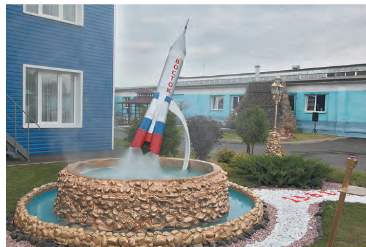
■ «КемВод»: ракета на водяной тяге.

Жителям Промышленной, можно сказать, повезло. Вокруг административного здания нет высокого забора, и поэтому любоваться красотой можно просто прогуливаясь или по пути на работу. Кстати, вся красота и творческая программа, которую представляли в этот день сотрудники СКЭК, создавались без отрыва от производства – в