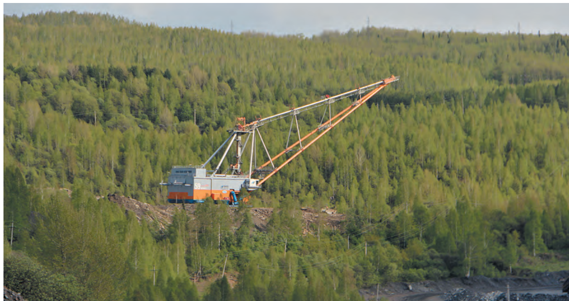
■ На разрезе «Красногорский» к вскрышным работам приступил новый экскаватор ЭШ 20/90.