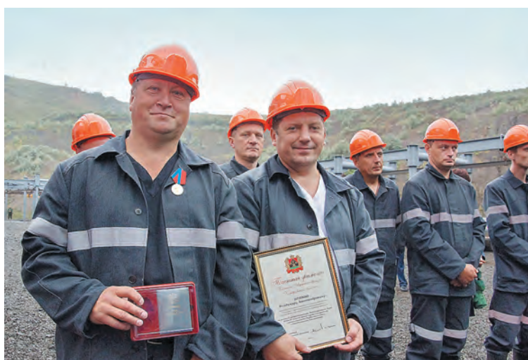
■ Шахтеры «Байкаимской» были отмечены за ударную работу по модернизации производства.

Старый очистной комплекс демонтировали и временно консервировали – его ещё можно будет использовать на определенных горизонтах. Для запуска новой лавы угольная компания решила приобрести и новое оборудование. Выбор пал на китайскую машиностроительную компанию «Тянди» – именно её предложение наиболее соответствовало запросам кузбасских