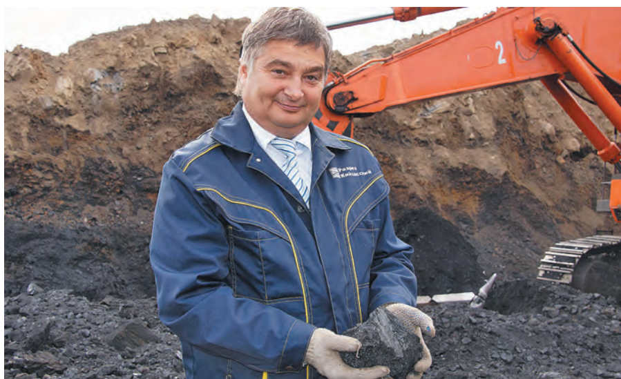
■ На «Кийзасском» добывают в основном энергетические угли «Т» и «ТС».

Молодой разрез «Кийзасский», несмотря на ситуацию в экономике, чувствует себя уверенно. В этом году предприятие собирается выйти на проектную мощность, превысив ранее заявленный показатель добычи почти в два раза. Инвестиции в развитие Мысков и налоговые платежи также вырастут.