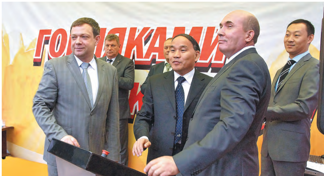
■ Новую лаву с самым современным оборудованием совместно открыли представители руководства области, компании «Кузбассразрезуголь», УГМК-Холдинга, корпорации «Тянди».

В преддверии Дня шахтера на шахте «Байкаимская» в Беловском районе ввели в эксплуатацию новую лаву и новый очистной механизированный комплекс производства КНР, изготовленный по специальному заказу компании «Кузбассразрезуголь». Современное оборудование позволит предприятию выйти на проектный уровень добычи в 2,5 млн тонн угля в год.