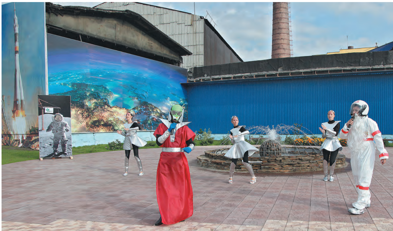
■ «Березовские коммунальные системы»: на месте старой котельной теперь фонтан.

На Центральной котельной «Берёзовских коммунальных систем» масштабы преобразований и благоустройства территории приобретают поистине космический размах. На месте уютных аллей, альпийских газо-