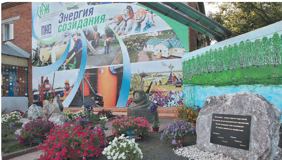
■ «Промышленновские коммунальные системы»: в честь героев космоса.