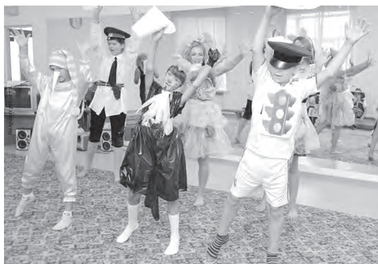
■ Спектакль, посвященный правилам дорожного движения.

Стоимость одной путевки составляет 18 000 рублей, однако работник оплачивает всего 20% от этой суммы, остальные рас-