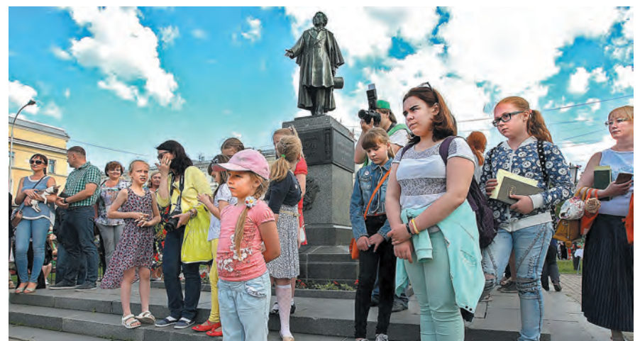
■ Фото Федора Баранова.