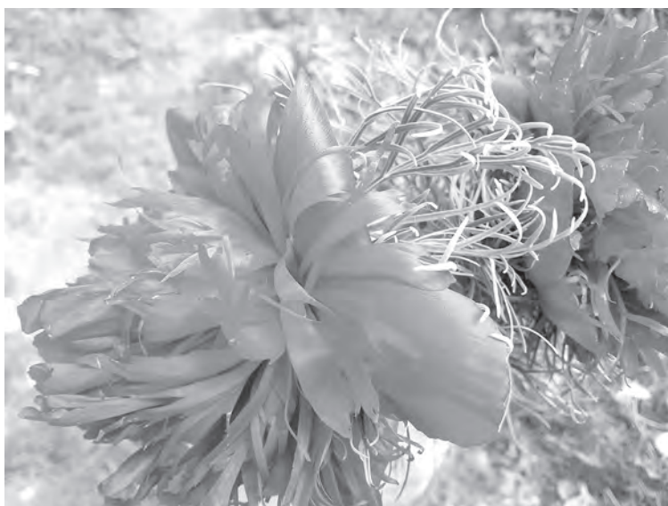
■ Пион тонколистный.