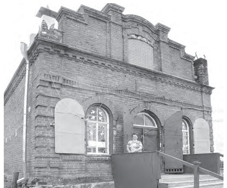
■ Он же памятник!