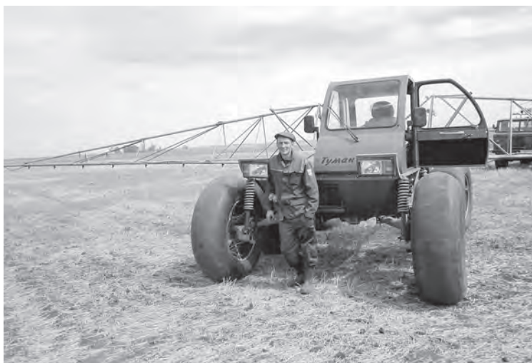
■ Без обработки полей от вредителей и сорняков шансы на урожай резко снижаются.

Выход – и это одна из «точек роста» – более серьезное отношение к технологии возделывания