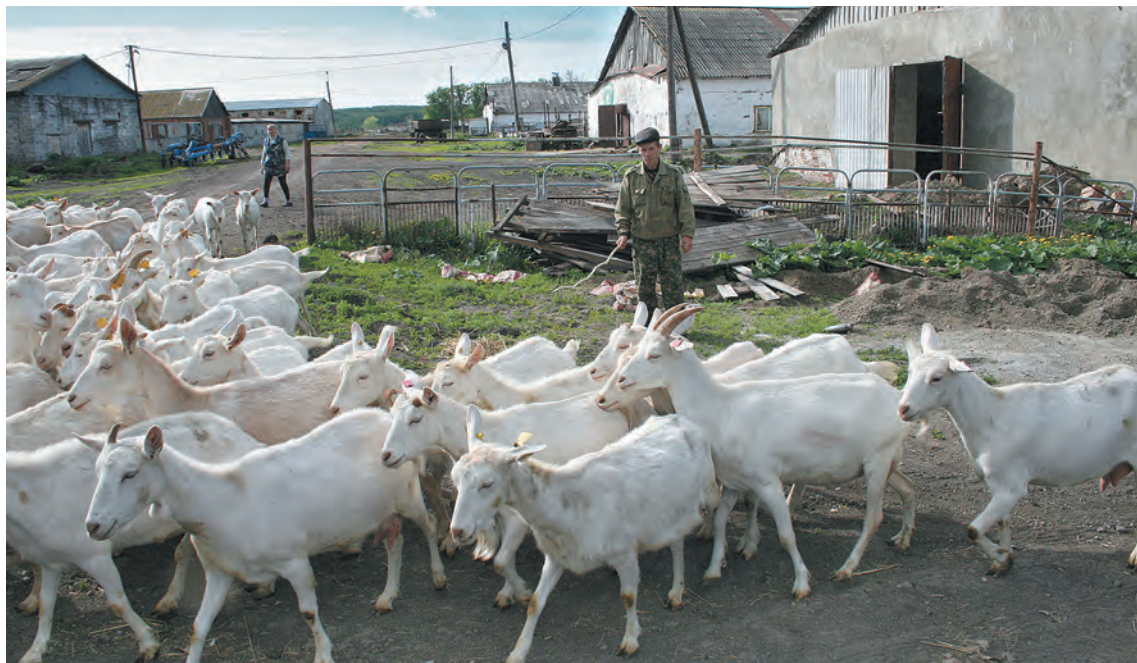
■ Вперед, в поля.