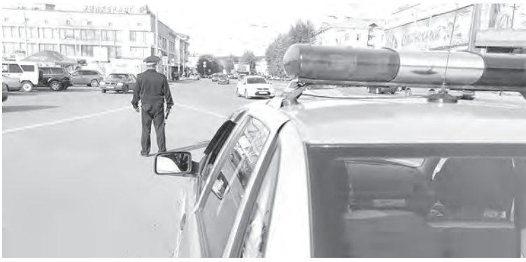
■ Фото Сергея Гавриленко.