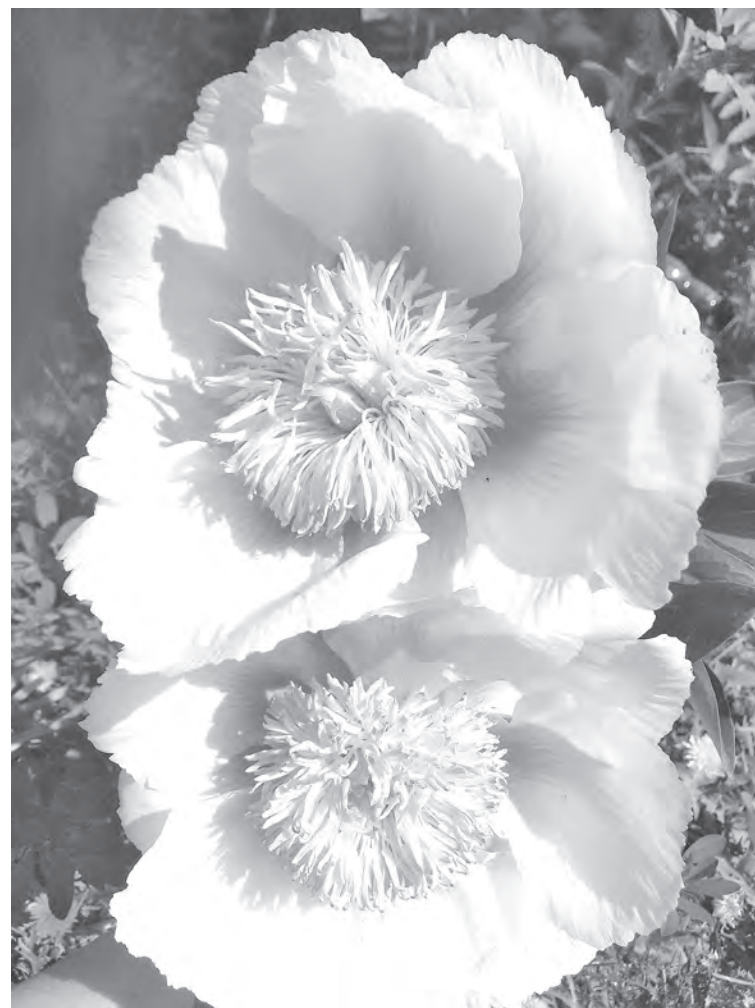
■ Пион молочнокветковый сорта Афина.

Недостаточное питание ослабляет куст, сил хватает только на рост побегов; то же самое, если пионы посажены в бедную ор-