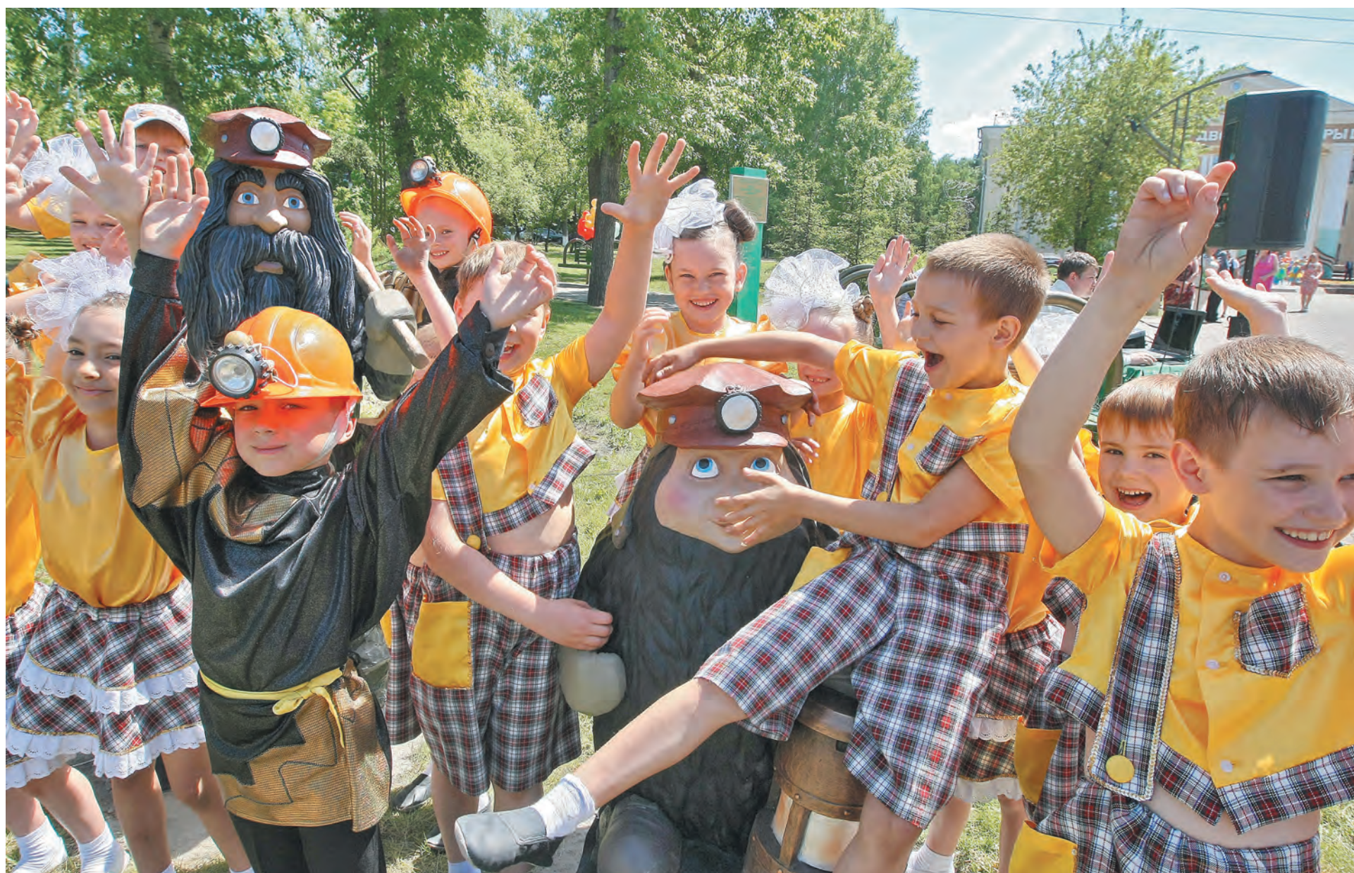
■ Новая скульптурная композиция «Угольки» установлена в парке в ДК шахтеров - популярном месте семейного отдыха жителей Рудничного района.