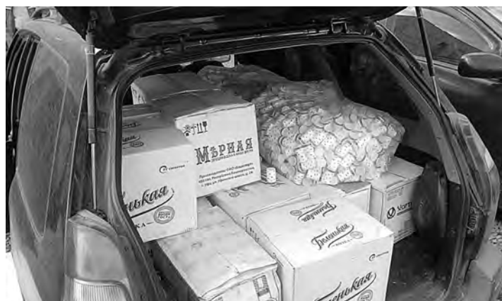
■ Подозрительный автомобиль был буквально забит контрафактным алкоголем.

О подозрительном «магазине на колесах» в кемеровскую полицию сообщили жители города. И вскоре машина была задержана на одной из улиц. В салоне полицейские обнаружили коробки с бутылками, в которых находилось в общей сложности более 200 литров сомнительного алкоголя. И хотя на бутылках красовались названия довольно известных марок водки и виски, качество самих этикеток оставляло желать лучшего, да и наклеены они были очень плохо. Здесь же полицейские нашли и большое количество пробок для бутылок. Как рассказали в пресс-службе ГУ МВД России по Кемеровской