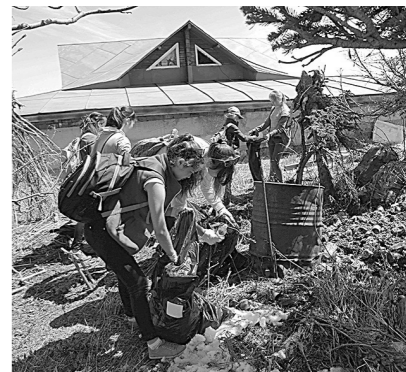
Пикник на чистой горе 3