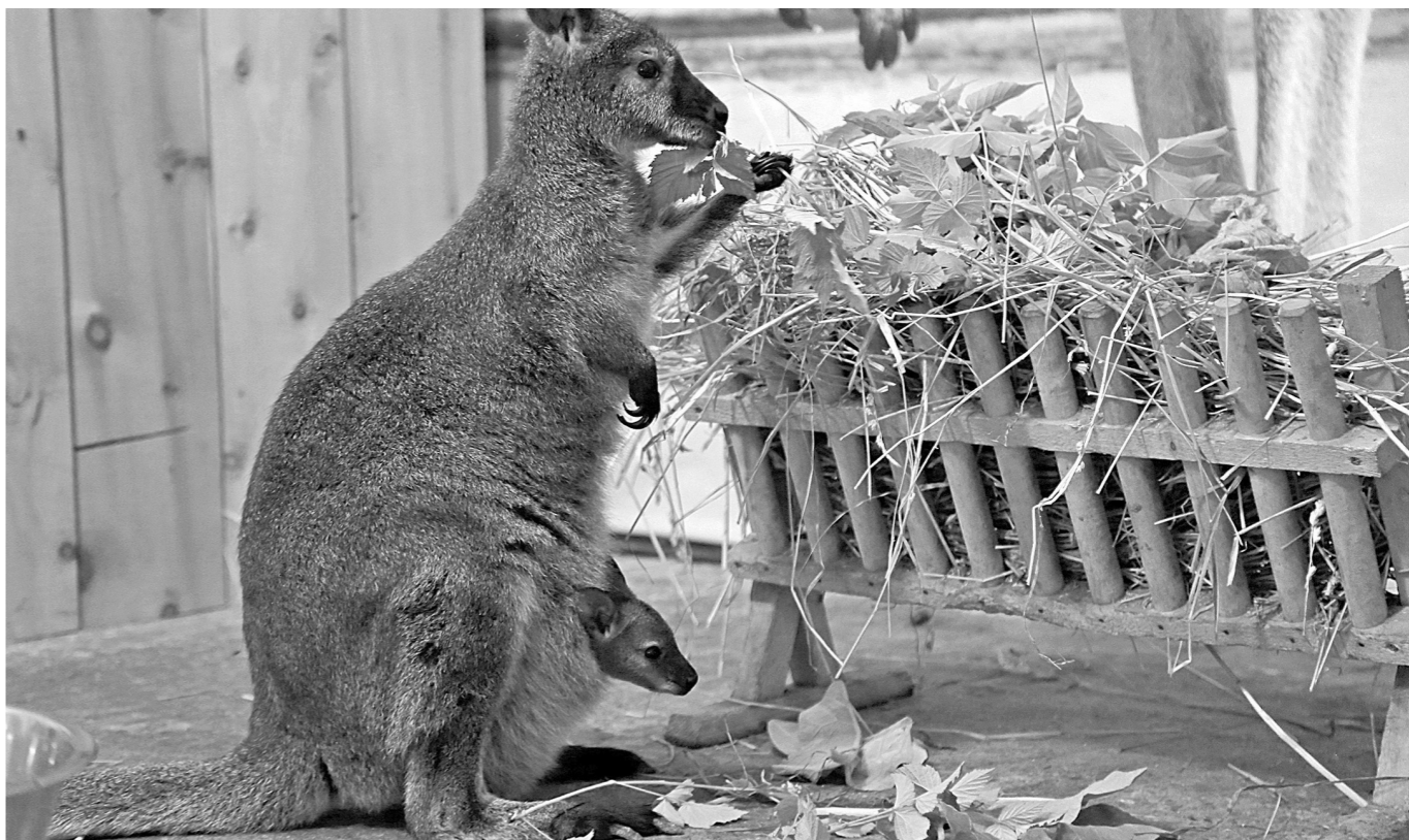
ПОПОЛНЕНИЕ У КЕНГУРУ. В Новокузнецком зоопарке «На Садовой» у кенгуру вида Бенетта – Кляксы и Робина - появился первенец. Само его рождение сотрудники зоопарка проглядели – слишком мал был младенец, около сантиметра. Через несколько недель в сумке молодой мамы было замечено шевеление. Сейчас юный кенгуру, которому примерно четыре с половиной месяца, уже выходит погулять. Малыш прыгает вокруг матери и даже пытается попробовать взрослую еду – фрукты и зелень. Интересно, что в зоопарке почти одновременно появилось потомство у рысей, лис и канадских волков. А детёнышу кенгуру предстоит придумать имя. Сотрудники зоопарка даже планируют объявить конкурс.