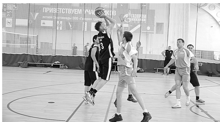
Самыми яркими и зрелищными стали игровые виды спорта.

С бурного приветствия 23 спортивных команд и яркого красочного шоу в исполнении танцевальных коллективов и воздушных гимнастов началось торжественное открытие 7-й летней спартакиады компании «Газпром трансгаз Томск» в легкоатлетическом манеже «Гармония» в Томске.