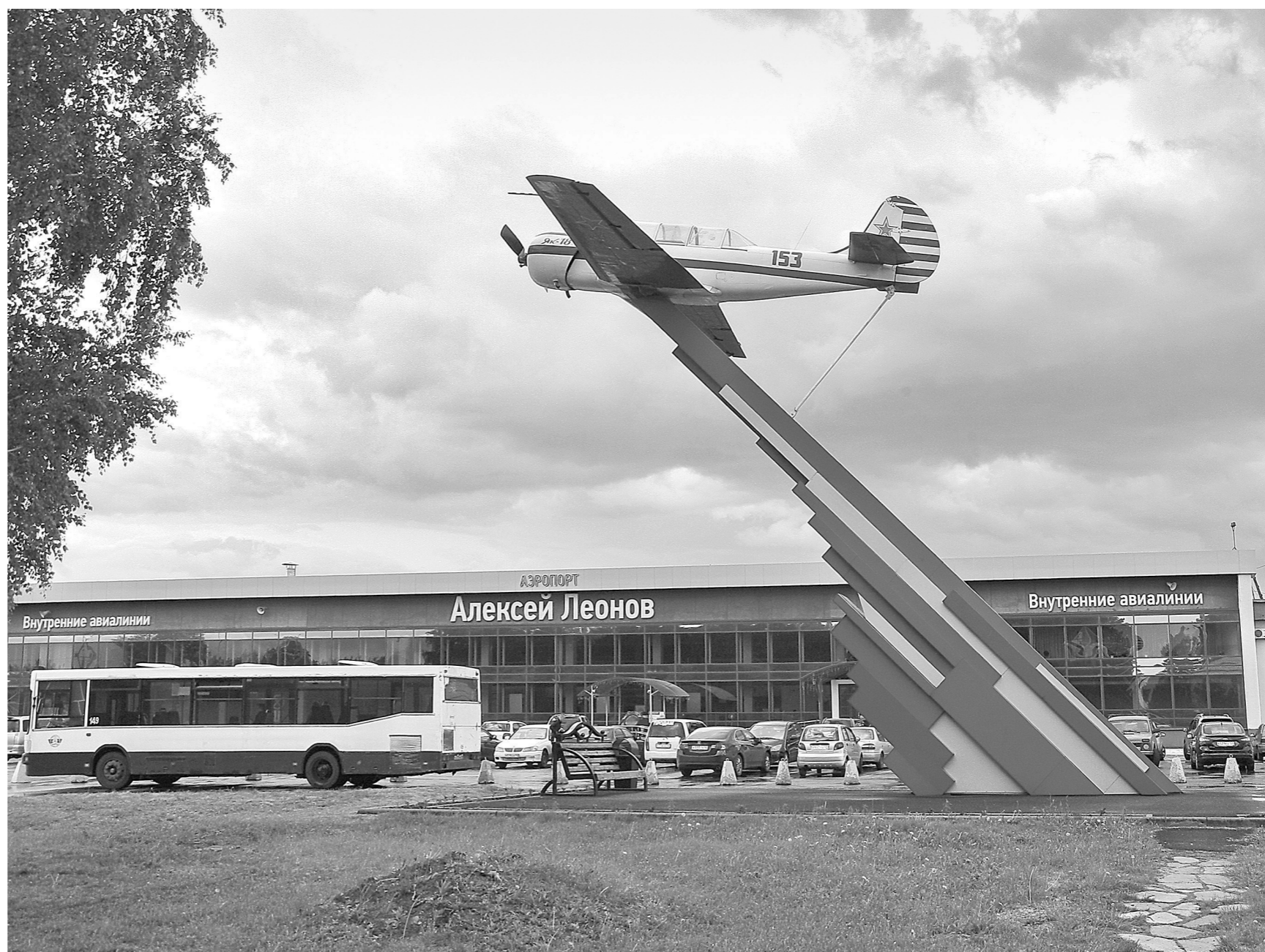
У аэропорта им. А. Леонова помпезные космические перспективы, во всяком случае, в его большом будущем уверены новые собственники.

На прошлой неделе, с 1 июня, начались субсидированные авиаперевозки в Симферополь