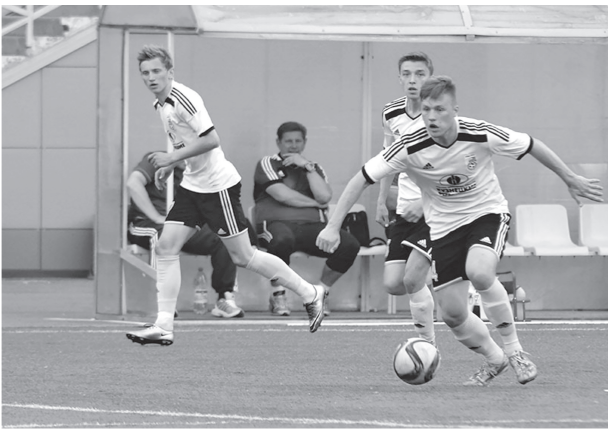
Команда «Новокузнецк» в минувшем туре первенства России среди любителей (зона «Сибирь») обыграла в Бийске местный клуб (1:0) и, набрав 13 очков в шести матчах, занимает четвертое место в таблице.

Первенство России в зоне «Восток» второго дивизиона продолжалось свыше десяти месяцев (шесть из них — перерыв) и впервые завершилось победой «Смены» из Комсомольска-на-Амуре. Клуб «Новокузнецк», сыграв в июле-октябре прошлого года 16 матчей, в начале 2016-го из-за финансовых проблем отказался от участия в соревнованиях и выбыл из Профессиональной футбольной лиги.