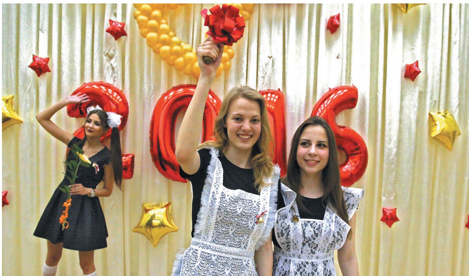
■ 2016-й учебный остался позади.