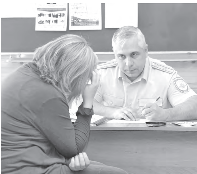
■ Допрос подозреваемой в воровстве.

Ведущий «Правового поля» Дмитрий Толковцев.