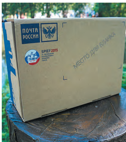
Вот так выглядит посылочная коробка нового дизайна.

общает, что упаковочный материал (в частности, гофрокоробы) закуплен, он поступит в филиал в ближайшее время. Уже сейчас в отделения почтовой связи Кузбасса поступили пластиковые пакеты, которые можно использовать для пересылки бандеролей и посылок подходящего размера и веса.