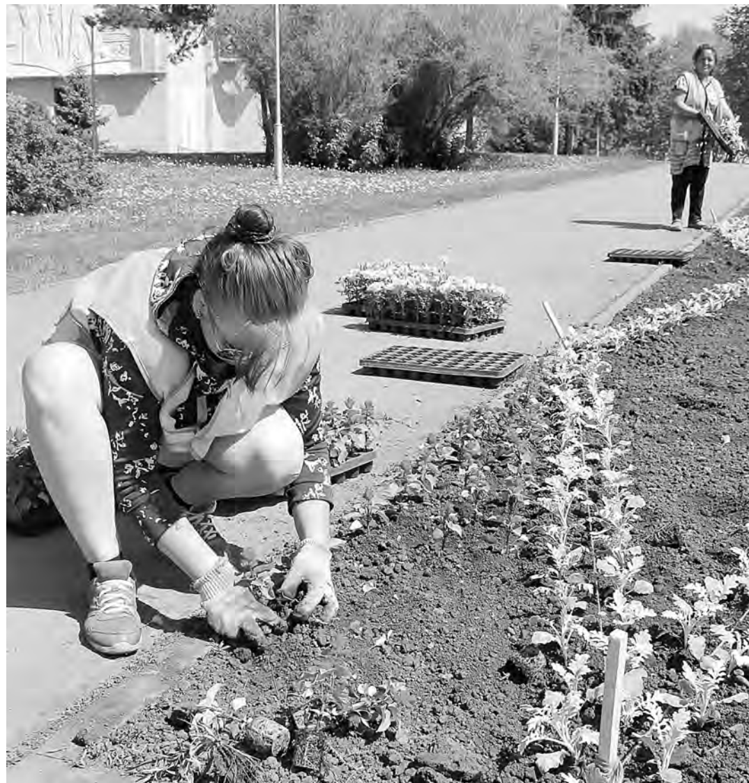
■ ЦВЕТОЧНЫЙ БУМ. С наступлением теплых дней зеленостроевцы активно начали высаживать цветочную рассаду на городских клумбах Кемерова. На вчерашний день посажена уже 31 тысяча корней петунии, бархатцев, сальвии, цинерарии. Ну а в целом в городе будет высажен миллион цветов.