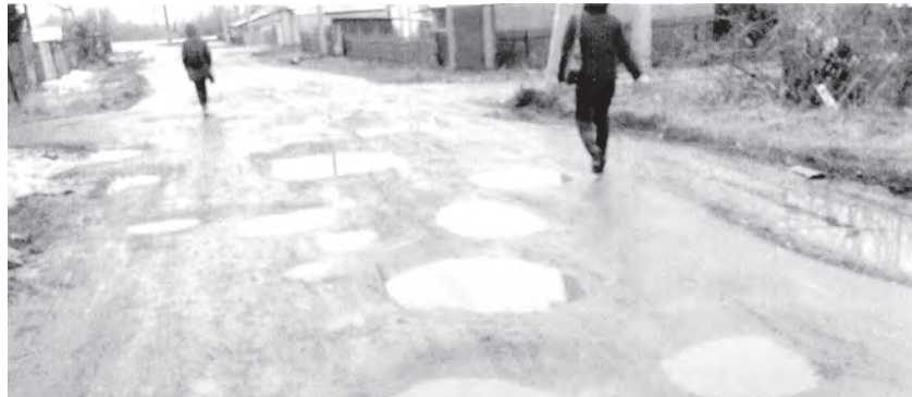
■ Жители Линейной устали преодолевать «полосу препятствий».

2) проезд от ул. 1-й Иланской до ул. 3-й Иланской с заменой трубы;