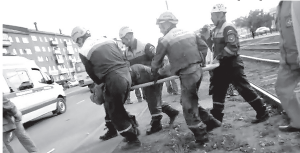
В Кемерове попавший под трамвай мужчина был госпитализирован.

Сразу несколько ДТП с участием кузбасского общественного транспорта произошло в минувшие выходные.