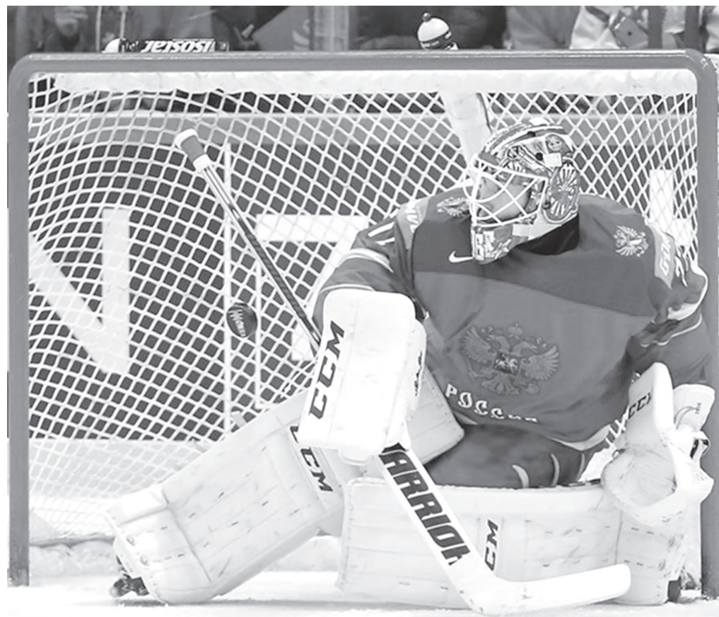
В девяти матчах сборной России на чемпионате мира Сергей Бобровский сделал 218 «спасений», парировав более 93% бросков.

1. Канада, 2. Финляндия, 3. Россия, 4. США, 5. Чехия, 6. Швеция, 7. Германия, 8. Дания, 9. Словакия, 10. Норвегия, 11. Швейцария, 12. Белоруссия, 13. Латвия, 14. Франция, 15. Венгрия, 16. Казахстан.