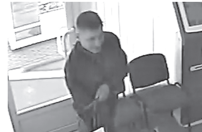
Камера видеонаблюдения, установленная в офисе микрофинансовой организации, запечатлела внешность злоумышленника. Сейчас эти кадры приобщены к материалам уголовного дела и должны помочь найти преступника, которому грозит до 10 лет лишения свободы.

После продолжительной болезни на 76-м году жизни скончался бывший председатель Осинковского городского суда Кемеровской области