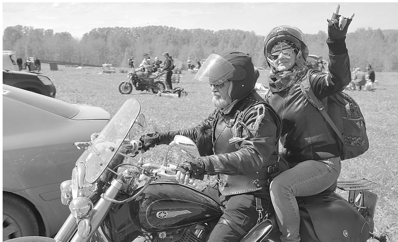
БАЙКЕРЫ ОТКРЫЛИ СЕЗОН. Около двухсот мотоциклистов и сотни зрителей собрались в выходные близ Новокузнецка на открытие сезона. Организаторы байк-шоу постарались учесть интересы всех представителей сообщества. В числе мероприятий был кросс по пересеченной местности, шуточные состязания «Медленная езда», «Начай колесо» и конкурс на самую интересную татуировку. В отдельной категории состязались самодельные машины. И впервые в шоу приняли участие ретромотоциклы: от легендарного английского «Триумфа» 1935 года выпуска до советского «М-72» военной комплектации - с минометом!