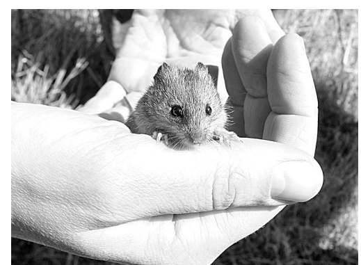
Еще один краснокнижный вид: мышевка степная. Она тоже теперь будет жить на новом месте, рядом с солодкой.

Юрий Манаков полагает, что мероприятия по сохранению биоразнообразия не такие уж и дорогостоящие, и их вполне можно уложить в разумные сроки: «Кузбасс сейчас является экспериментальной площадкой ПРООНовского проекта по части разработки новых инновационных методов сохранения биоразнообразия для угольной промышленности. Мы на шаге примера покажем, что это вполне реали-