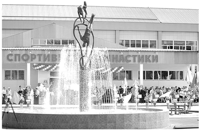
Знаменитый манеж в Ленинске-Кузнецком.

9 мая 1945. Чехия. 68-й стрелковый корпус в составе 46-й армии 2-го Украинского фронта расположился по восточному берегу Влтавы со штабом в Ческе-Будевнице. На другом берегу встал лагерь 12-й армейский корпус 3-й армии США.