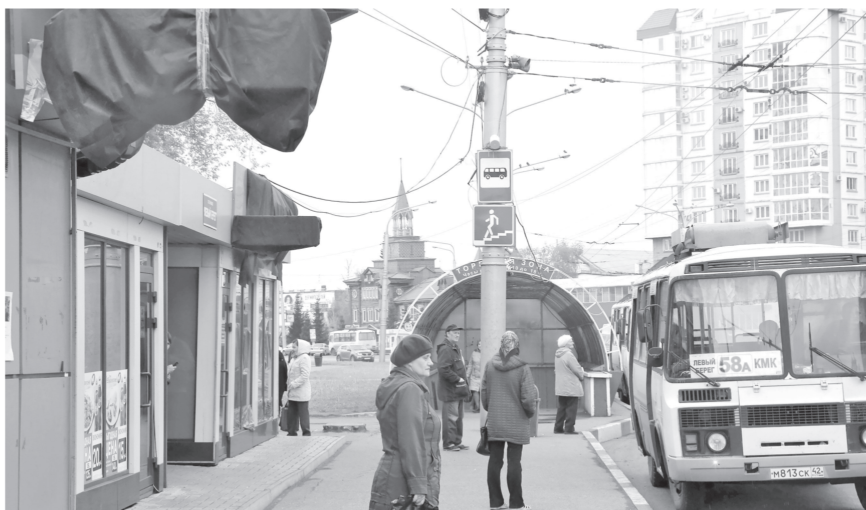
В Новокузнецке у арендаторов-МФО есть месяц на то, чтобы выехать из киосков. Некоторые уже демонтировали свои вывески или закрыли их тнью.

В Кузбассе проблему закредитованности населения пытаются решить в том числе и за счёт регулирования рынка микрофинансирования. Незаконнополучившим участникам приходится покинуть свои точки