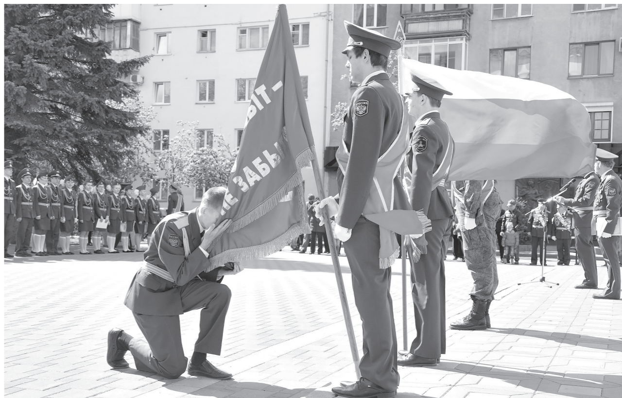
ЧЕСТЬ ПО ЧЕСТИ. Вчера в Кемерово, на аллее Героев, прошла торжественная церемония прощания юнармейцев-выпускников со Знаменем Поста №1. Всего в этом мероприятии, а проводится оно в течение двух дней, принимают участие 80 лучших выпускников из 21-й школы. Все они на протяжении нескольких лет несли Всероссийскую Вахту Памяти и Вечного огня и Обелиска Славы. Вчера же их родители были награждены за достойное воспитание детей. На церемонии также были приглашены ветераны Великой Отечественной войны, военной службы.