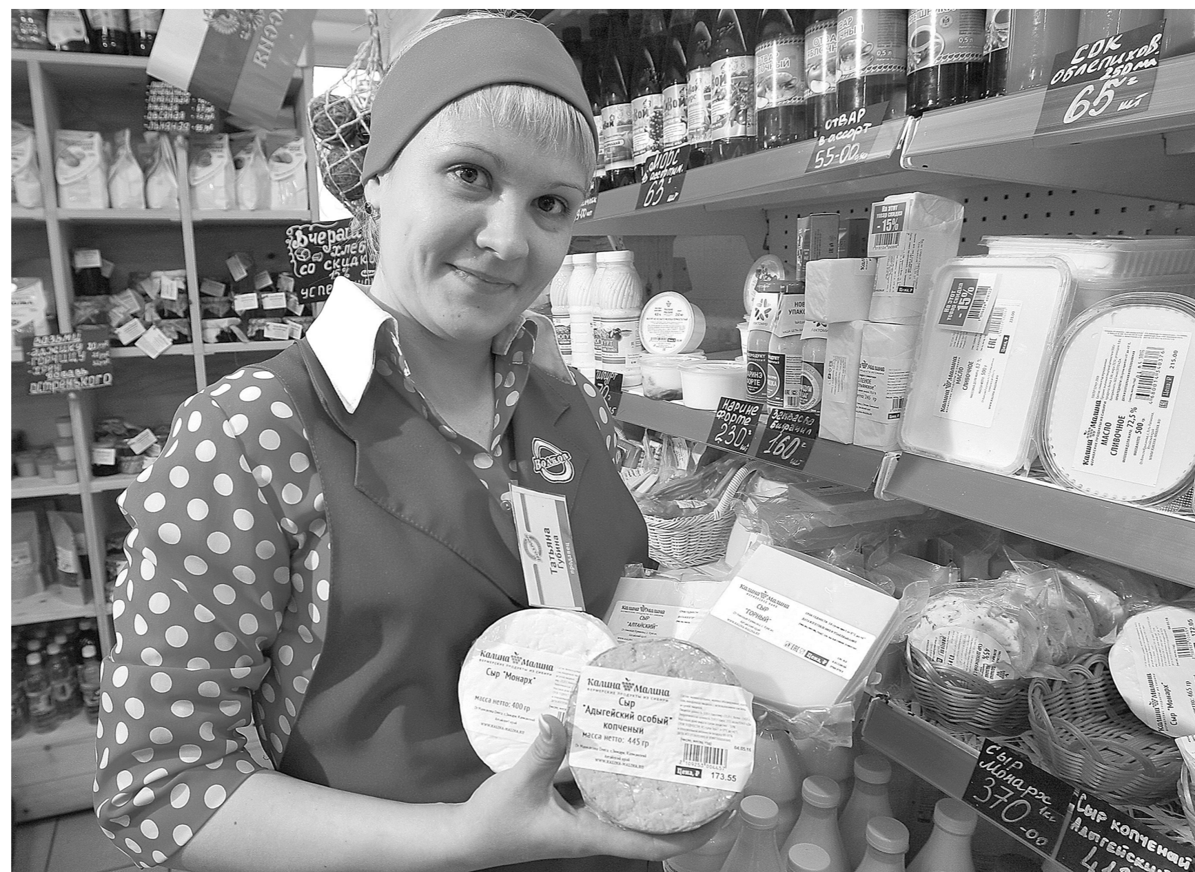
Такие мягкие фермерские сыры вкусны, но погоды на сыром рынке не делают.

Сырная тема актуализировалась в последние годы в связи с ориентирами на самообеспечение, импортозамещение и из-за проблемы фальсификации молочной продукции. Так, по исследованиям Россельхознадзора (конец прошлого года), доля фальсификата на рынке сыров достигает 78,3 процента. Минсельхоз, правда, предлагает свою цифру: 10-15 процентов. Кузбассу, если плясать от медицинских показателей — шесть кило сыра на человека в год, — нужно 17 тысяч тонн этого продукта. Для полноты восприятия: на изготовление такого количества ушла бы треть кузбасского молока.