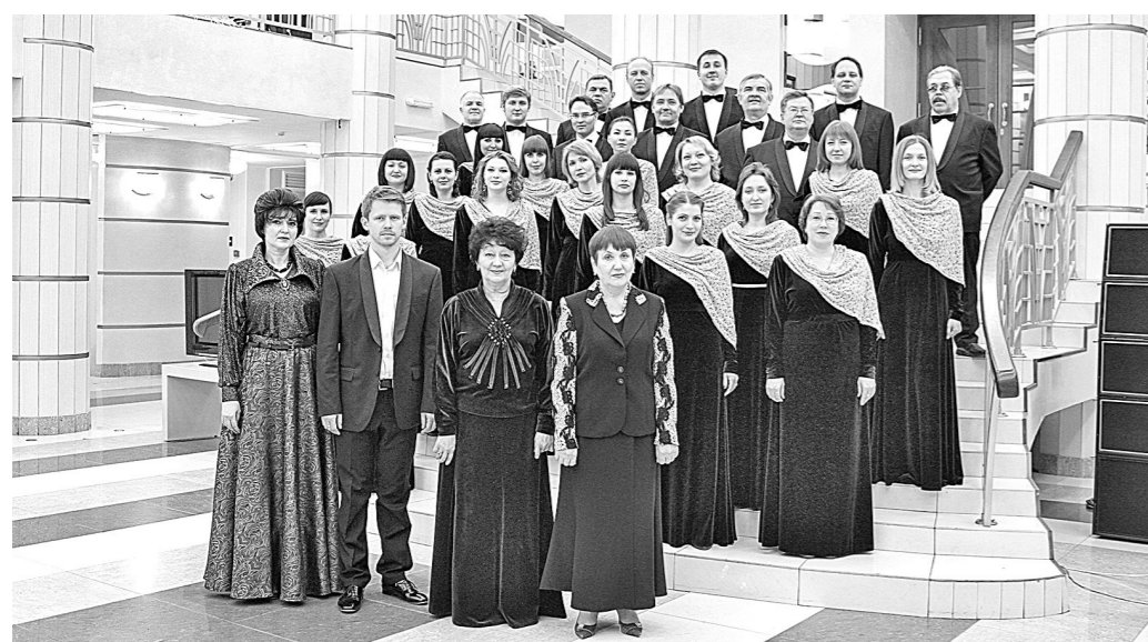
Губернаторский камерный хор к гастрольному туру по области готов!