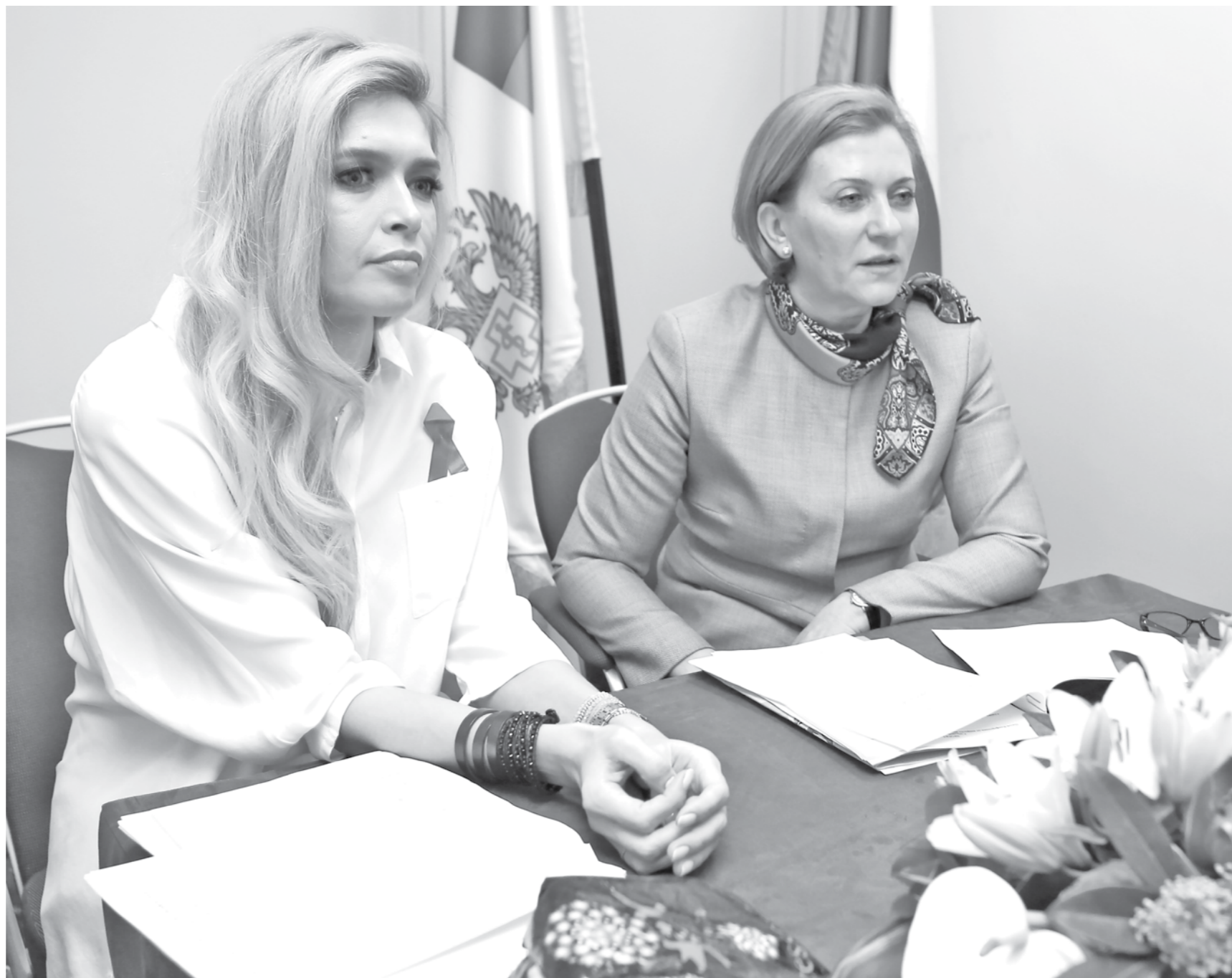
Певца и актриса Вера Брежнева, год назад ставшая послом доброй воли объединенной программы ООН по ВИЧ/СПИДу в странах Восточной Европы и Центральной Азии, и главный санитарный врач России Анна Попова на одной из встреч конференции.

Под таким лозунгом в Москве прошла V международная конференция по ВИЧ/СПИДу в Восточной Европе и Центральной Азии — крупнейший русскоязычный форум на заданную тему. В ее работе приняла участие и корреспондент нашего издания. Ведь для Кузбасса эта проблема также очень актуальна.