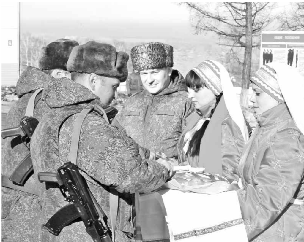
Встреча хлебом-солью командиров 106-й бригады МТО, вернувшихся из расположения российской группировки войск в Сирии.