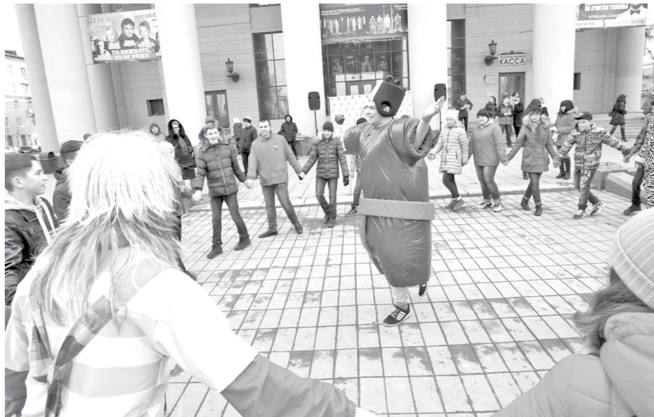
ИГРАЮТ ВСЕ! Вчера в столице Кузбасса был большой игровой день. В рамках молодежного марафона «Кемерово — территория согласия» в школах, ДК, на открытых площадках проводились игры разных народов: русские «петушиные бои» и «стенка на стенку», забавы татар и немцев, армян, китайцев и таджиков. Принять в них участие приглашались все желающие, особенно дети, у которых сейчас каникулы. Так горожане могли не только развлечься, но и познакомиться с национальным колоритом разных народных забав, что, по мнению организаторов, укрепляет межконфессиональную дружбу.