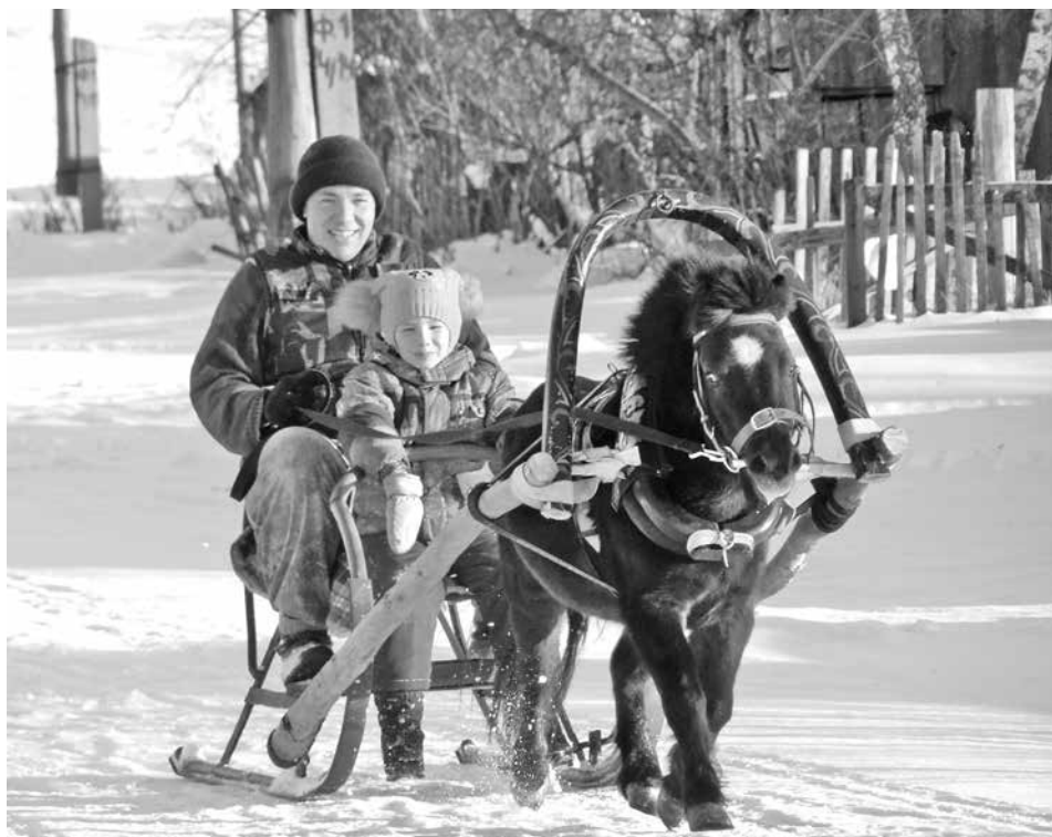
■ С Лизой из детского сада – на Хаммере.