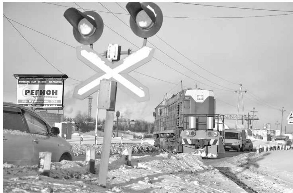
■ Фото Сергея Гавриленко.

С начала текущего года инспекторами Кемеровской госавтоинспекции к административной ответственности за нарушения правил движения через железнодорожные пути привлечено 33 автомобилиста (за аналогичный период прошлого года - 27, за весь 2015 год - 96). К