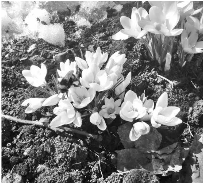
■ Цветут крокусы.

Ранние оттепели порушили снежный покров, и на прогалинах уже пробиваются ростки крокусов. Неделя-другая – и белые, желтые, сиреневые, оранжевые куртинки оживят пока еще дремлющий сад.