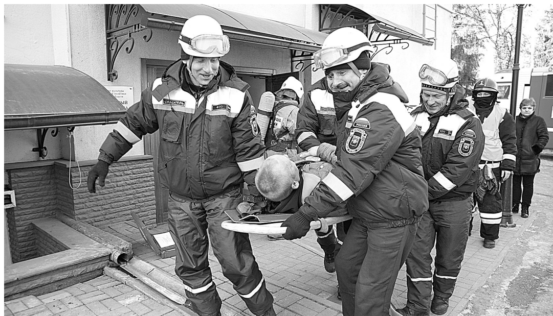
■ Фото Сергея Гавриленко.