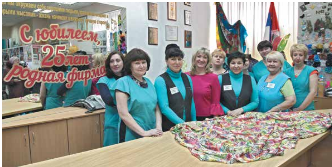
■ Шит крепкими нитками: коллектив с 25-летним стажем.