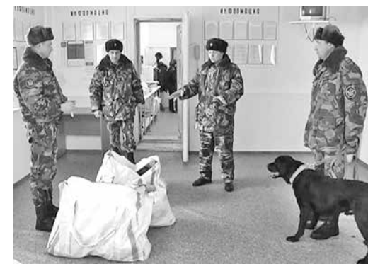
■ Все, что пронесется на территорию «зоны», обязательно подлежит тщательному досмотру.