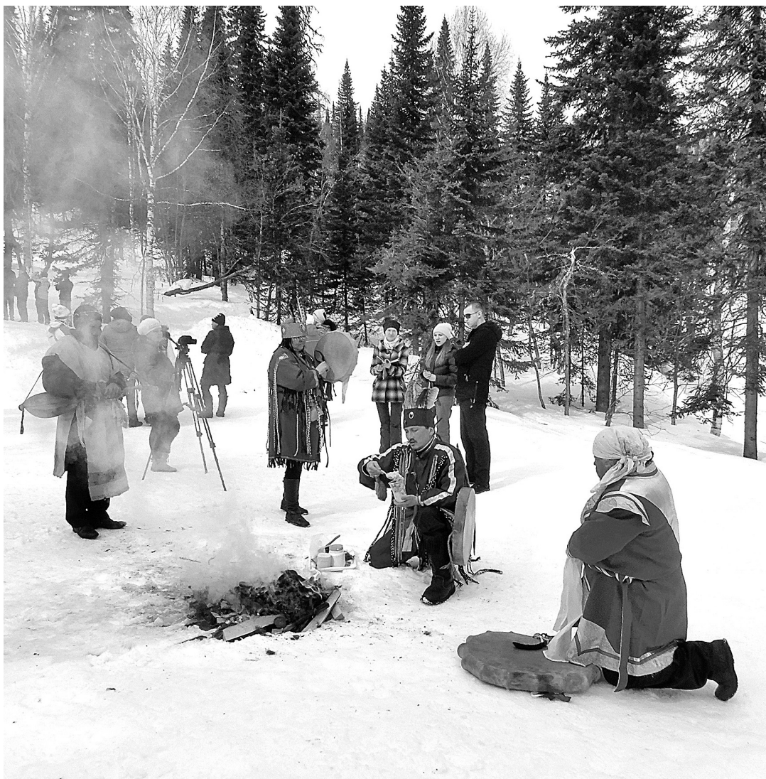
■ Шаман проводит обряд кормления огня у подножия горы Мустаг.