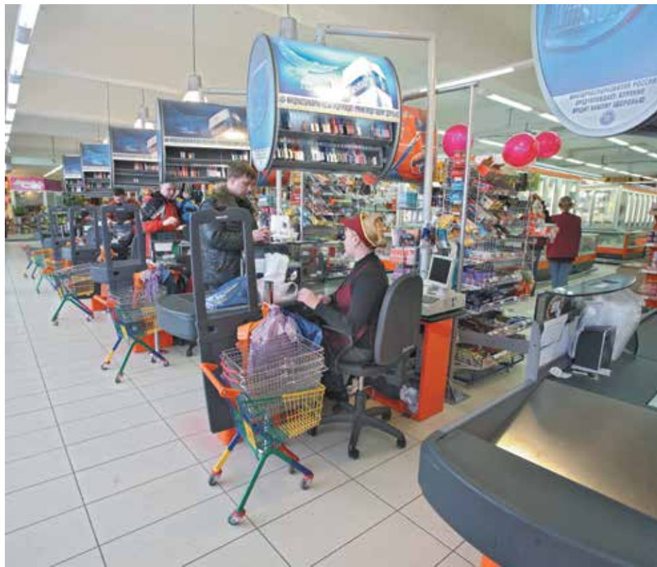
■ Потребители стали считать деньги уже на подходе к кассе.

Специалисты отдела за прошлый год составили 1700 претензий и подготовили 266 исковых заявлений