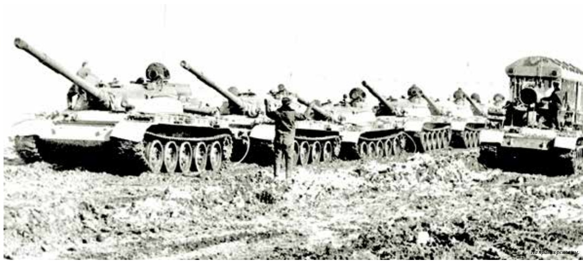
■ Уникальный эксперимент по доставке многотонного трансформатора на Юргинский машзавод.