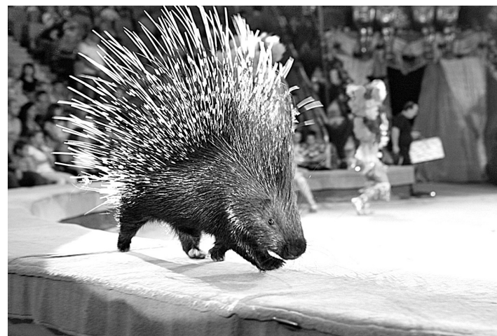
■ «Экзотик-шоу» в кемеровском цирке.