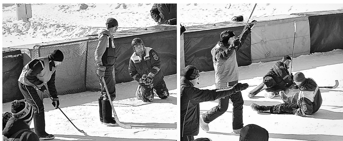
Моменты финального матча.