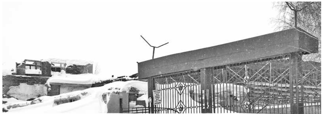
Это всё, что осталось от завода «Кедр»...