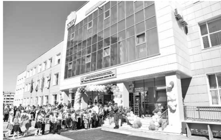
В кемеровской школе на Южном построен спортблок с 25-метровым бассейном.

В областном департаменте строительства нам пояснили, что такое модульный принцип, что такое модульный принцип. В ответе за подписью заместителя начальника И.В. Ниткиной говорится, что «современная школа должна проектироваться и