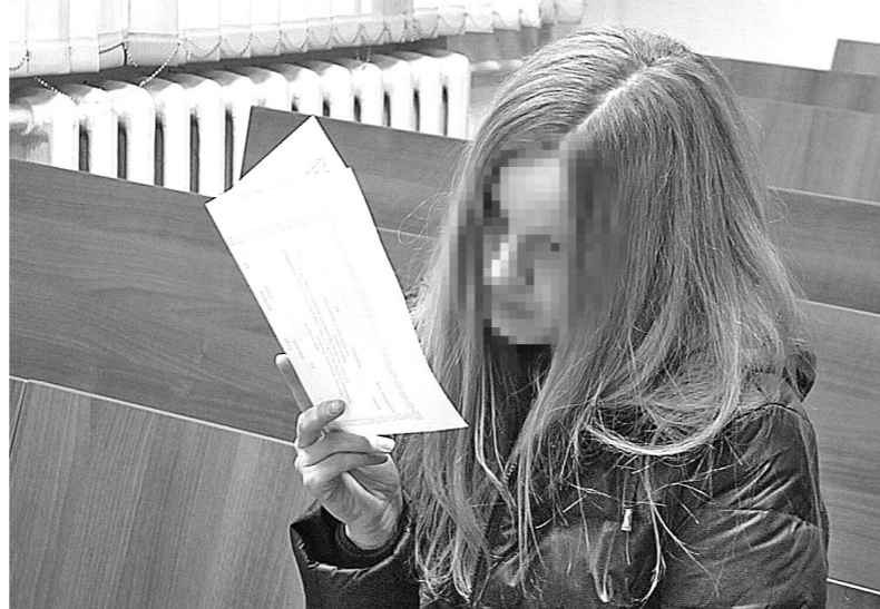
На суде уже бывшая сотрудница банка признала свою вину полностью.

переоформила ее на меня, сказав, словно чувствовала, словно видела все наперед: «Мам, жизнь непредсказуема... Мало ли что...» Да, жизнь действительно непредсказуема. Их нет, а я всё живу... После похорон внучка продала квартиру