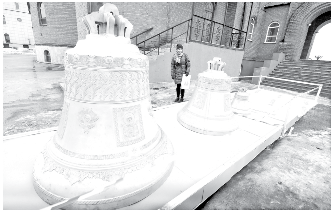
ОБНОВЛЕНИЕ ГОЛОСА. Девять колоколов, отлитых из специальной бронзы в городе Каменск-Уральский, доставили в Знаменский собор в Кемерове. Вес самого большого из них составляет 2,5 тонны, самого маленького – 6 килограммов. Заменить старые колокола собор планируют уже к нынешней Пасхе, чтобы в самый главный православный праздник обновленная звонница по-новому заговорила в полный голос. Самые маленькие колокола пока перенесли в помещенье, ну, а большие находятся на территории собора, и увидеть их может любой прихожанин.