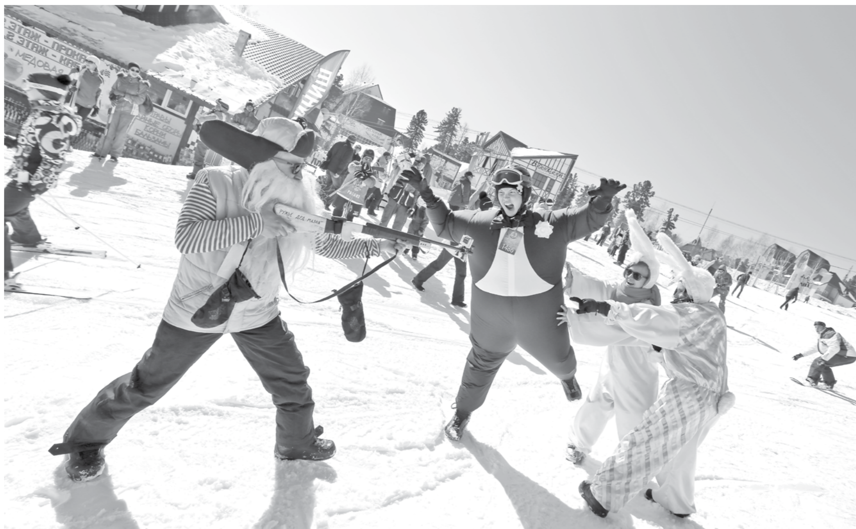
В прошлом апреле спуск с горы Зеленой в карнавальных костюмах получился не только массовым, но и очень веселым.

Основной тренд нынешнего туристического сезона – внутренние направления