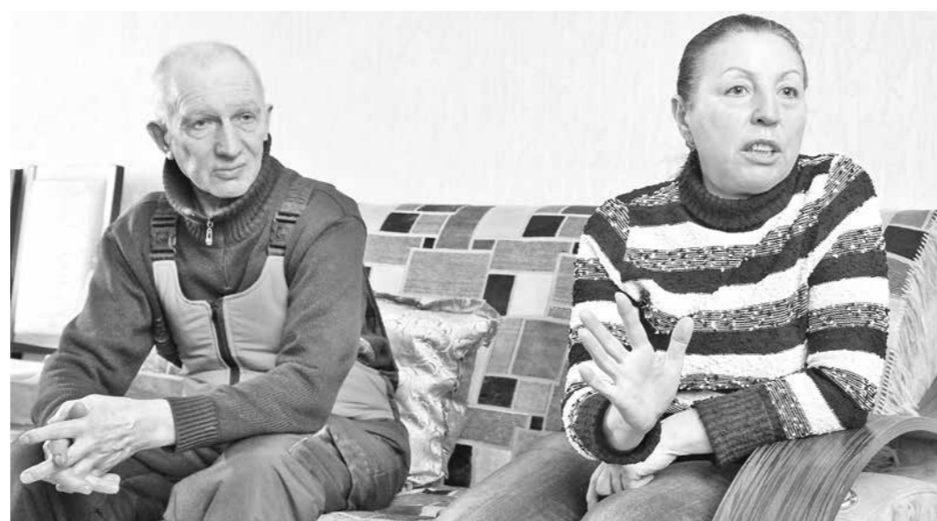
...но остались еще и люди, которым хочется и сегодня жить хорошо.