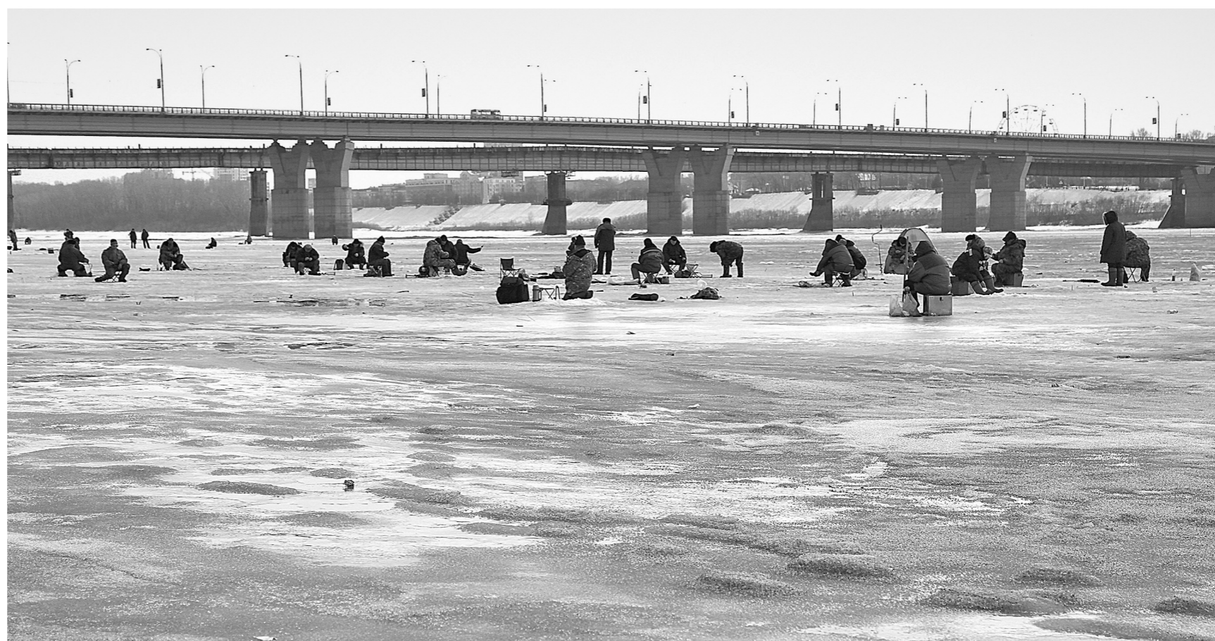
Рена Томь: последние дни перед ледоходом.

Все муниципальное имущество Кузбасса должно быть застраховано от последствий весеннего паводка до 30 марта