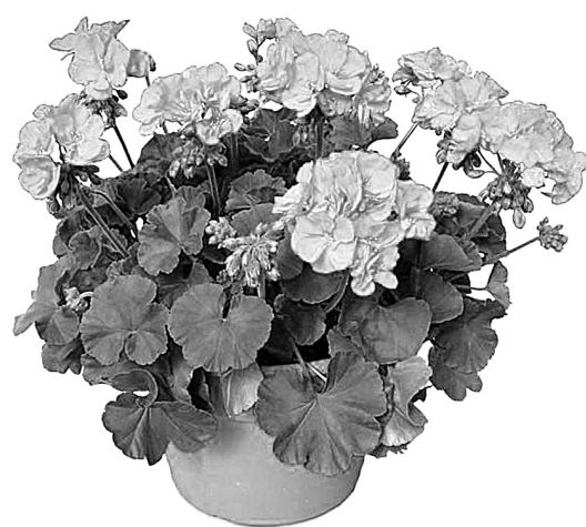
■ Герань для сада.

Цветовая гамма домашних цветов вполне может соперничать с окраской садовых растений. Ярко-красные, малиновые, белые, си-