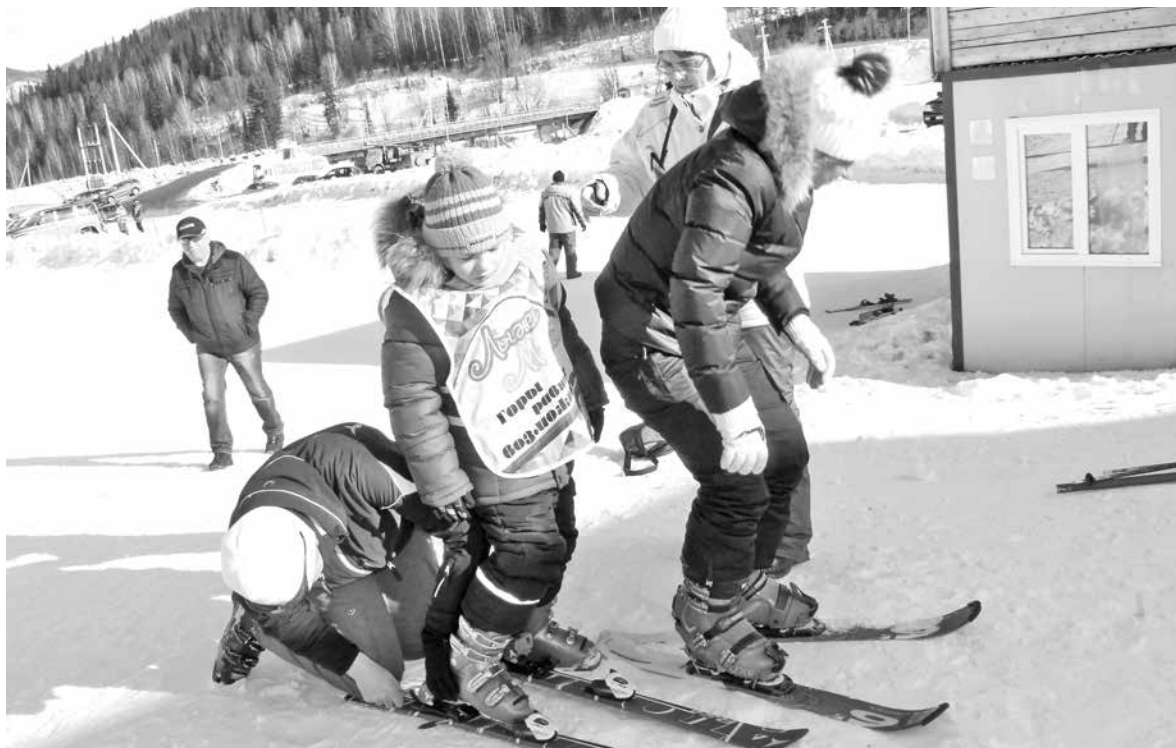
■ Участники программы «Лыжи мечты» на горе Туманной.