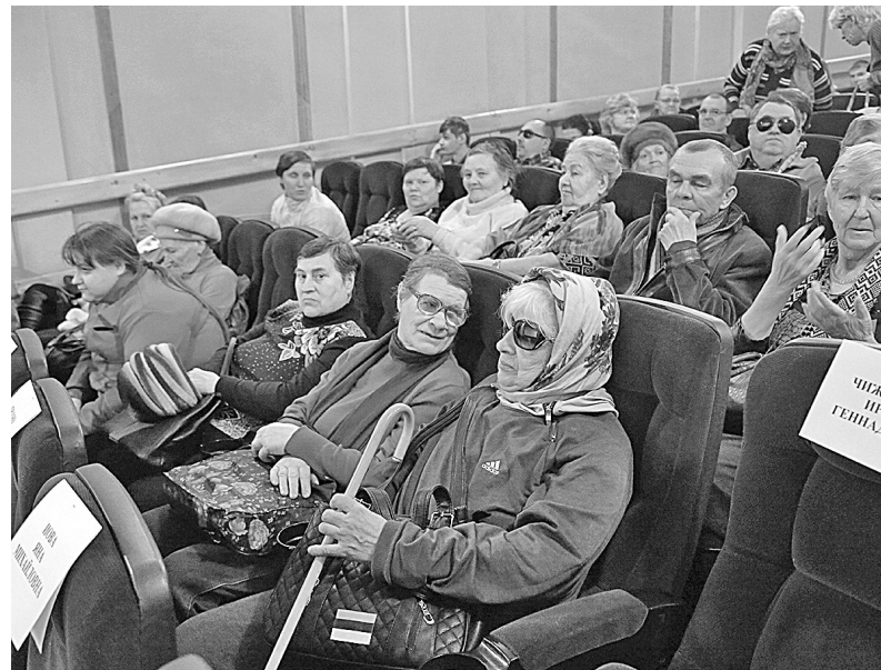
■ На сеансе фильма с тифло- и сурдопереводом.

На первый в Кузбассе кинопоказ для людей с инвалидностью пригласили и журналистов. Завязав глаза, те смогли лично его оценить. Выяснилось, что фильм с тифлопереводом напоминает аудиокнигу: «родные» диалоги, музыка, шумы в киноленте дополнены хорошо поставленным мужским голосом. Он описывает место действия, жесты, мими-