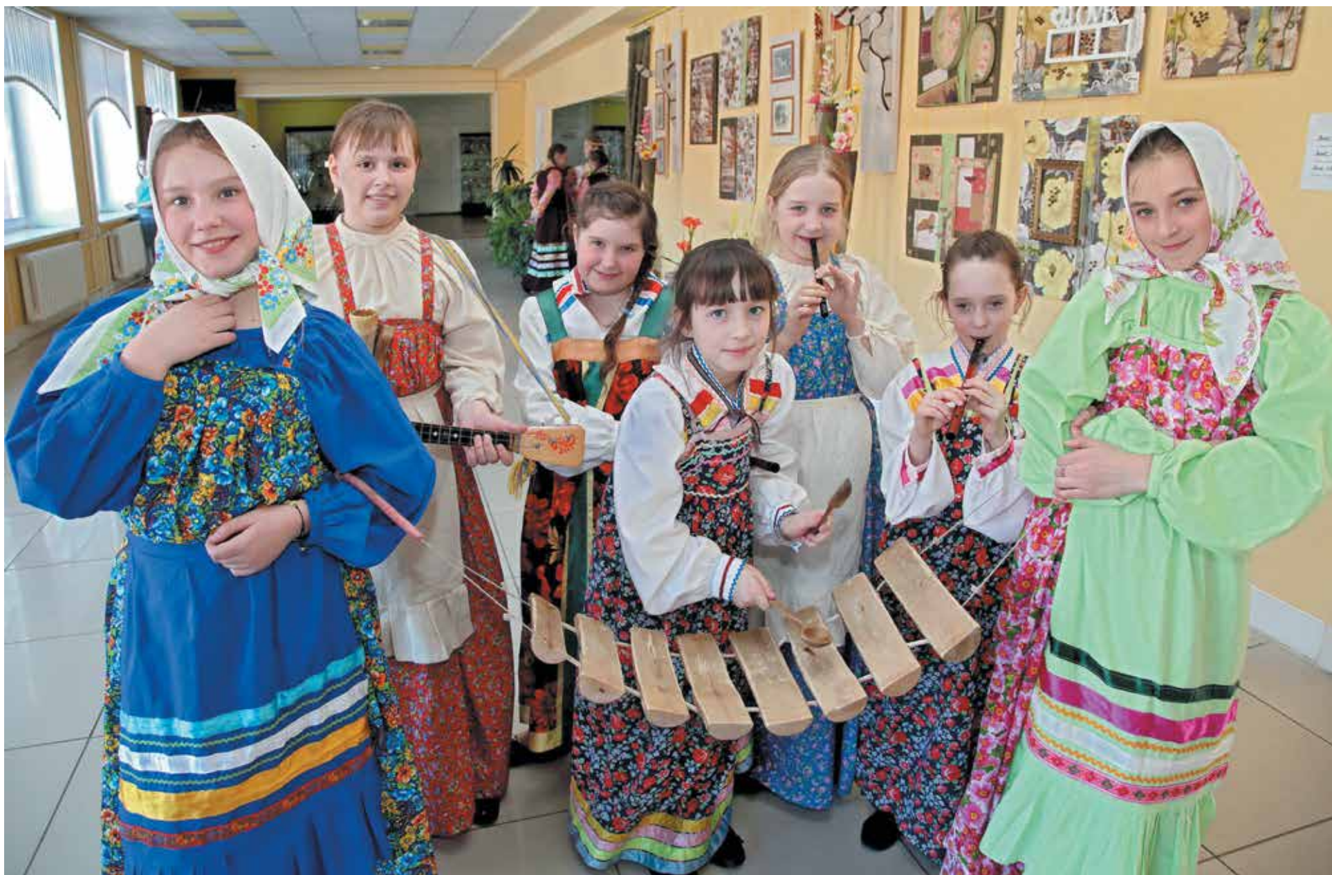
Многие выступления на конкурсе были очень яркими, как, например, у фольклорного ансамбля «Неделька» центра творчества Заводского района.