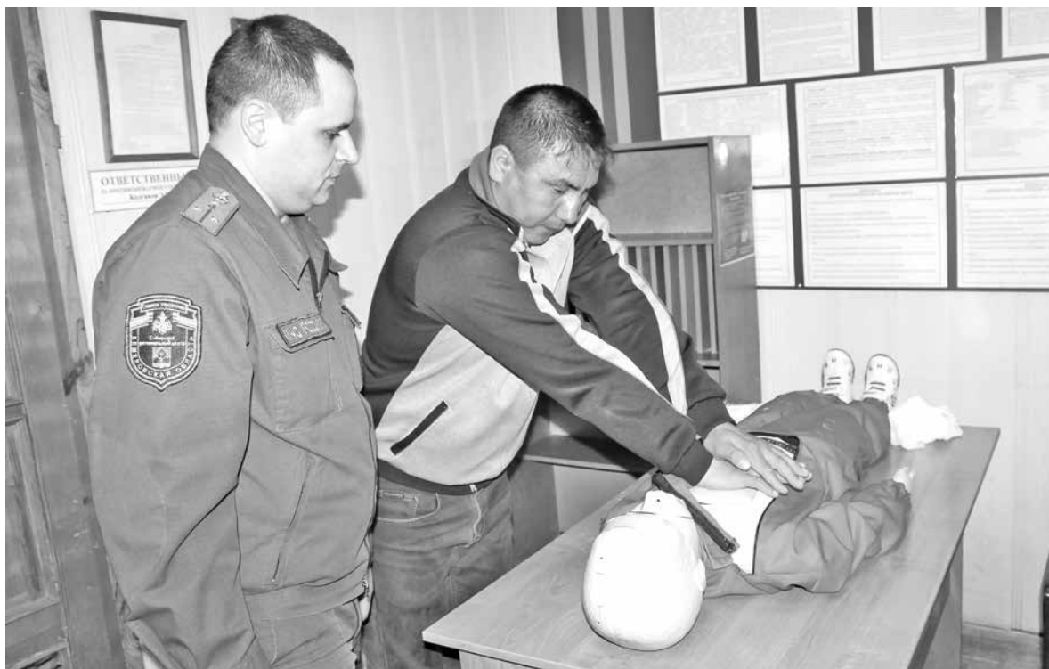
■ На встрече спасателей с жителями Ортона.