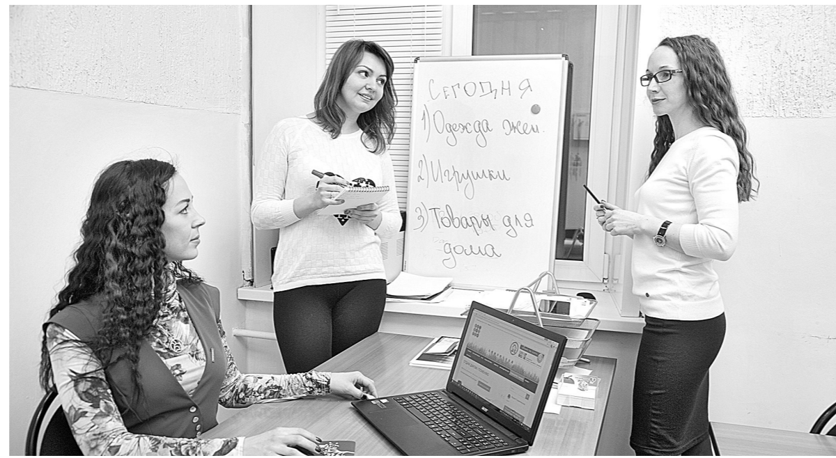
В центре помощи умеют объединить людей для благих дел.