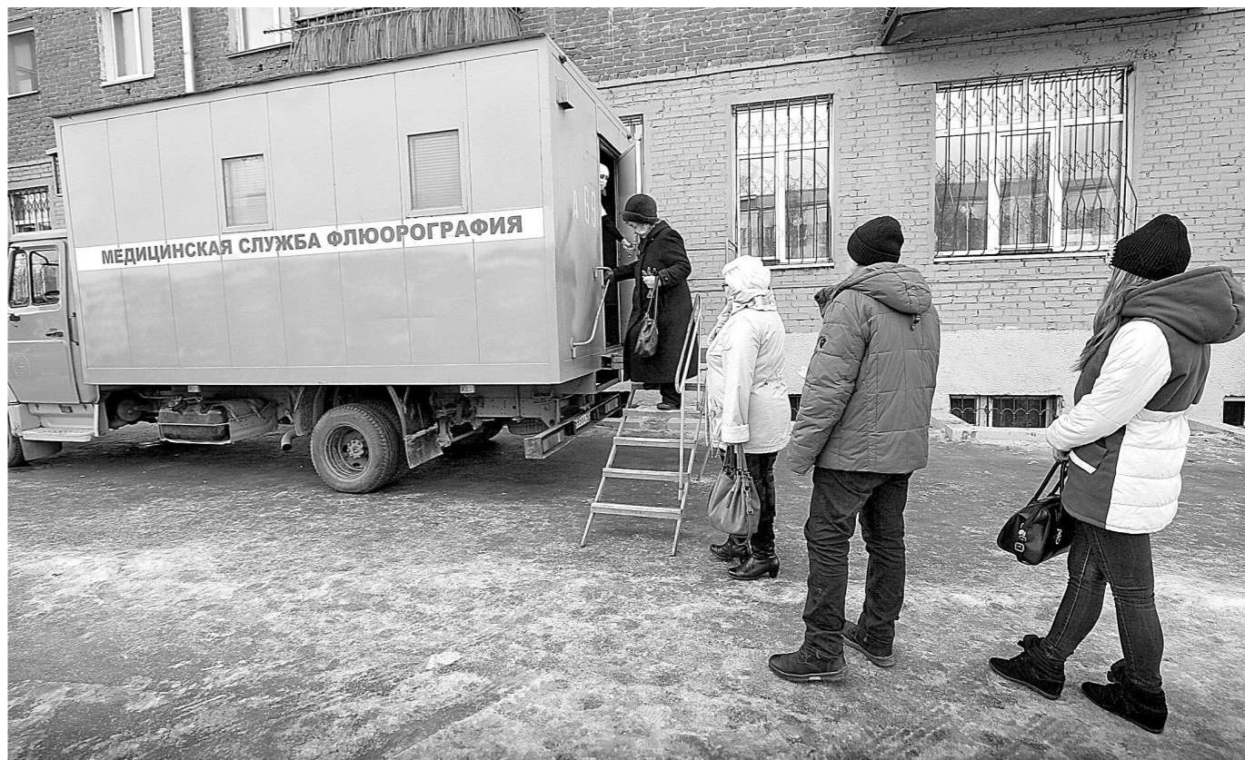
«БЕЛАЯ РОМАШКА». Так называется акция по борьбе с туберкулезом, в рамках которой в Кемерове на этой неделе работает передвижная флюорографическая установка. Горожане могут бесплатно пройти флюорографию без направления врача и страхового полиса. Установка работает с 9.00 до 14.00 по следующему графику: 14-18 марта – поликлиника ГНБ №4, 21-25 марта – поликлиника №20, 28-31 марта – поликлиника №6. Кроме того, с 14 по 24 марта без направления и страхового полиса можно пройти флюорографию в поликлиниках №5, №12, №20, ГНБ №2 и в кардиодиспансере.