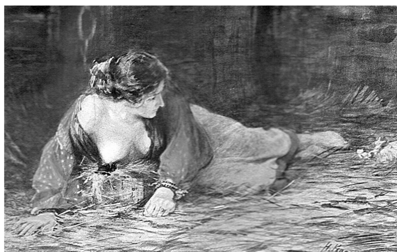
Картина известного художника Касаткина «Крепостная актриса в опале, кормящая грудью барского щенка».