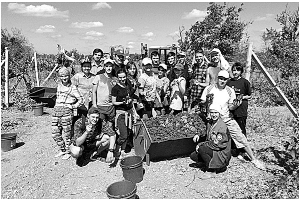
На сельскохозяйственных работах в Крыму прошлым летом трудился студотряд из КемГИППа.