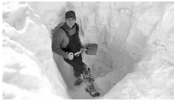
Снежный шурф на кордоне Верхняя Терсь.