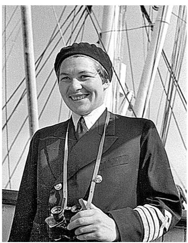
Анна Щетинина, первая в мире женщина-капитан дальнего плавания, из рода Леры.