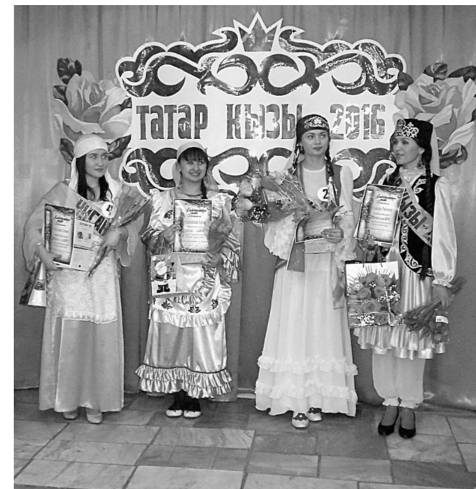
Победительницы конкурса.