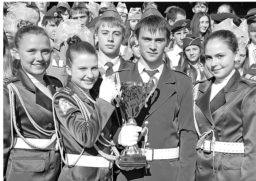
Победители одной из профильных смен юных друзей полиции, которые ежегодно проходят в оздоровительно-образовательном центре «Сибирская сказка», – члены отряда «Рыжая команда» из города Юрги.

Администрация Гурьевского муниципального района, в соответствии с требованиями пункта 4 статьи 12 Федерального закона №101-ФЗ «Об обороте земель сельскохозяйственного назначения» от 24.07.2002г., сообщает информацию о возможности приобретения земельных долей на условиях, предусмотренных данной статьёй: 9 февраля 2016г. Управлением Федеральной службы государственной регистрации, кадастра и картографии по Кемеровской области за муниципальным образованием «Гурьевский муниципальный район» зарегистрировано право собственности на земельную долю в размере 9,4 га, из земельной участка общей площадью 56839303 кв.м с кадастровым номером 42:02:000000:154, из земель сельскохозяйственного назначения – для сельскохозяйственного производства, местоположение: Кемеровская область, Гурьевский район, СПК «Салаирский», о чём в Едином государственном реестре прав на недвижимое имущество и сделок с ним 09.02.2016г. сделана запись регистрации № 42-42-002-42/121/003/2016-115/2.