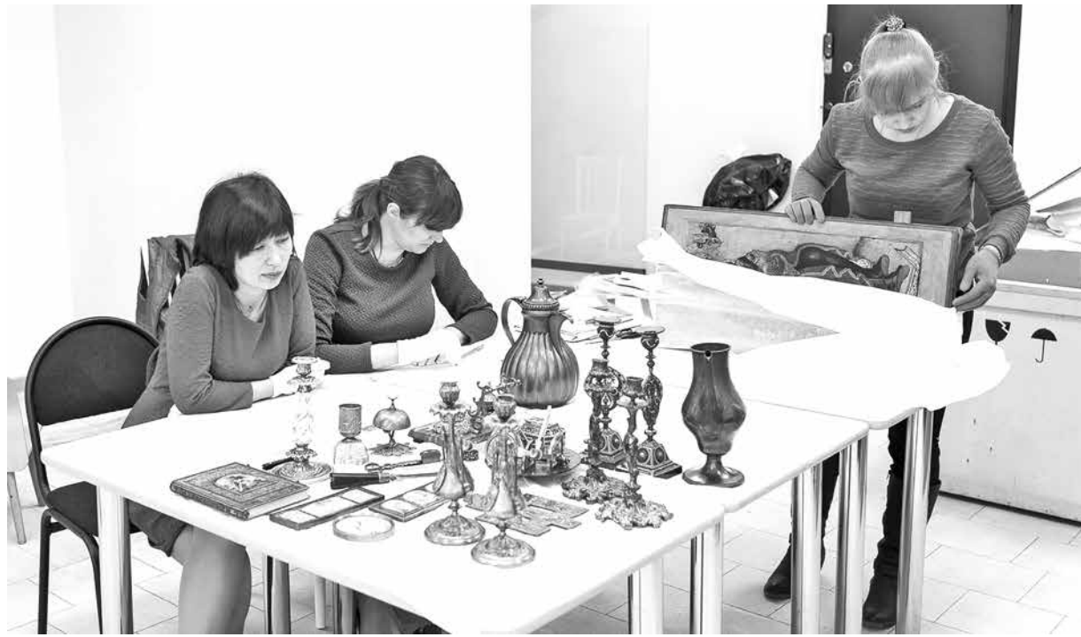
Сотрудники музея готовят экспонаты к выставке.