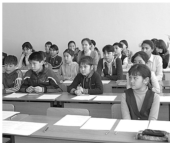
Идет конкурс переводчиков.