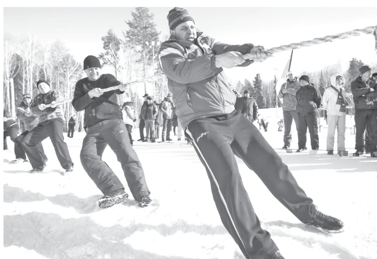
ПОСТ НАЧАЛСЯ. В воскресенье в кузбасских городах и селах прошли проводы Масленицы. Вот и на курорте «Танай» в Промышленном районе игры, конкурсы, танцами и ярмаркой угощений отметили этот праздник. А уже с понедельника у православных начался самый строгий Великий пост, по завершении которого будет отмечаться Пасха. Напомним, в нынешнем году она приходится на 1 мая.