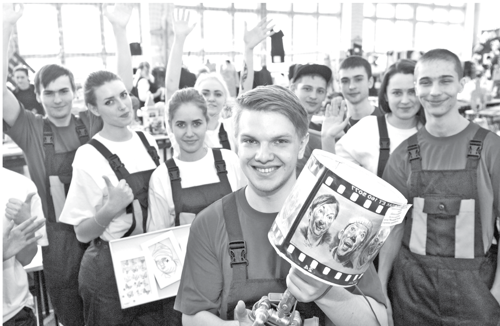
Кемеровский коммунально-строительный техникум им. В. И. Заузелкова в рамках номинации «Сто идей для кино» представил настольную лампу из водопроводных кранов.

Среднее профессиональное образование стремится к высшему – это показал всекузбасский студенческий фестиваль «Арт-Профи Форум»