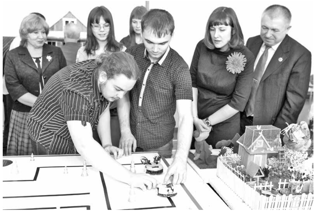
Роботы Миша и Маша на старте.