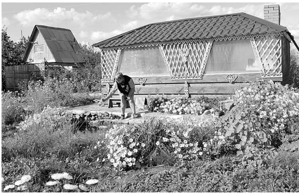
■ Фото автора.