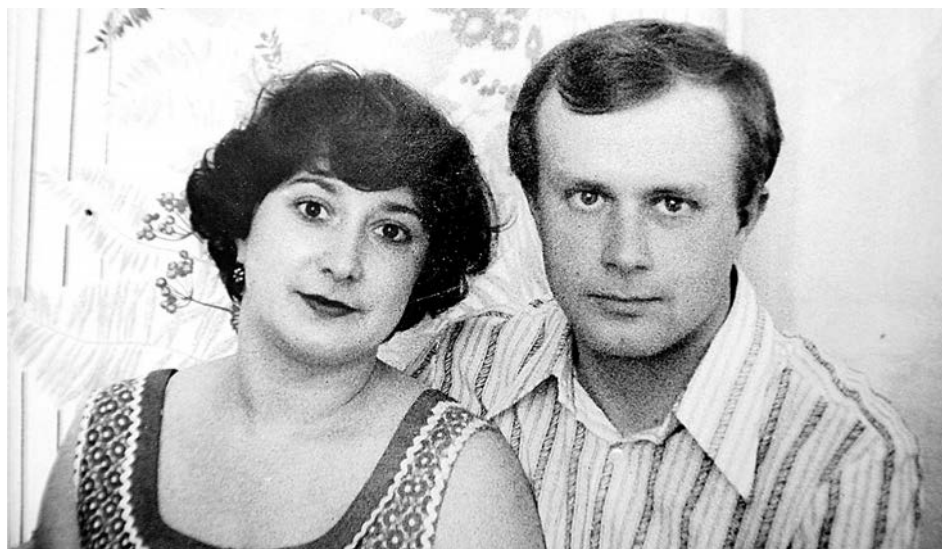
■ Восемь счастливых лет длился их медовый месяц.