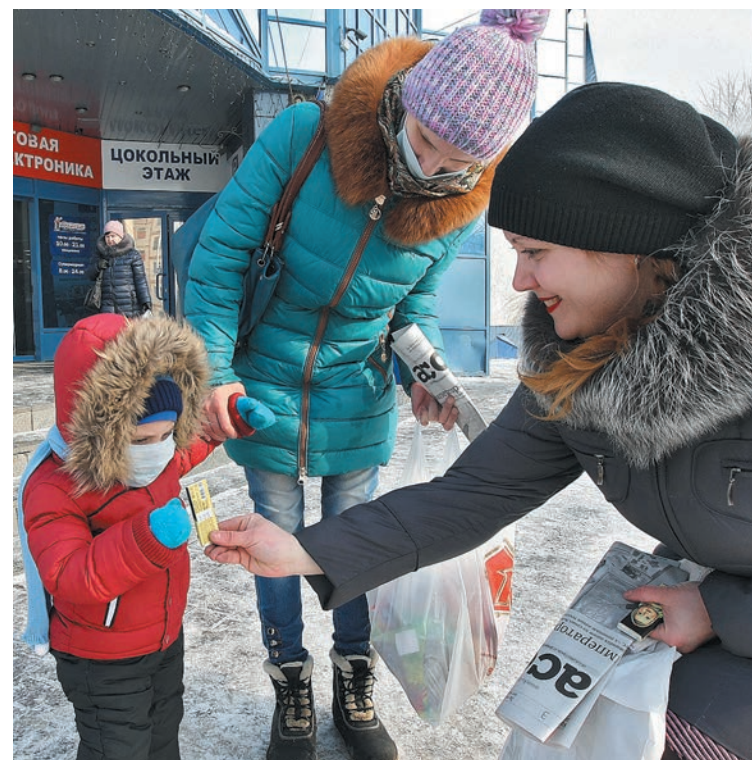
■ Улыбка и шоколадка для поднятия иммунитета.