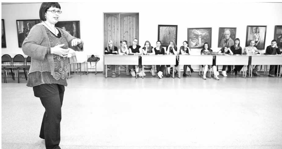
■ Кемеровских педагогов научат основам современной танцевально-двигательной терапии.