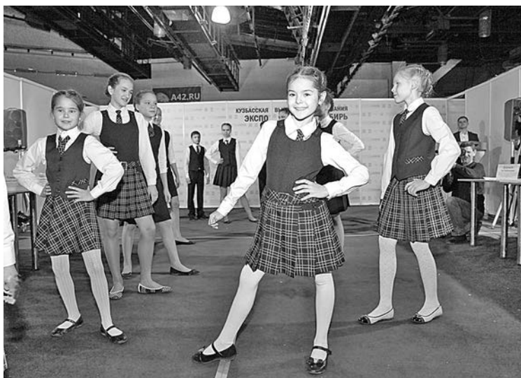
■ Единая форма может появиться в кузбасских школах уже в новом учебном году.