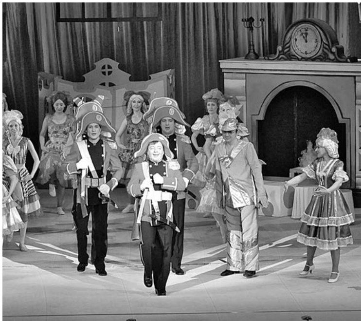
■ Спектакль «Стойкий оловянный солдатик»

21 февраля в Кемеровском театре для детей и молодежи – «Приключения Алисы в стране чудес». Начало в 13.00.