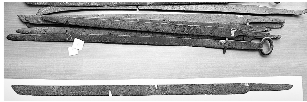
Клинки, зарытые нашими предками и найденные 17 веков спустя под Елыкаево.