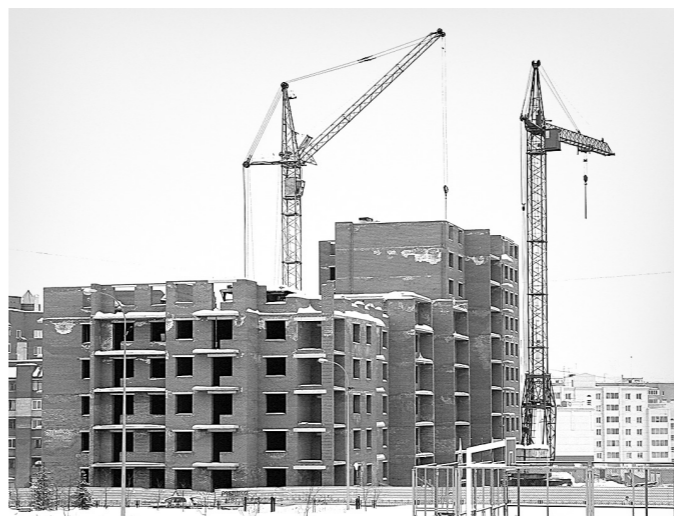
Мало построить новое жильё, нужно ещё суметь его продать...