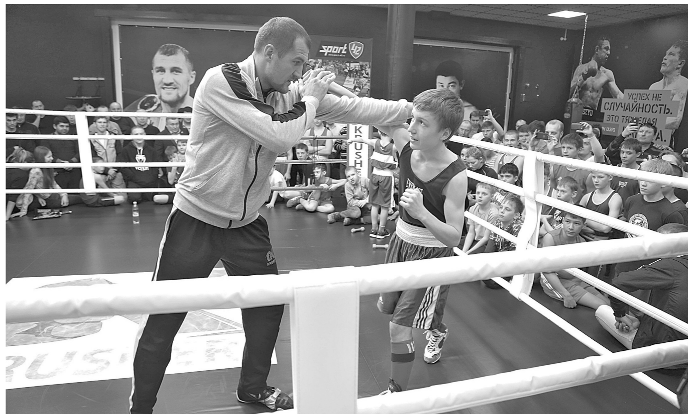
ШКОЛА КОВАЛЕВА. Знаменитый боксер Сергей Ковалев побывал в Новокузнецке. Чемпион мира в полутяжелом весе пообщался с любителями спорта и дал мастер-класс воспитанникам школы бокса «Крашер». Это первая боксерская школа Ковалёва в России. На её открытие чемпион приехал в сентябре 2015 года. И пообещал регулярно передавать опыт юным боксерам. Свое слово Ковалев сдержал: привёз в Новокузнецк чемпионские пояса сразу после победы над канадцем Жаном Паскалем. В этом бою россиянин защитил чемпионские титулы по трем версиям престижных боксерских организаций.