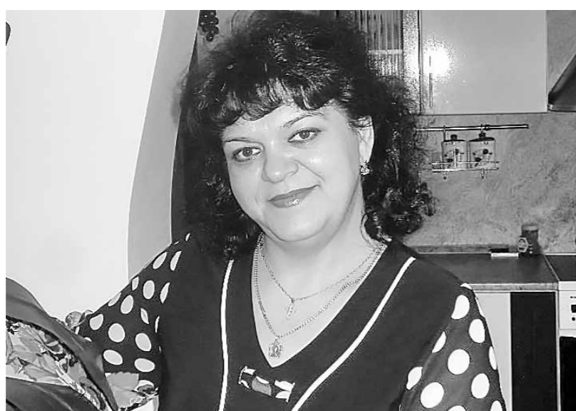
Женя-горнячка теперь считает мужа ангелом-хранителем семьи.

конечно, «Женя+Женя» оказались в эпицентре «Валентинова» дня. Только и говорили: