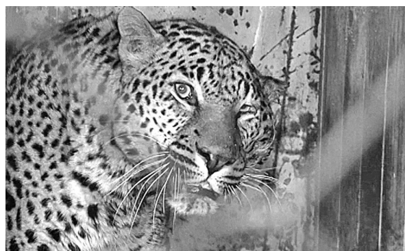
Тарзан пока находится в своем теплом вольере с подогревом.