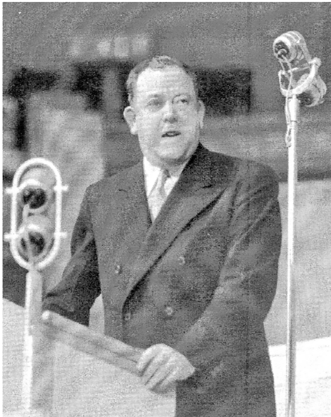
Первая речь Трюгве Ли в качестве Генерального секретаря ООН (Лондон, 2 февраля 1946 г.).

Без серьезных осложнений (кроме проблемы вывода советских войск из Ирана) завершилась лондонская часть Первой сессии. Популярно-нацифистским дискуссиям и даже решениям (полагая, что до дела не дойдет) Вашингтон и Лондон не мешали. Например, от имени Украинской ССР поэт Микола Бажан красноречиво потребовал от западных держав выдать для суда украинских националистов. Делегаты аллоцировали, но не им было решать... А одной из причин аме-