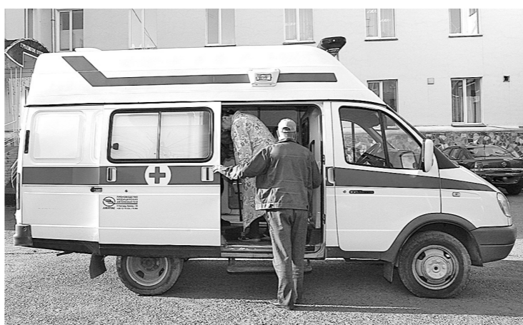
Работы на «скорой» хватят и «частникам», и «муниципалам».