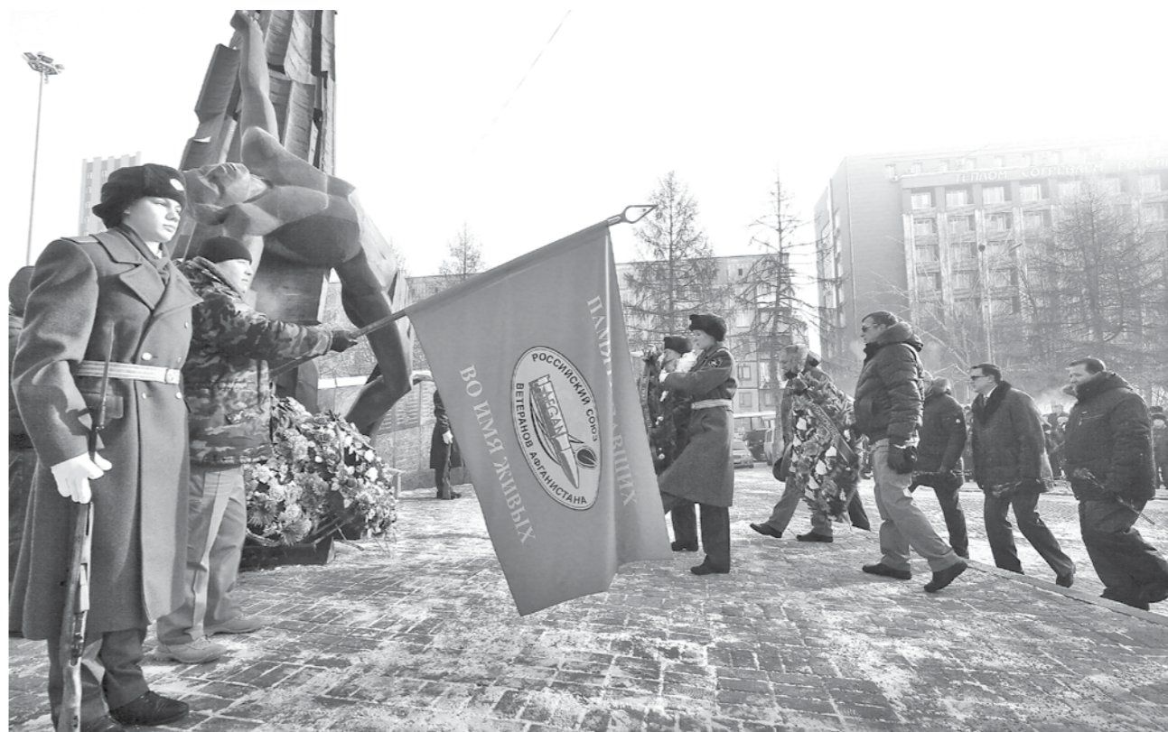
ДЕНЬ ПАМЯТИ. Вчера исполнилось 27 лет со дня окончания вывода советских войск из Афганистана. За 10 лет на афганской войне пали 134 кузбассовца, десятки наших земляков вернулись с нее ранеными или инвалидами. По традиции вчера в Кемерове к подножию Мемориала кузбассовцам, погибшим в локальных войнах и вооруженных конфликтах, несли живые цветы, и красные гвоздики на темном камне памятника были похожи на капельки застывшей крови. Потом памятные мероприятия продолжились панихидой по погибшим воинам в храме Святой Ксении Петербургской и концертом в ДК им. 50-летия Октября.