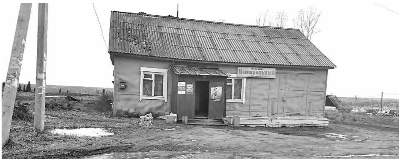
Придумать «притягательное» название – целая наука. И вот теперь ученые готовы помочь в этом хозяевам фирм и торговых точек.

Были в анкете и простые слова, такие как «абрикос». И, конечно, большинство опрошенных считает, что так можно назвать фруктово-овощной магазин или рынок.