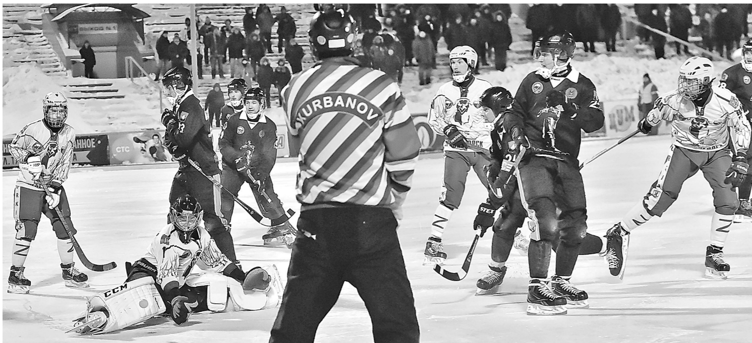
Шесть атак хоккеистов «Кузбасса» в домашнем матче с красногорским «Зорким» увенчались взятием ворот.