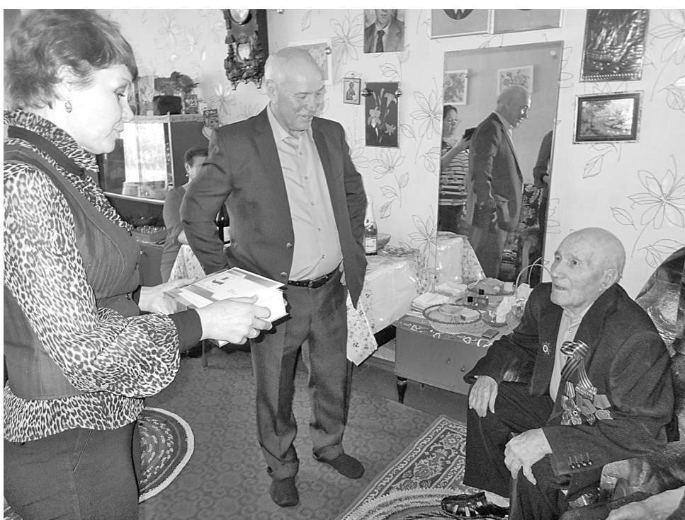
Представители местной администрации передали юбиляру поздравления от президента РФ Владимира Путина и губернатора Кемеровской области Амана Тулеева.