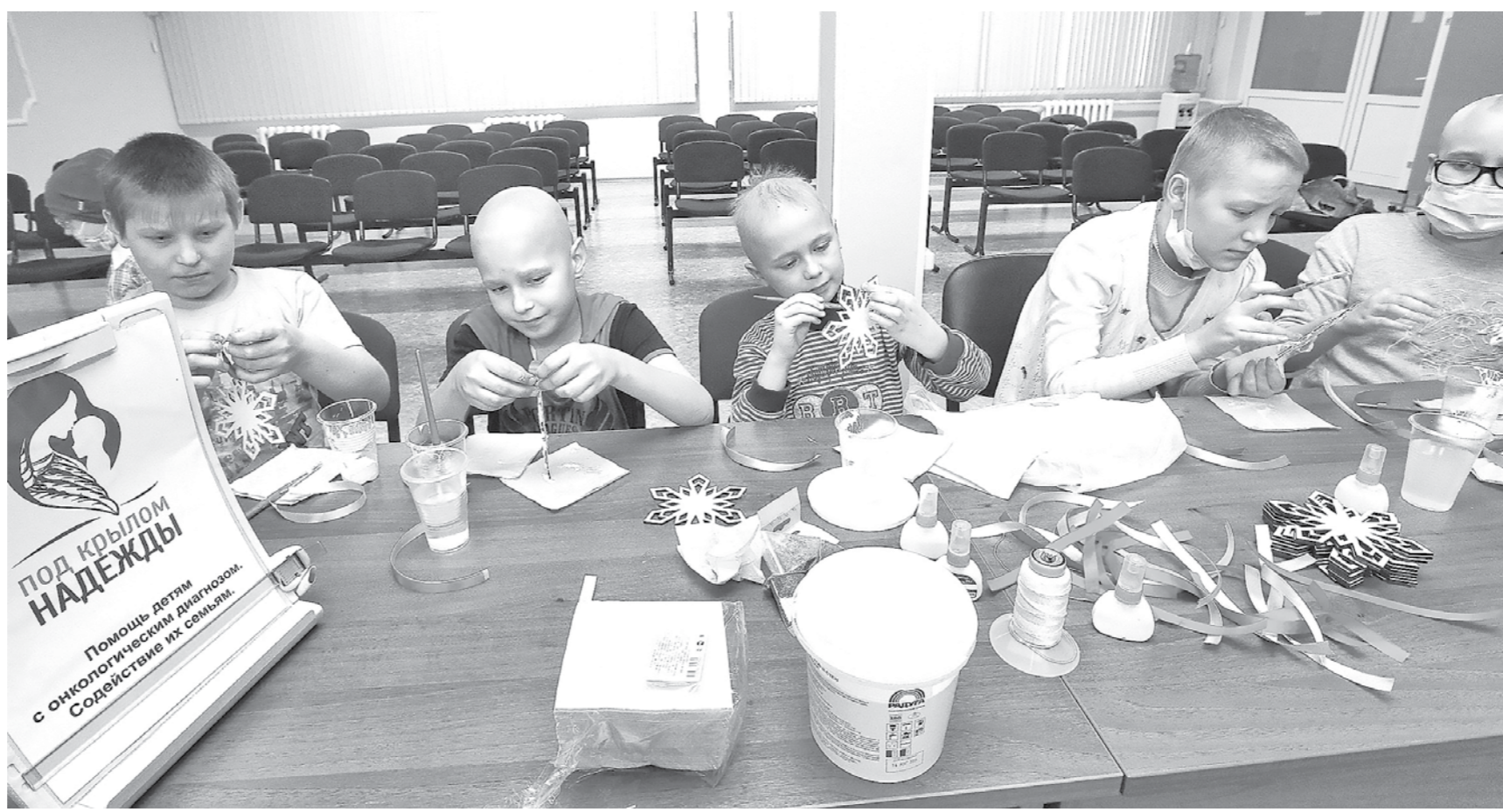
Работа над созданием надежды требует творчества и личного участия.

Вчера, 15 февраля, отмечался Всемирный день онкобольного ребенка. День надежды, а не отчаяния!