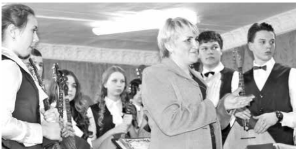
Коллектив отмечает 69-летие концертом на сцене родной школы в Мундыбаше.