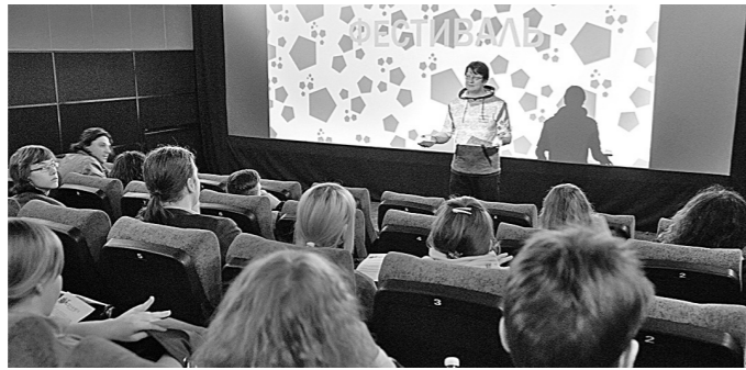
Авторское кино со всего мира покажут в Кемерове на большом экране уже в десятый раз.

X Международный фестиваль короткометражного кино «Видение» начал приём заявок.