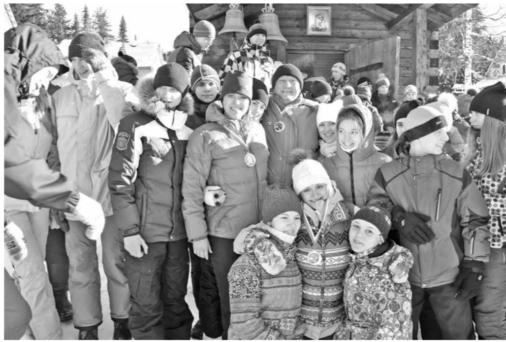
Сдавать нормы ГТО на Поднебесных Зубьях – это круто!

Серьёзное всего получили итоги минувшего года. Оказалось, что так называемый малобюджетный туризм для детей вырос настолько, что таких цифр не достигали даже в советские годы. Собственно, детский туризм здесь всегда был родителям по карману, но в «тучные» годы он чуть было не оказался затерян кичливыми полётами за моря на деньги всяческих компаний. И это импортозамещение (их пляжей на наши таёжные тропы) заставило вспомнить самую простую истину: на заморских песках никакого патриотизма мы в детские души не зароним. Любимая Родина – она сугубо домашняя, гражданному наш юный земляк становится здесь, на этих крутых тропах.