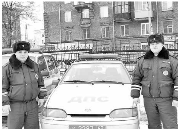
Отличившийся экипаж ГИБДД.