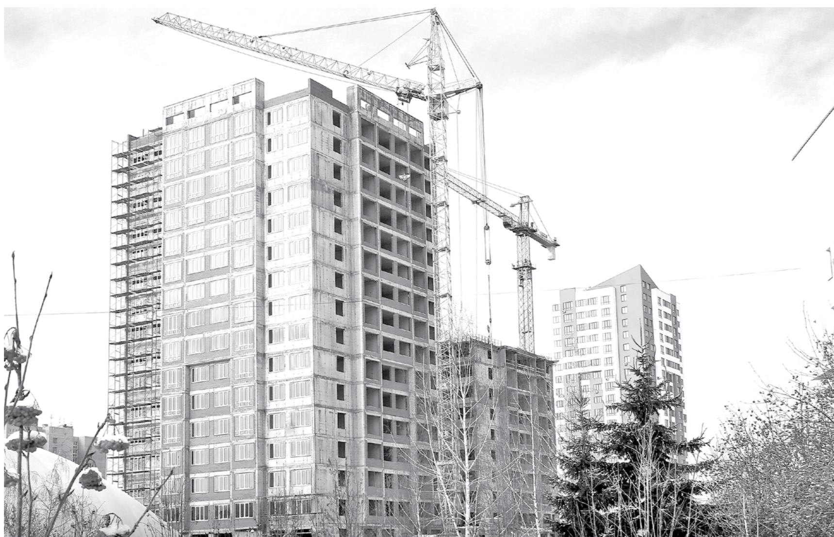
По вводу нового жилья город Кемерово – один из лидеров в регионе.

Прошлый строительный год в Кузбассе выдался сложным, однако и в 2016-м объемы вводимого у нас в строй жилья не уменьшатся, продолжится реализация федеральных программ, по-прежнему будут действовать областные меры соцподдержки на приобретение жилых помещений