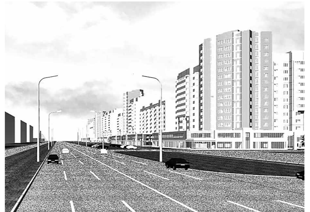
Фрагмент застройки микрорайона №7. Квартал А.