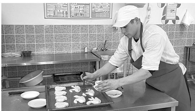
В 2016 году в пищевых цехах УИС Кузбасса планируют расширить ассортимент выпускаемой продукции.

Для внутренних нужд исправительной системы в кеме-