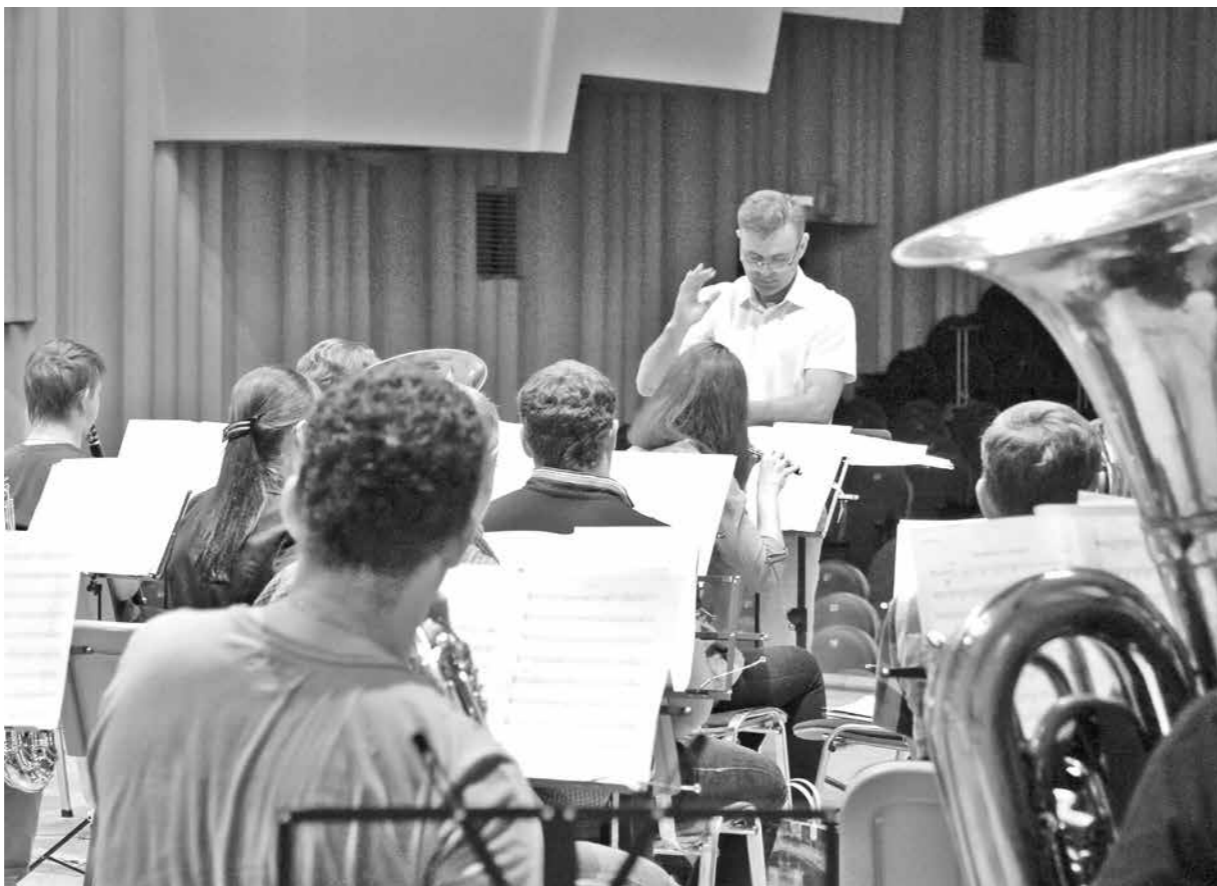
Музыканты недавно образованного Губернаторского духового оркестра во время репетиции.

Стоит отметить, что в этом коллективном филармоническом эксперименте задействованы все три