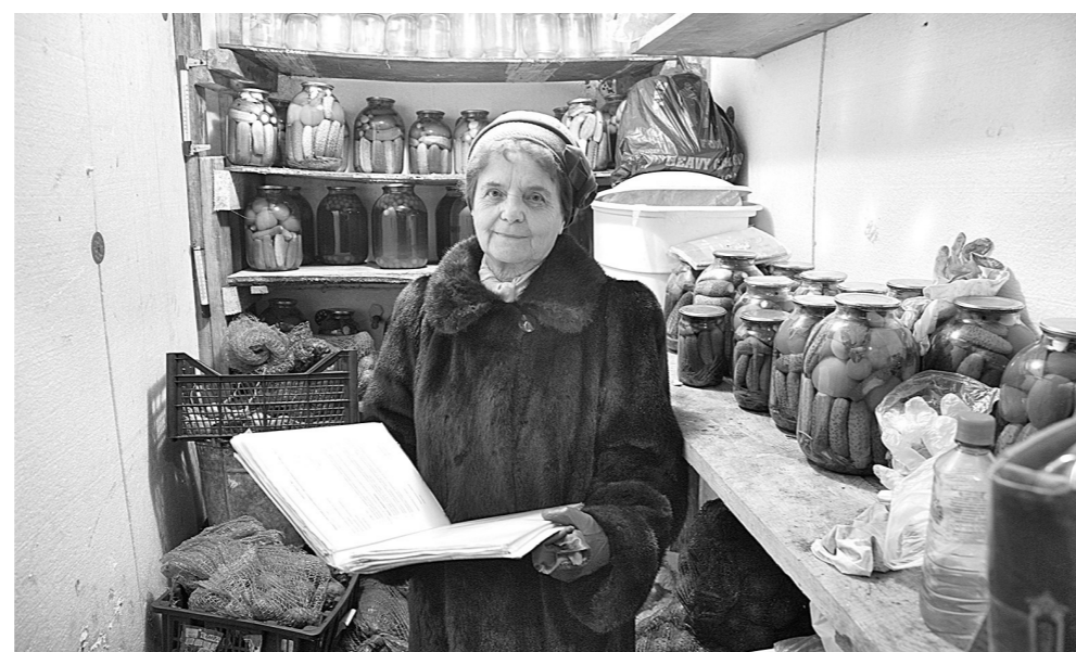
■ Свои огурчики и помидорчики для пенсионеров из «Радуги» – существенная строка экономики семейного бюджета.