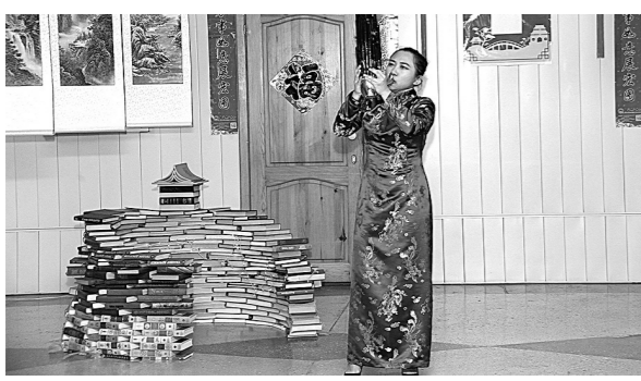
■ В первый день недели китайской культуры в КеМГИК прошел концерт-презентация.