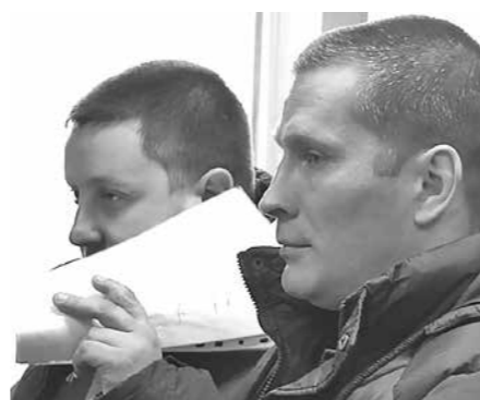
Братья-подельники на скамье подсудимых.

В Центральном районном суде г. Новокузнецка начались слушания нового уголовного дела: двое родных братьев обвиняются в том, что под видом сотрудников Наркоконтроля обирали водителей автомобилей.