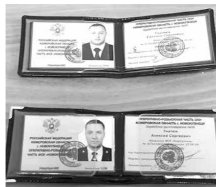
Поддельные удостоверения сотрудников Наркоконтроля, которыми пользовались братья, теперь фигурируют в уголовном деле как доказательства их преступной деятельности.

Так продолжалось до тех пор, пока один из потерпевших не обратился в