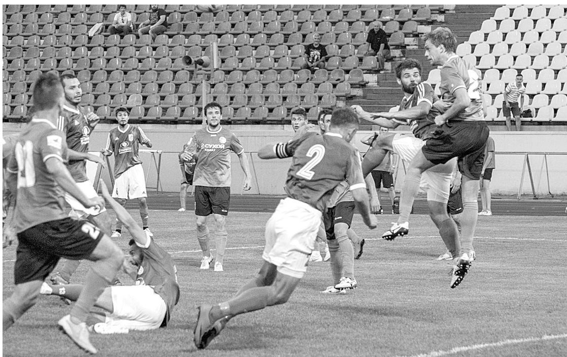
■ Новокузнецкий клуб потерял профессиональный статус, но домашние матчи в новом сезоне по-прежнему сыграет на стадионе «Металлург».