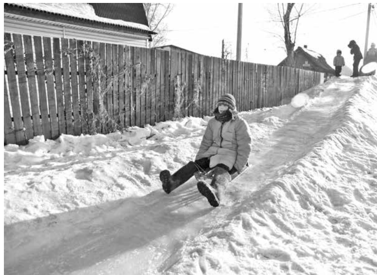
■ Фото Сергея Гавриленко.