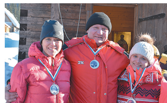
■ Фото Бориса Химича.