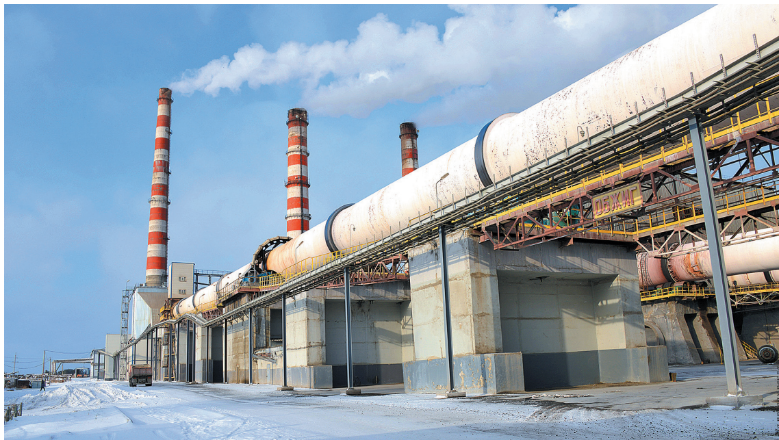
■ Визитная карточка завода - знаменитая пятая печь.

Легендарный, современный, перспективный, родной. А ещё – путеводная звезда, бриллиант и флагман. Все эти слова звучали в адрес юбиляра. Знаменитый Топкинский цементный завод – базовый актив холдинга «Сибирский цемент» – отметил пятидесятилетие. Торжественное собрание, приуроченное к этой дате, прошло в ДК «Цементник» города Топки.