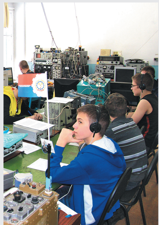
Занятия радиоспортом требуют особого внимания.