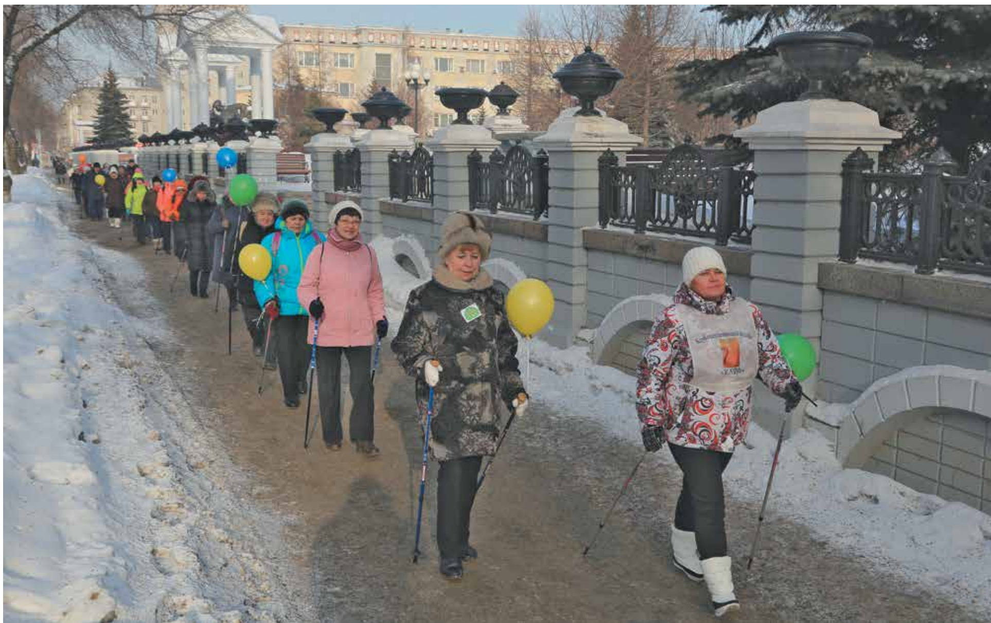
В Новокузнецке активным участникам программы по оздоровлению вручили палочки для скандинавской ходьбы.