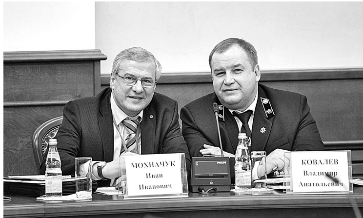
■ Конференция «Перспективы развития углехимии в России» еще раз подчеркнула значимость химической отрасли для Кузбасса.

Недавно прошедшая в Кемерове Всероссийская научно-практическая конференция «Перспективы развития углехимии в России: наука, технологии и производство» еще раз подчеркнула значимость химической отрасли для Кузбасса – центра российской угольной промышленности.