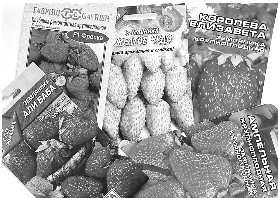
■ Фото Федора Баранова.