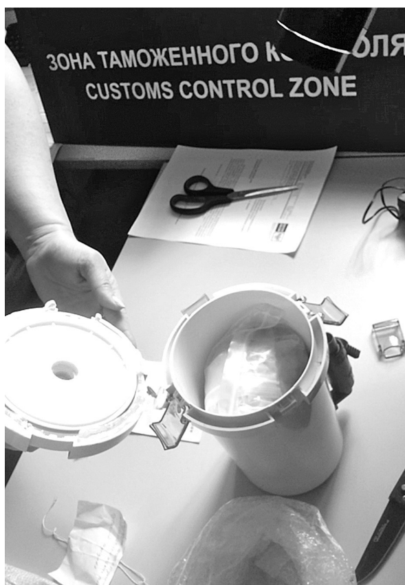
■ Синтетические наркотики, которые пытались нелегально переправить на территорию России, были спрятаны внутри обычного фильтра для очистки воды, присланного в посылке из Китая.

Всего же в прошлом году в Кемеровской таможне было возбуждено 32 уголовных дела - в том числе за уклонение от уплаты таможенных платежей при ввозе товаров иностранного производства, за нарушения валютного законодательства, а также за другие противозаконные действия.