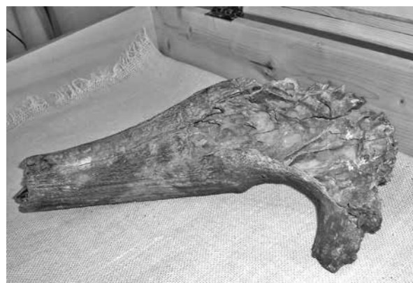
Кто знает, может быть, когда-нибудь по примеру села Шестаково в городе Тайге откроют кладбище древних бизонов...