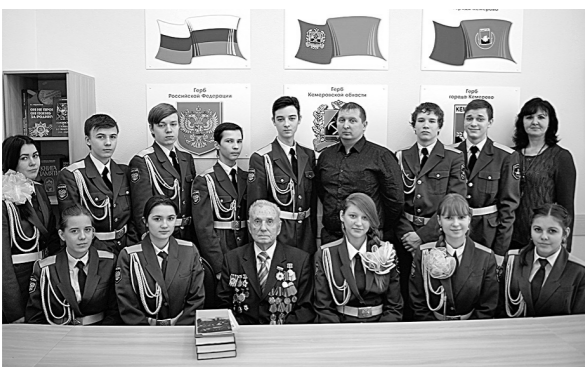
Встреча с ветераном на Посту №1 в Кемерове.