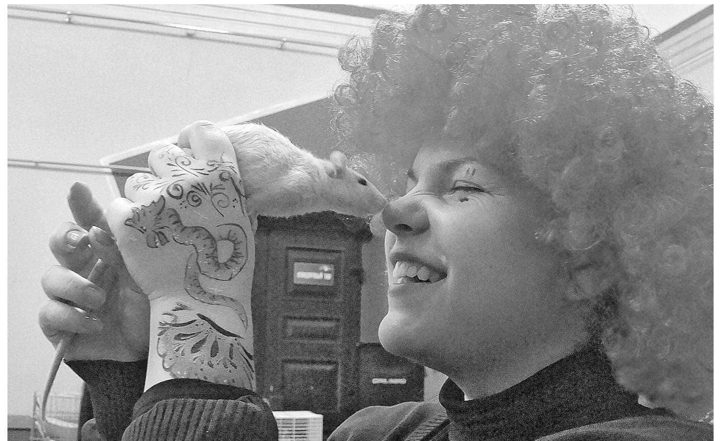
«МАЛЕНЬКИЙ, ДА УДАЛЕНЬКИЙ». Выставка декоративных животных с таким названием прошла в Кемерове. Хорьки, шиншиллы, песчанки, дегу, морские свинки, хомяки, декоративные крысы – больше 200 зверушек из разных городов Сибири приехали продемонстрировать свою красоту. Оценить ее были приглашены эксперты международного уровня из Москвы и Новосибирска. Кстати, на выставке можно было не только полюбоваться на животных, но и зарегистрировать своих собственных питомцев для оценки экспертов.