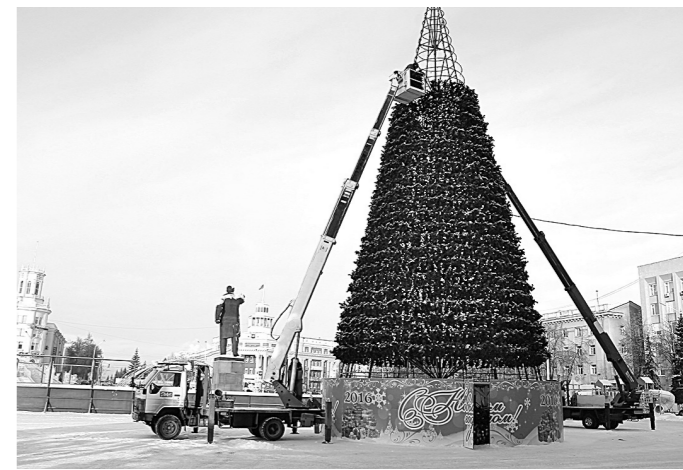
На площади Советов демонтируют главную кузбасскую новогоднюю елку.