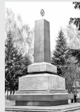
Памятник борцам за революцию в Кемерове.

...Мужество первых палаток, трудовой гордостью, комсомольской честью мы зовещаем Вам, поколение 100-летия ВЛКСМ, отдать все силы во славу и могущество нашей Родины, мы зовещаем свое духовное и материальное богатство. Вам передаем негасимую искорку революции, несите ее дальше в вена...»