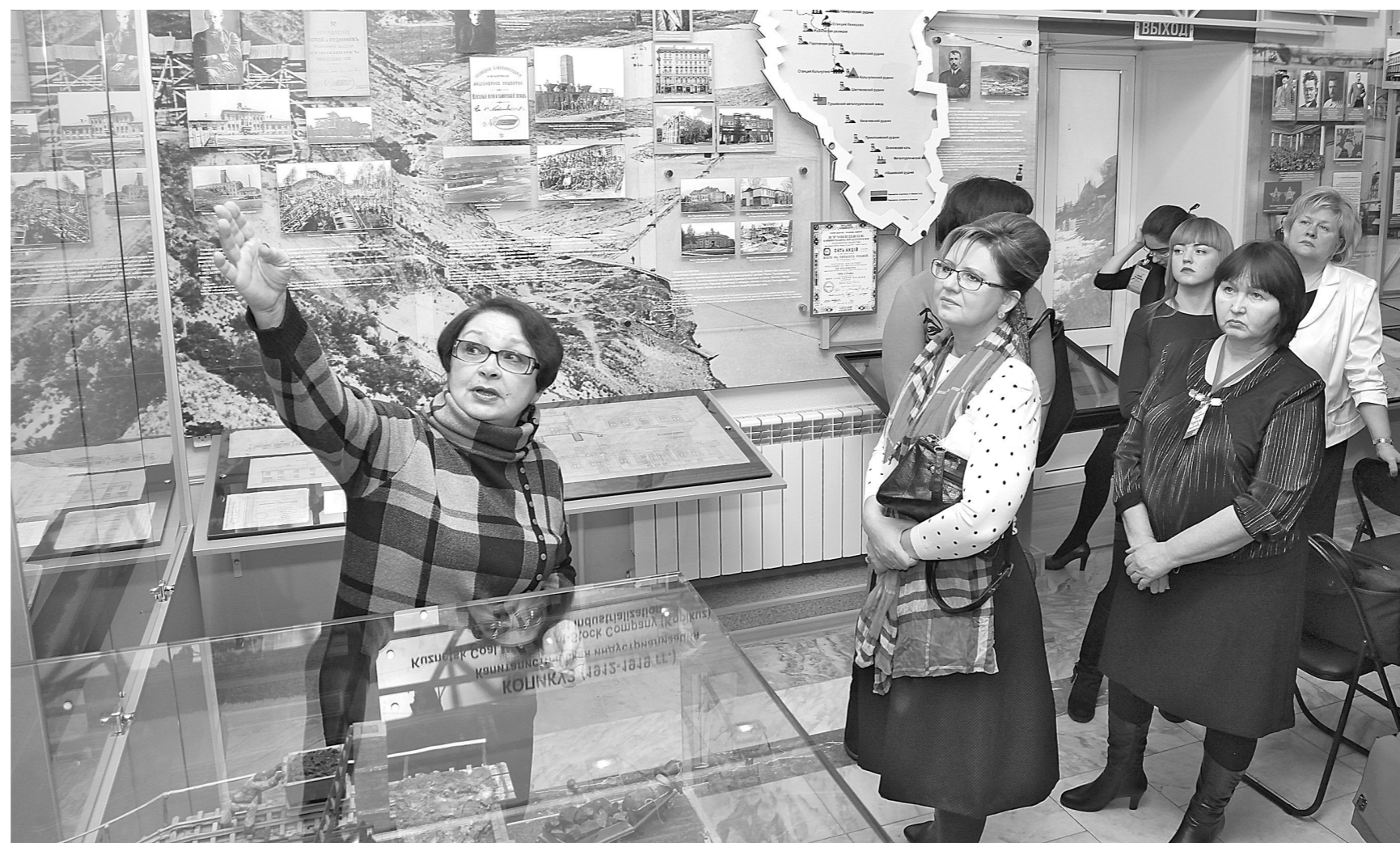
Экскурсия как мост между прошлым и настоящим.

В Кемерове прошел заключительный этап первого регионального конкурса на лучший социальный проект в сфере бизнеса. Его победителями стали предприниматели из Кемерова, Междуреченска и Юрги