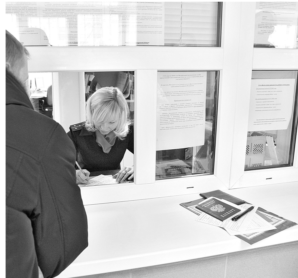
Специалисты миграционной службы готовы ответить на любой вопрос.

Процедура регистрации граждан абсолютно бесплатная. Заявителю нужно обратиться к лицам, ответственным за прием и передачу в органы регистрационного учета соответствующих документов (если местом жительства является многоквартирный дом и заключен договор на его обслуживание), или непосредственно в миграционный центр (МФЦ), с собственником жилья, если местом регистрации является частный дом. При этом необходимо представить следующие документы: документ, удостоверяющий личность заявителя; заявление о регистрации по месту пребывания установленной формы; документ, являющийся основанием для временного проживания заявителя в данном жилом помещении.