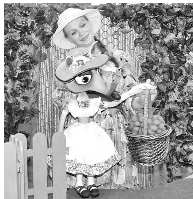
■ «Дачная история».

В 12.00 - «Волк и семеро козлят» (4+), в 14.00 - «Истории Динозавров» (7+), а в 17.00 - «Истории из песочницы» (16+). Телефон для справок: 33-02-62.