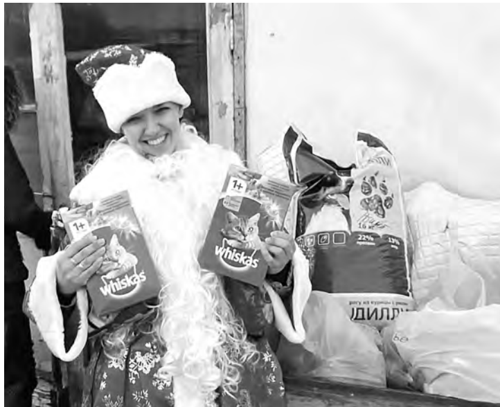
■ Дед Мороз не забыл поздравить собак и кошек из приюта для бездомных животных «Верный».