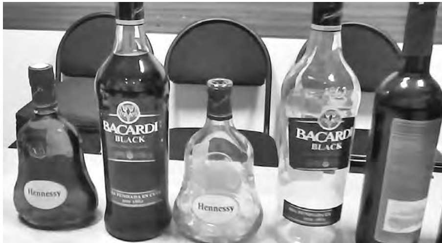
■ Бутылки контрафактного алкоголя, который продавался под видом всемирно известных марок. В этом «элитном» пойле экспертиза обнаружила смертельный для человека яд метанол.