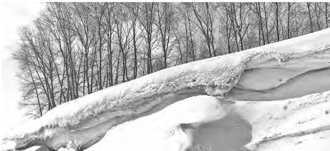
■ Природа в ожидании...