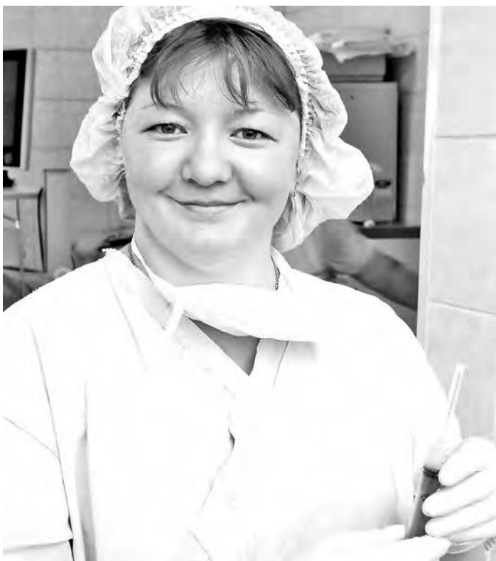
■ Девиз грядущего эпидсезона: «Ни одного отказа в экстренной иммунопрофилактике!»

В департаменте охраны здоровья населения «Кузбассу» пояснили, что вакцина для иммунизации взрослого населения, профессионально связанного с риском заражения клещевым энцефалитом, должна приобретаться за счет средств предприятий. Кроме того, вакцина для взрослых приобретается за счет средств муниципальных бюджетов, страховых компаний и личных средств граждан. За счет областного бюджета проводится иммунизация детей. В 2015 году в рамках программы «Развитие здравоохранения Кузбасса» на то, чтобы привить их против кле-