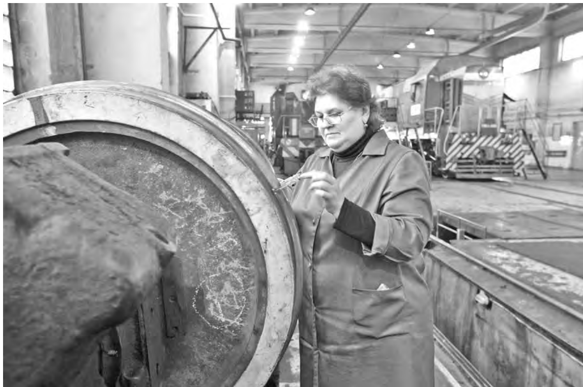
■ Людям, которые продолжают работать и в самом солидном возрасте, необходимо точно знать свои «пенсионные» права.

Если пенсионер прекратил работать после 30 сентября 2015 года, а именно с 1 октября 2015 года по 31 марта 2016 года, он может уведомить об этом Пенсионный фонд. Для этого пенсионер должен подать в ПФР