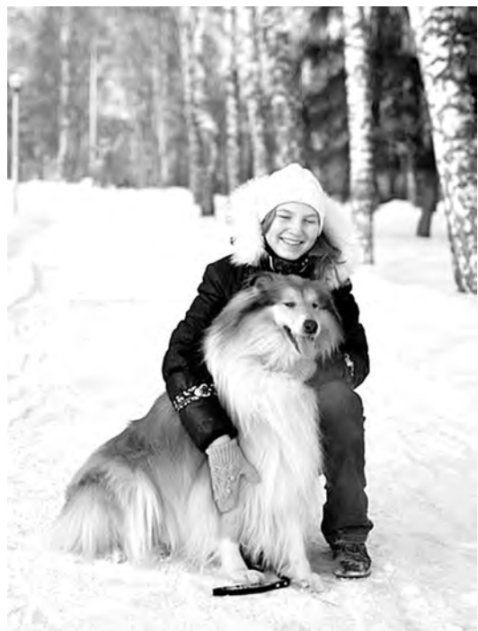
■ Кемеровчанам очень понравилось фотографироваться с этими четвероногими красавцами в рамках первой в городе благотворительной фотосессии.