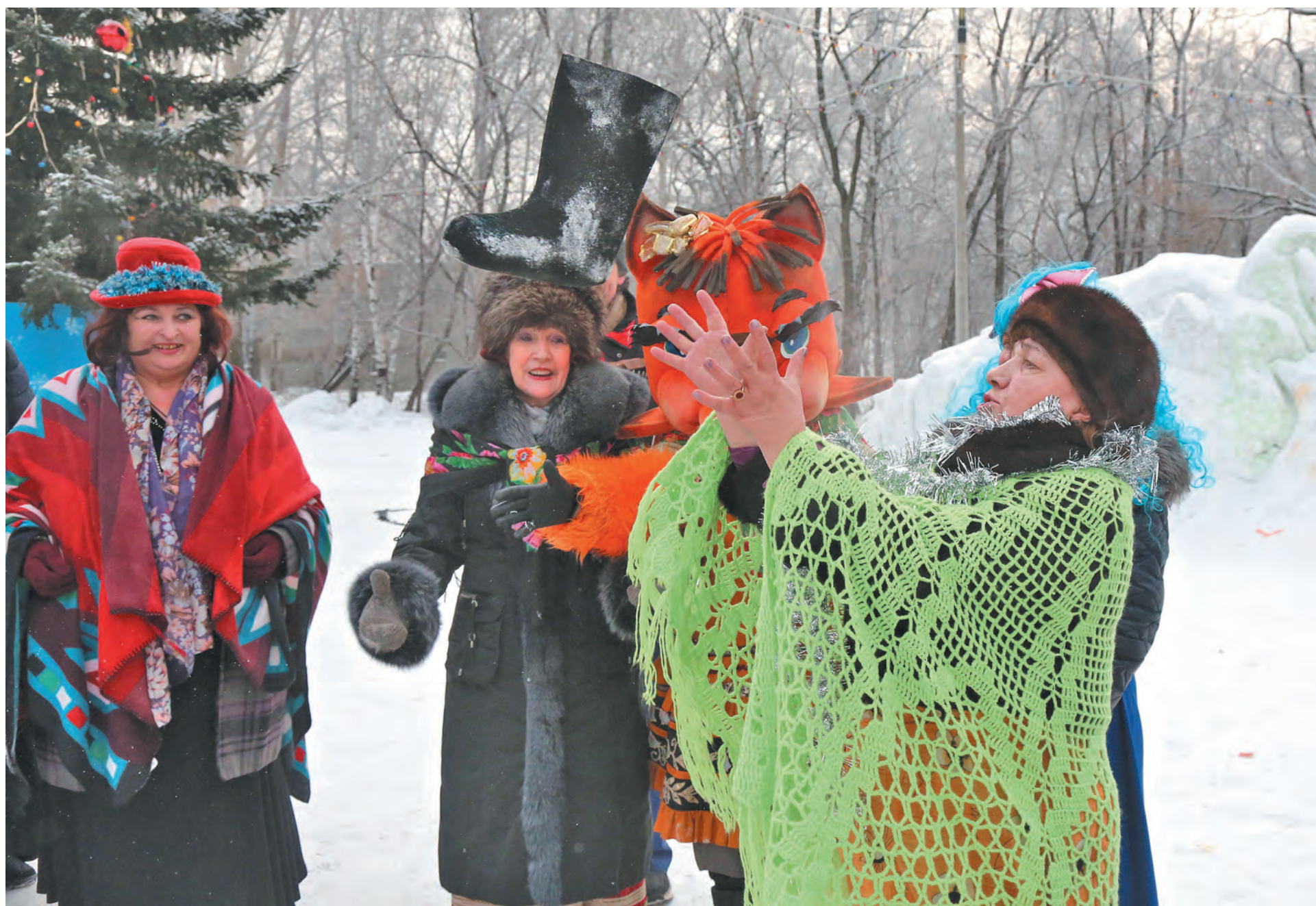
■ Даже если гадание не сбудется, настроение-то все равно поднимется!