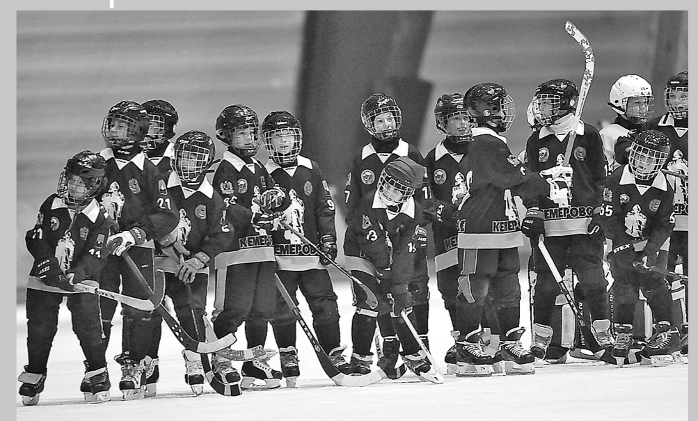
«Кузбасс-2004» – победитель турнира.