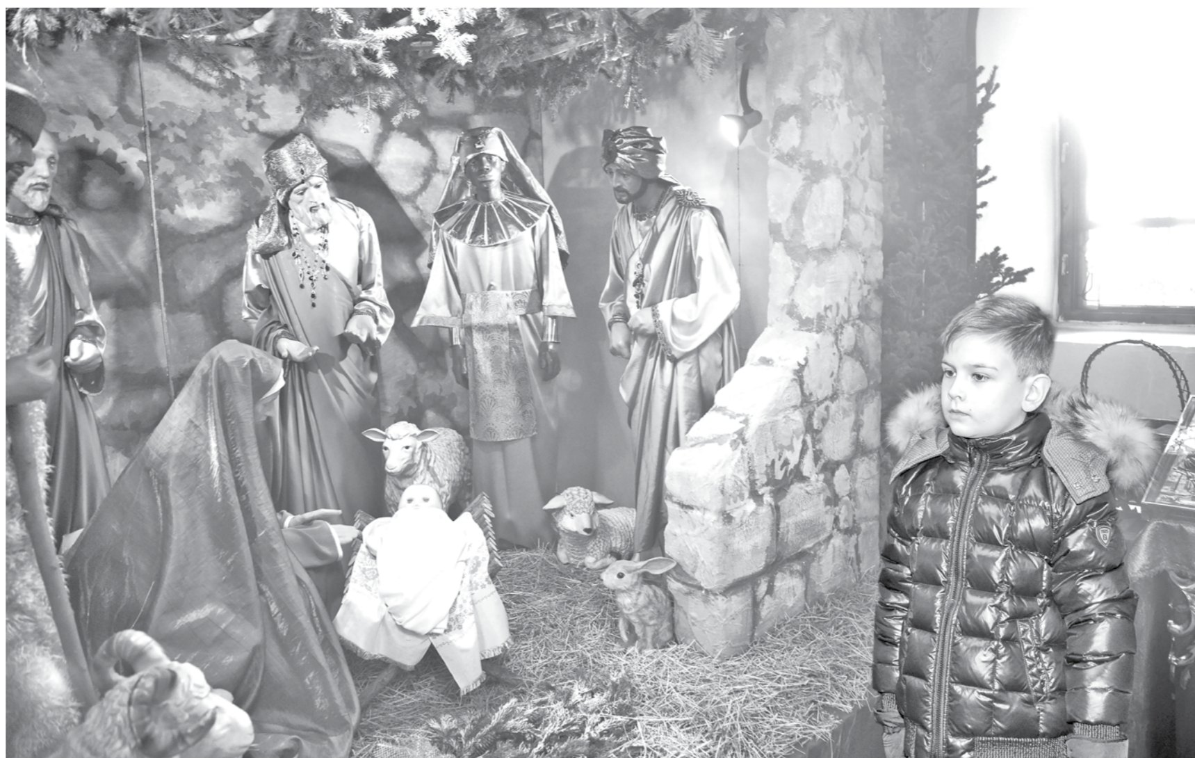
■ Рождество отмечали во всех православных храмах Кузбасса.

Несмотря на завершение каникул, кузбассовцы продолжают отмечать рождественские дни, так называемые святки. Они будут продолжаться до самого Крещения, которое православные празднуют 19 января