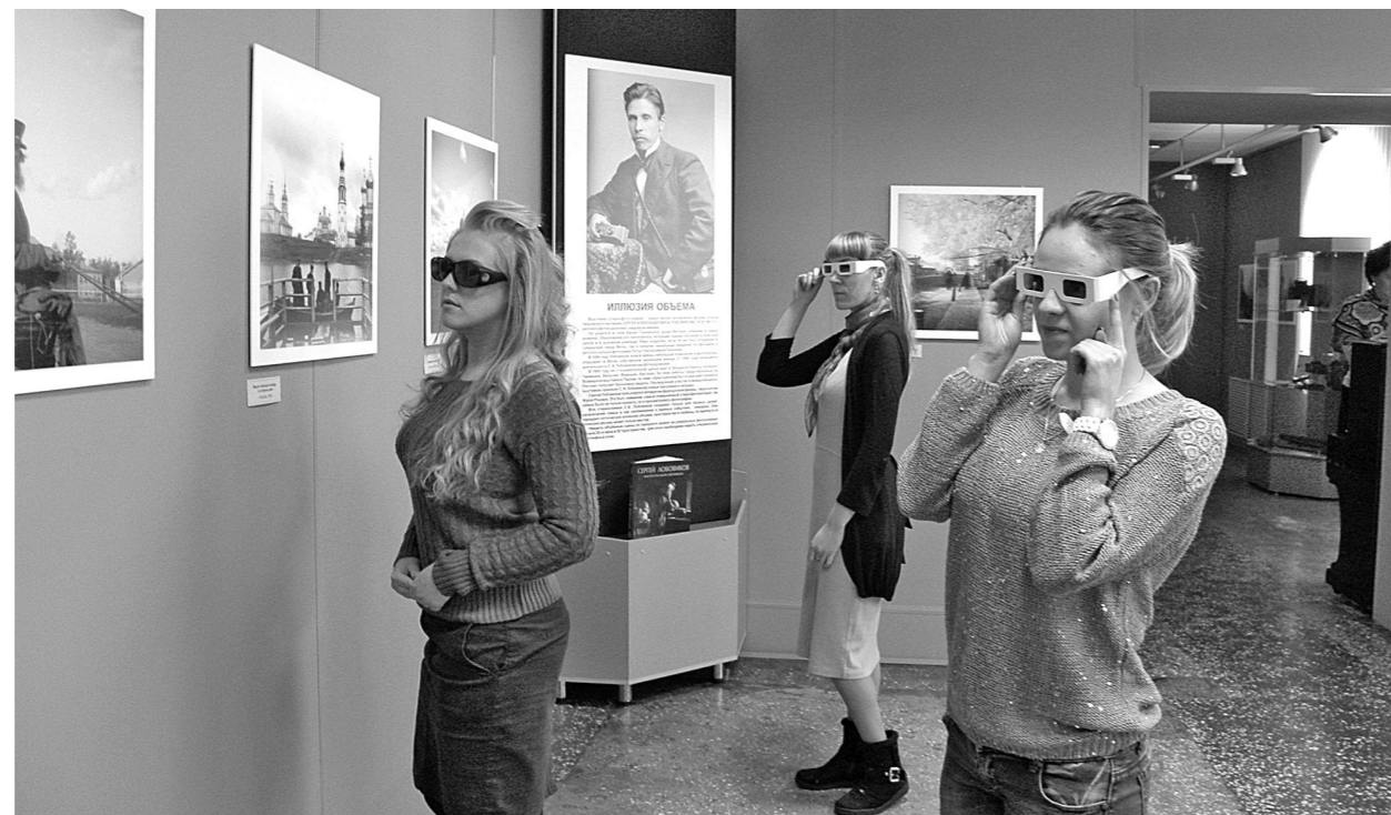
На выставке стереофотографии в Прокопьевске.