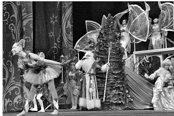
■ Момент конкурса.