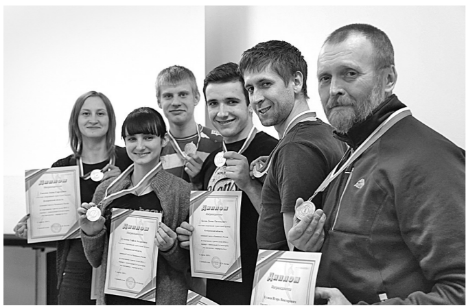
■ Фото из архива ВСЦ «Патриот». Фото Ярослава Беляева.