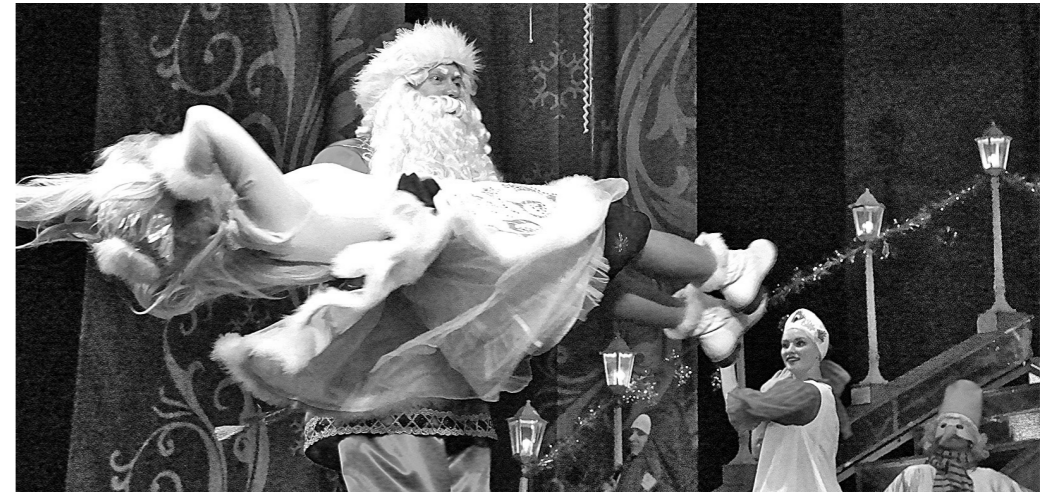
■ Кузбасским Морозам под силу не только выюгу закритить, но и девушек!