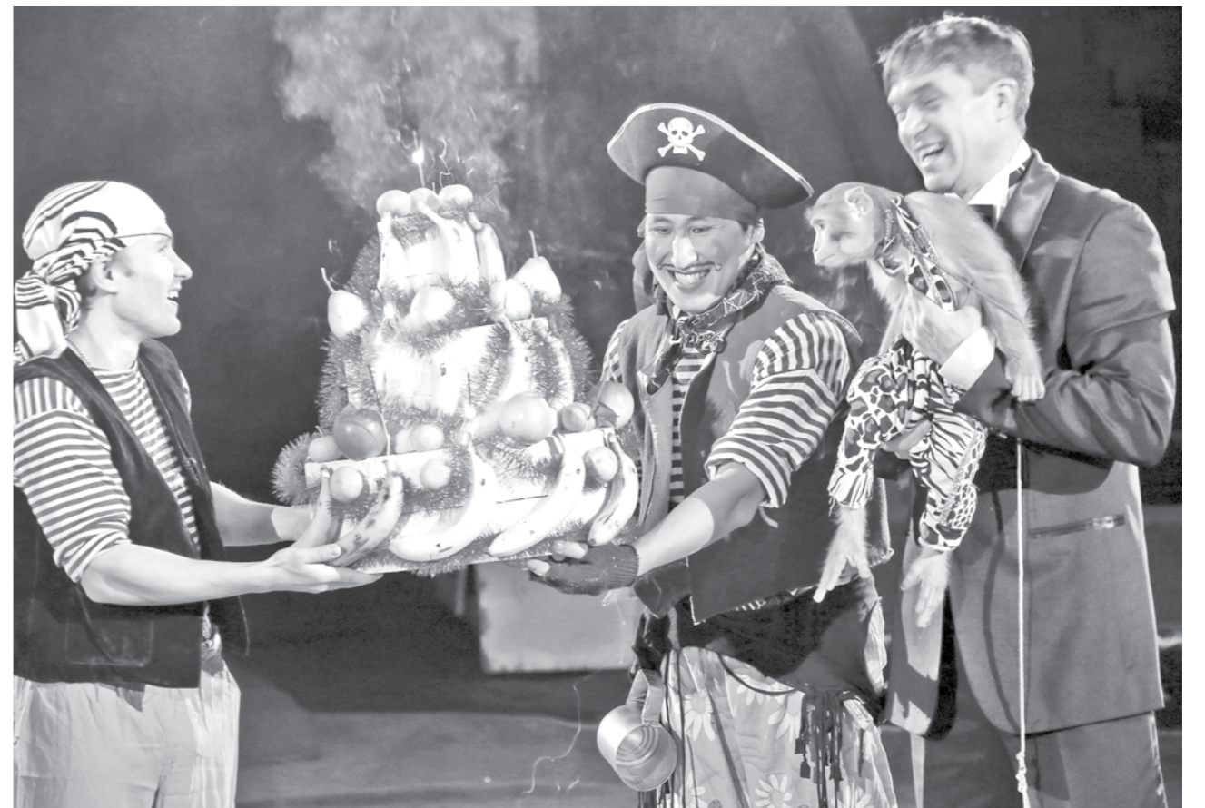
Именины ГРИНИ. В Кемеровском цирке торжественно отметили день рождения символа наступающего года — обезьянки по имени Грина, которая получила в подарок торт из фруктов. В большой компании журналистов именинница очень волновалась, поэтому от переживаний даже прикусила микрофон у коллег с телевидения, которые захотели взять у нее интервью.