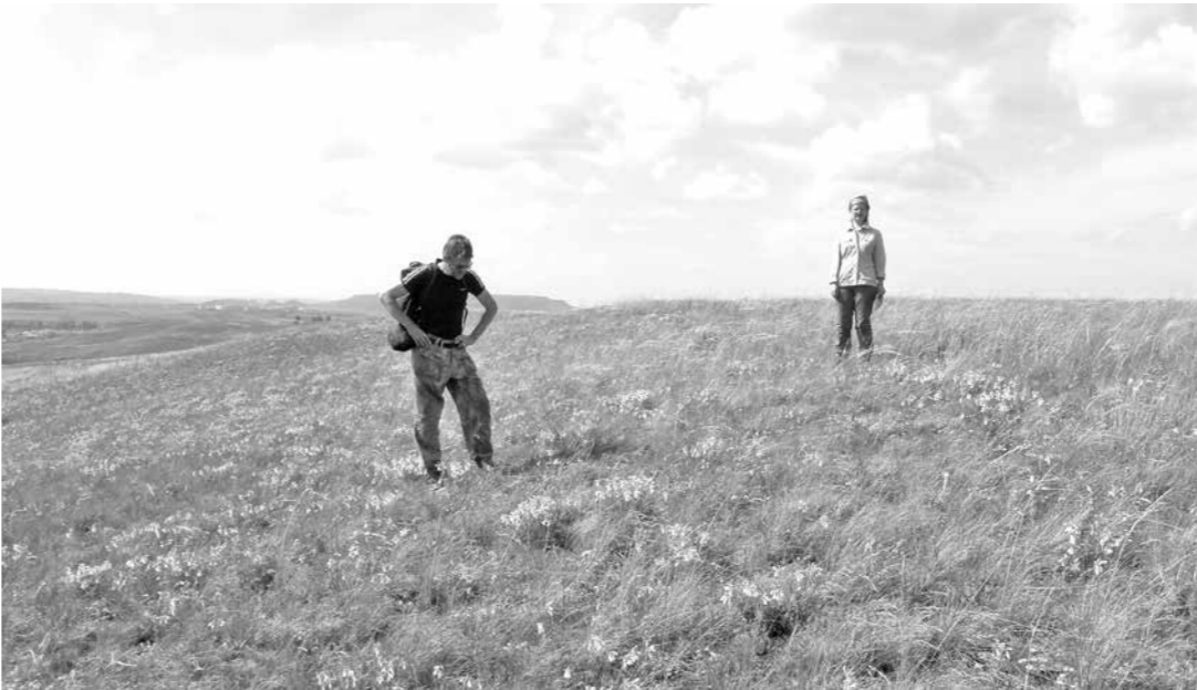
■ На Бачатских сопках работают специалисты Кузбасского ботанического сада.

Есть и другие хорошие примеры. В 2013 году в Новокузнецком районе появился комплексный памятник природы регионального значения «Куз-