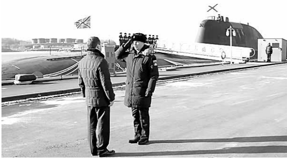
■ То, что «Кузбасс» готов к плаванию, премьер убедился лично.