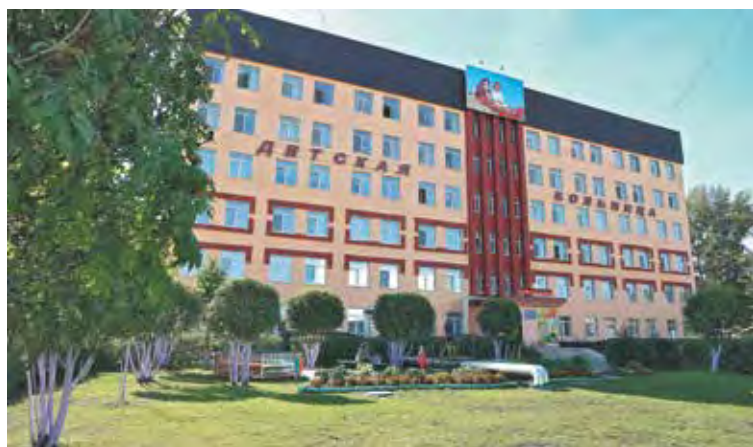
■ Детская больница.

более 600, переселено около шести тысяч семей, или около 18 тысяч человек. Сегодня в Прокопьевске остаётся ещё 580 бараков, в которых проживает пять с половиной тысяч семей. При этом 184 барака признаны аварийными. До конца текущего года снесём ещё 33 старых жилища. Чтобы жилищный фонд города не сокращался, мы активно