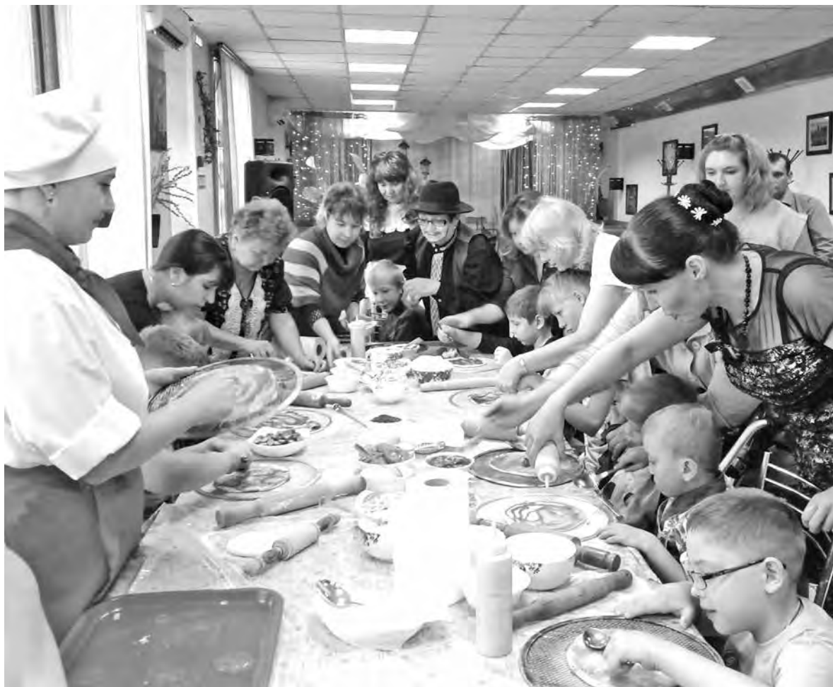
■ Во время приготовления пиццы дети вместе с родителями были очень изобретательны.