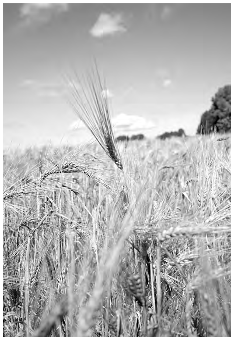
■ Под цимбалы цикад.

– На сегодняшний день, – продолжает, помолчав, – если по честному, смысла нет ни в чем. Хоть по зерну, хоть по мясу, хоть по молоку, поверьте мне... Я много и свиней держу. Вырастил, и куда девать? Некуда. Перекуп старается как можно меньше тебе дать, расплатится не знаю, когда. С говядиной такая же ерунда. У сына двенадцать голов лошадей – то же самое.