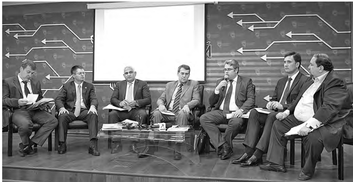
■ Фото Сергея Гавриленко.

Серьёзную помощь областным властям в городах своего присутствия оказывают промышленные предприятия и финансово-промышленные холдинги. Одним из таких долгосрочных партнёров является