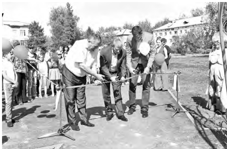
■ Фото Юлии Осиповой.

– Только мы открыли парк, как тут же на скамейке молодожены стали вешать замочки, – расска-