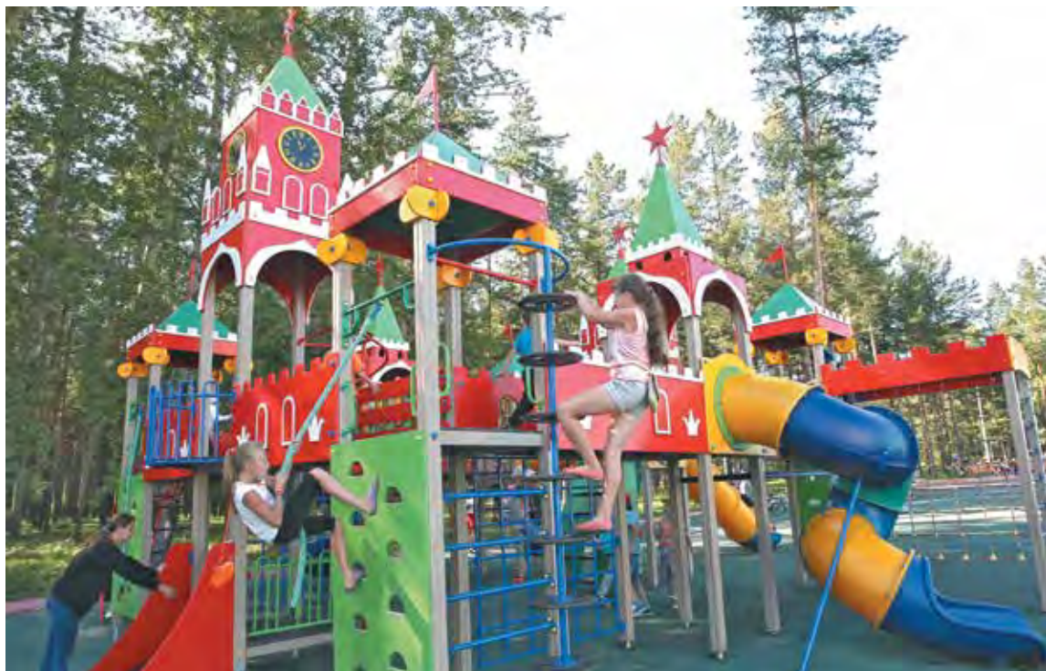
■ Детский городок «Кремль».

- В Прокопьевске, по сравнению с другими территориями Кузбасса, по-прежнему самое большое количество котельных. В 1999 году в городе насчитывалась 141 котельная. В настоящее время осталось 79 теплоисточников. За последние 16 лет мы закрыли 62 маломощные и неэффективные «кочегарки». И работа в этом направлении будет продолжена. В планах на предстоящие три года стоит задача закрыть ещё пять котельных.