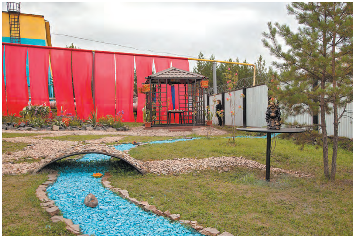
■ Березовские коммунальные системы: 1-е место, котельная №8 ж. р. Кедровки г. Кемерово.

Япония, Германия, Горная Шория и даже полуостров Ямал – во всех этих уголках земного шара можно побывать в течение дня. Всего несколько часов и сотня километров пути – и уже попадаешь на зажигательный карнавал в солнечную Бразилию. Только вот играют страстные латиноамериканские мелодии на территории «Ле-