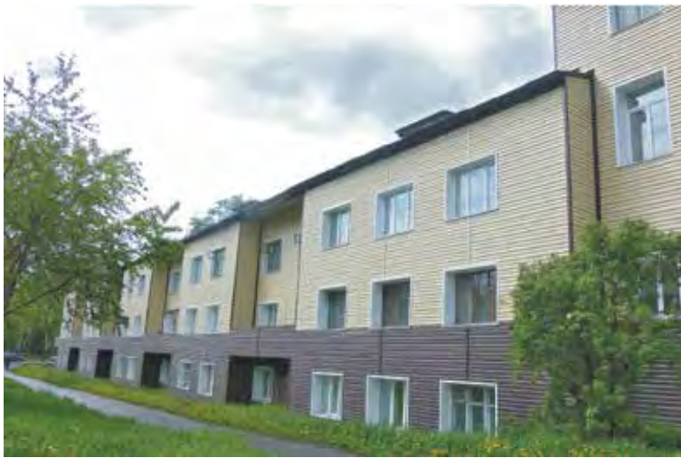
■ Улица Советов.

зяйства. За прошедшее время в городе отремонтировано 71 многоквартирный дом: на 69 зданиях обновлены фасады, на 31 засверкали новые крыши из металлопрофиля. Наиболее крупный ремонт сделан на доме по улице Советов, 5, построенном в далеком 1930 году. На нём отремонтирован фасад с обшивкой сайдингом; покрытие кровли выполнено металлопрофилем. Нарядный вид также приобрели внутридворовые территории. Так, для детишек 23 многоквартирных домов оборудовано 12 игровых площадок. Например, в канун областного праздника жители домов №35, 37 и 39 по проспекту Строителей получили в подарок деревянную детскую площадку, стилизованную под русскую старину, – от семьи генерального директора ООО «Кузбасская энергосетевая компания», депутата облсовета Петра Куруча. Она удачно вписалась в местный ландшафт.