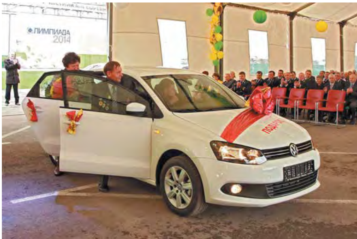
■ Подарок – по заслугам!