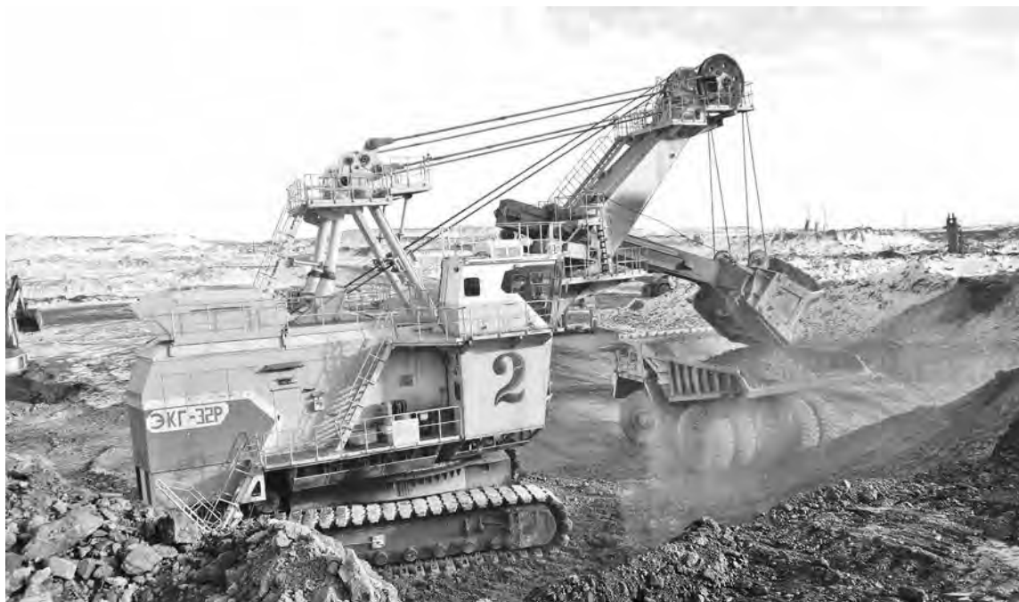
■ ЭКГ-32Р – импортзамещение в действии.

Развиваться, осваивать новую технику и технологии, держать руку на пульсе времени, но при этом сохранять лучшие традиции, накопленные десятилетиями плодотворной работы, – секрет своего успеха крупнейшая в России компания открытой угледобычи УК «Кузбассразрезуголь» не скрывает. И если современная реальность ставит новые задачи, значит, надо выходить на новый уровень.