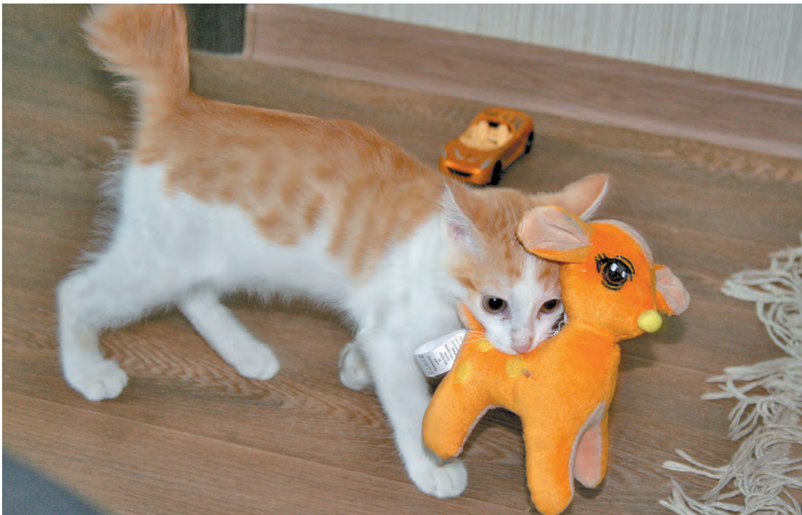
■ Несу тебя, олень, в свою страну бобтейлю...