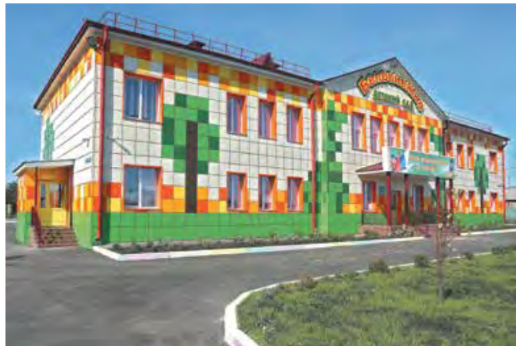
■ Детский сад «Белоснежка».

- Действительно, самый больной вопрос – снос ветхого и аварийного жилья. Бараки построены ещё в 30-40-х годах прошлого века. С 1999 года мы серьёзно занимаемся этим вопросом. За прошедшие годы из 1200 ветхих и аварийных жилых строений снесли