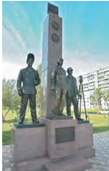
■ Скульптурная композиция «Строителям Кузбасса».

После капремонта открыто здание комитета социальной защиты населения, который обслуживает около 50 тысяч льготных категорий граждан. Также в рамках подготовки к Дню шахтёра