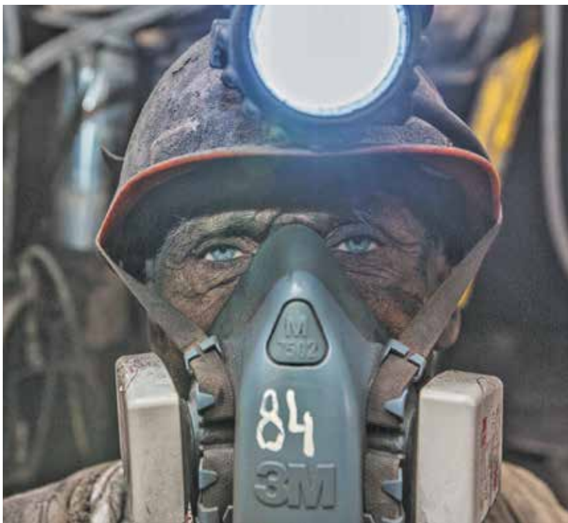
■ Тот самый кадр с фотовыставки, поразивший многих.