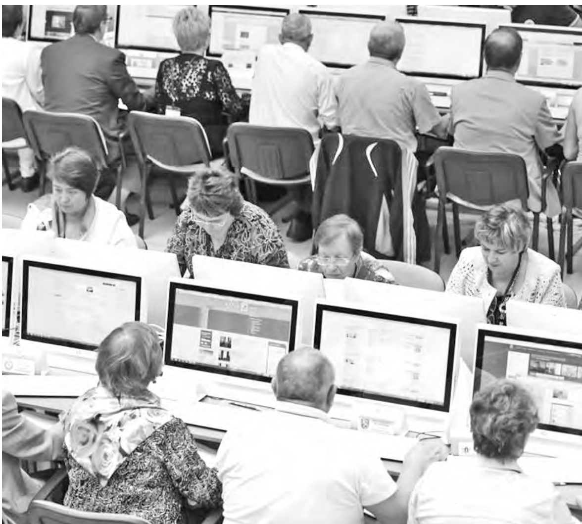
■ Во время компьютерных состязаний пенсионеры очень волновались.