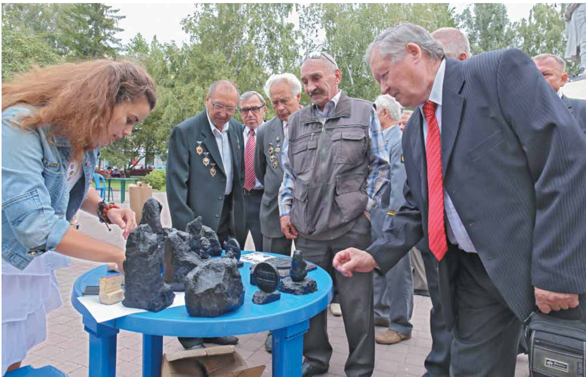
■ Фото Рашида Салихова.