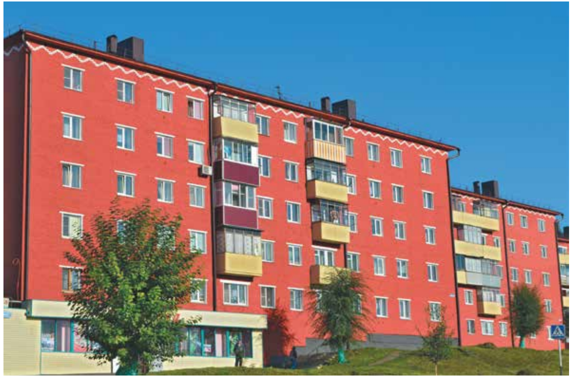
■ Улица Пионерская.

В ходе подготовки к празднику ограждения частных домовладений вдоль основных автомагистралей обновлялись и заменялись новыми – из штакетника и металлопрофиля. «Зелёные лёгкие» города увеличились на 13 тысяч деревьев и кустарников, большая часть