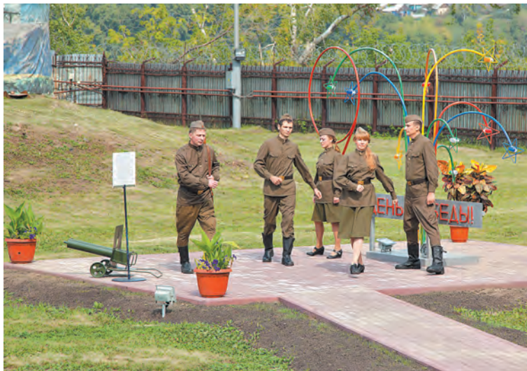
■ ОАО «КемВод»: номинация «За веру и Отечество».