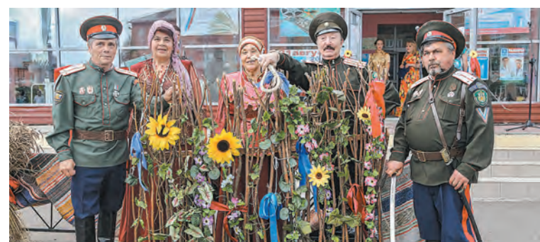
■ Награждение победителей конкурса состоялось в Мариинске, на областном мероприятии, посвященном Дню российского кино.