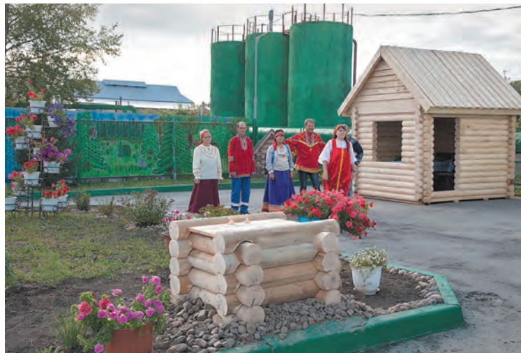
■ Промышленновские коммунальные системы: 2-е место, котельная №15 г. п. Промышленной.