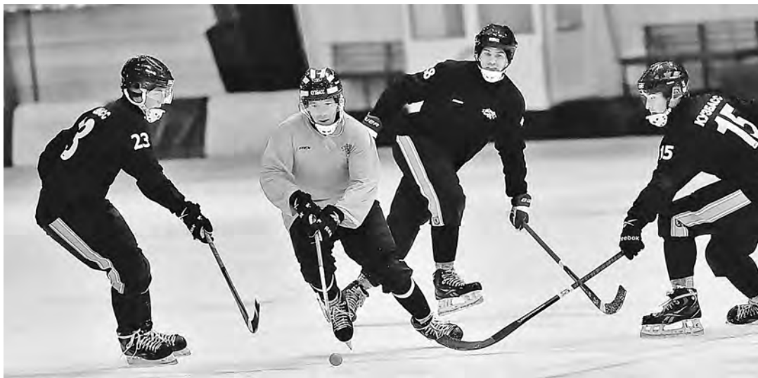
Момент первой тренировки «Кузбасса» на льду.