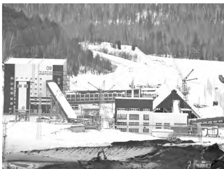
■ ОФ «Калтанская-энергетическая» – первый шаг масштабной обогатительной программы «Кузбассразрезугля».

Горнякам «Кузбассразрезугля» не привыкать быть первопроходцами – сложно сосчитать, сколько моделей горной техни-