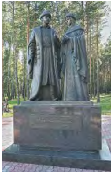
■ Скульптура «Князь Петр и княгиня Феврония Муромские».

Мы активно привлекаем спонсоров к модернизации учебных