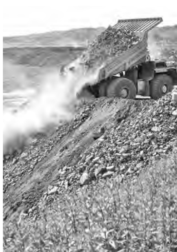
■ Для засыпки гидротвала впервые используется технология разгрузки под откос 320-тонных «БелАЗов».

лет у угольной компании строительство еще трех мощных современных фабрик: на Бачатском, Краснобродском и Моховском разрезах.