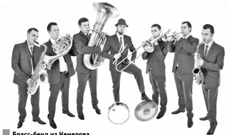
■ Брасс-бэнд из Кемерова.

19 оркестров уже точно стоят в программе, но мы ещё принимаем заявки, так что, возможно, их будет больше. Уже на сегодняшний день это более 400 участников - самостоятельные и профессиональные музыканты. Сам концерт состоится 6 сентября, и главным номером программы, несомненно, станет выступление сводного