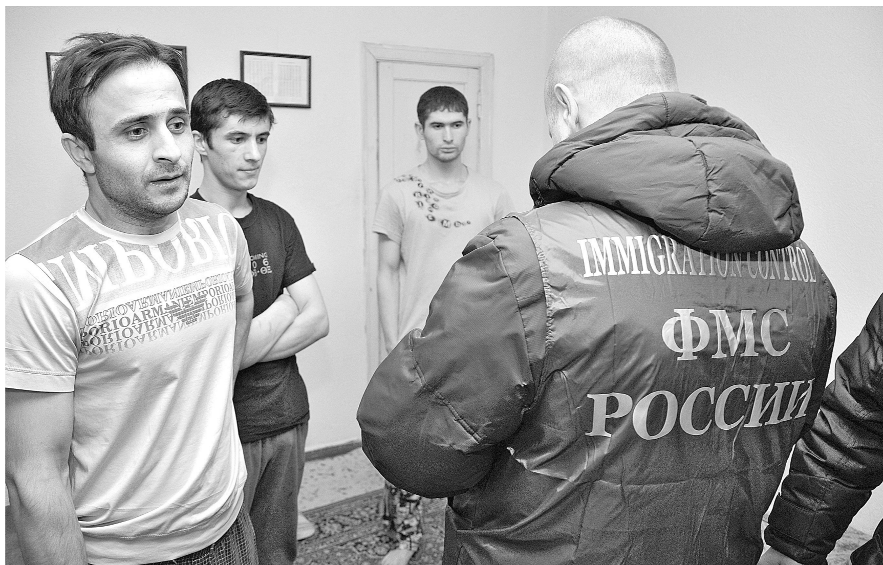
С начала года сотрудники УФМС по Кемеровской области составили свыше 1700 протоколов по фактам фиктивной регистрации иностранных мигрантов.

В Кузбассе снята проблема с так называемыми «резиновыми квартирами». Тем не менее с начала 2015 года только за фиктивную регистрацию иностранных мигрантов на собственников квартир в нашем регионе было возбуждено 70 уголовных дел