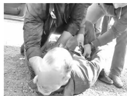
■ Как правило, рано или поздно подавляющее большинство вымогателей попадает в руки полиции.

- Черда этих преступлений стала возможной только потому, что потерпевшие своевременно не обратились в полицию. Как только оперативники получили от горожан информацию о вымогательствах, они сразу же провели спецоперацию по задержанию членов преступной группировки. В связи с этим хочу еще раз напомнить: если вы стали жертвой преступления, незамедлительно сообщите об этом в полицию. И чем раньше вы это сделаете, тем меньше людей пострадает от действий злоумышленников и тем проще будет сотрудникам органов внутренних дел привлечь их к ответственности.