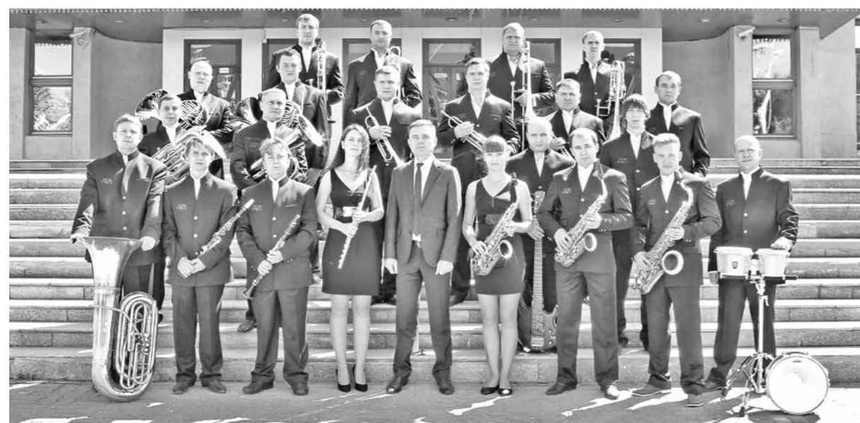
■ Губернаторский духовой оркестр.