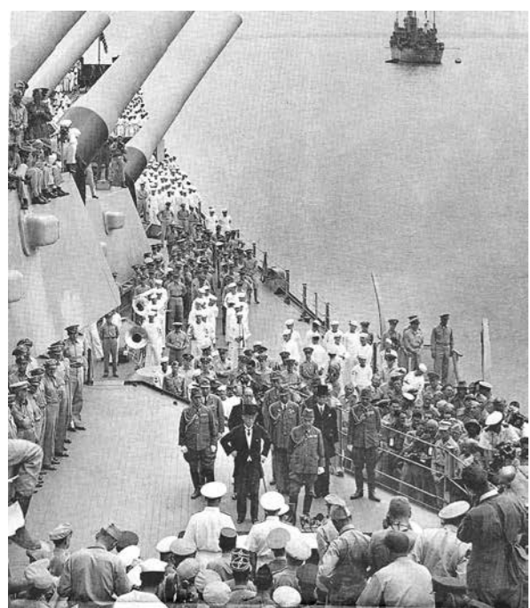
Перед подписанием официального акта на борту линкора «Миссури».