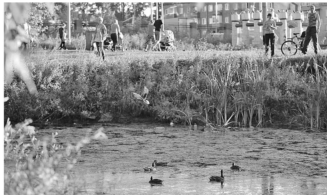
■ Фото Ярослава Беляева.