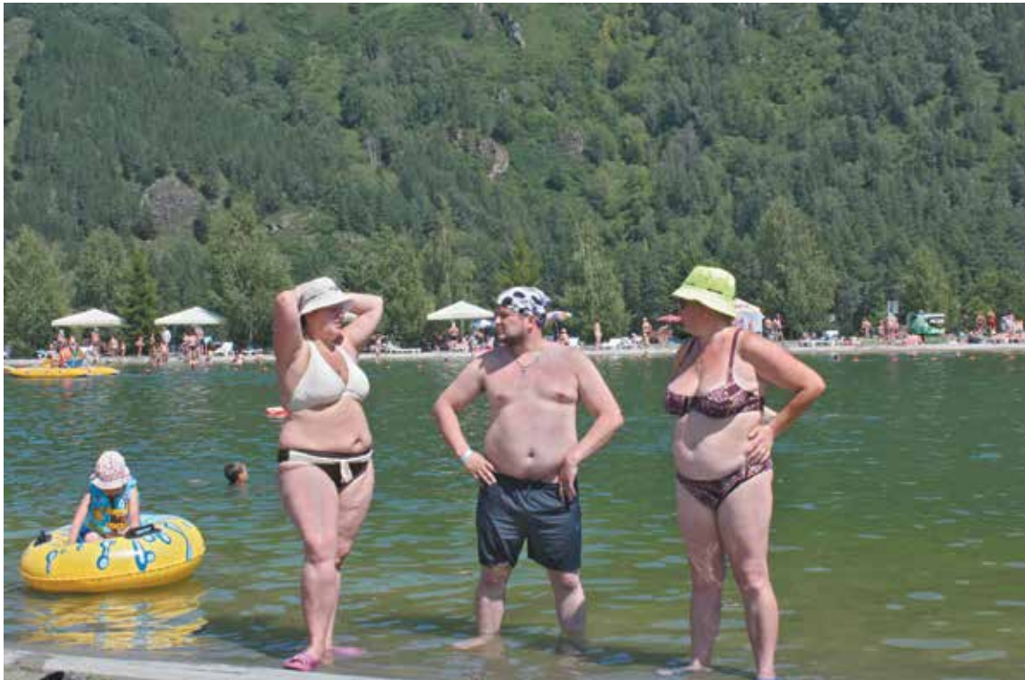
■ Три здоровяка.