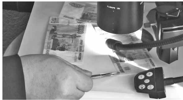
■ Фальшивки были напечатаны на цветном принтере, но качество их изготовления было довольно высоким.