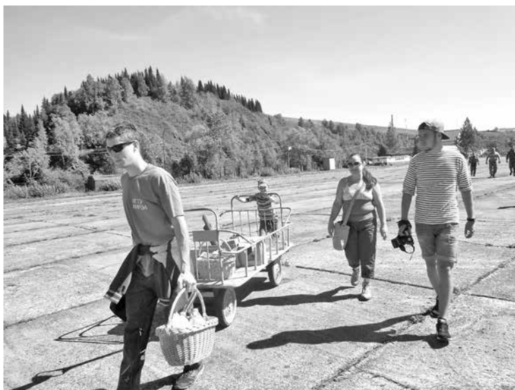
■ Погрузка в вертолет - до Агафьи, Таштагол, 18 августа.