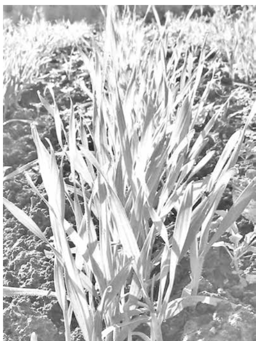
■ Озимая рожь – один из лучших сидератов.

Гряды, где предполагается выращивать томаты в открытом грунте, капусту, а также все культуры, выращиваемые через рассаду, засевают сидератами в самые ранние сроки, едва позволяет это делать погода. Технология посева та же: пройтись по участку плоскорезом, сделать бороздки. Ко времени высадки рассады сидератные растения уже