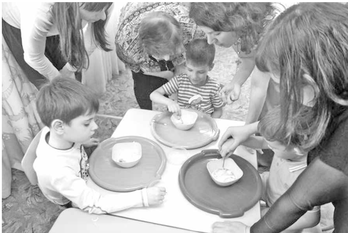
■ Во время правополушарного занятия интересно и детям, и взрослым.

- Чем же особенны полушария нашего мозга?