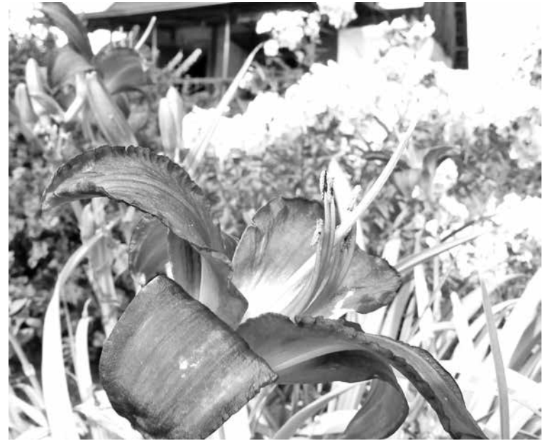
■ И в августе цветы, как летом.