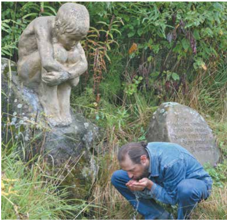
■ Родник с живой водой Кабедата.