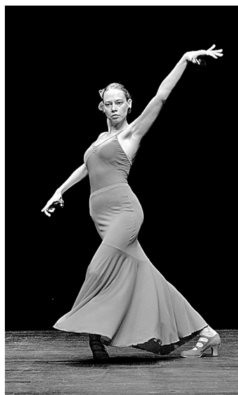
■ Влада на испанской сцене выглядит очень органично.

Ну, а пока живет на малой родине, старается совмещать приятное с полезным: тренируется на сцене ДК «Сарбала», учит танцевать фламенко жителей села и дает