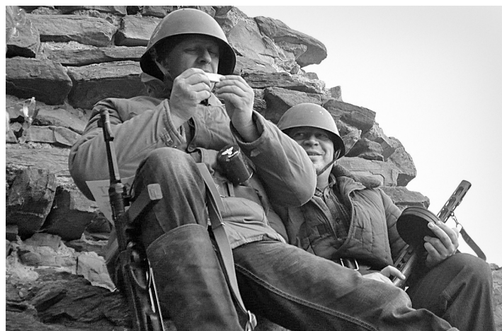
■ Одна из сцен фильма «За Родину!».

Примечательно, что в фильме было задействовано несколько десятков актеров, но всех фашистов, самого Гитлера и всю его армию, сыграл один человек.