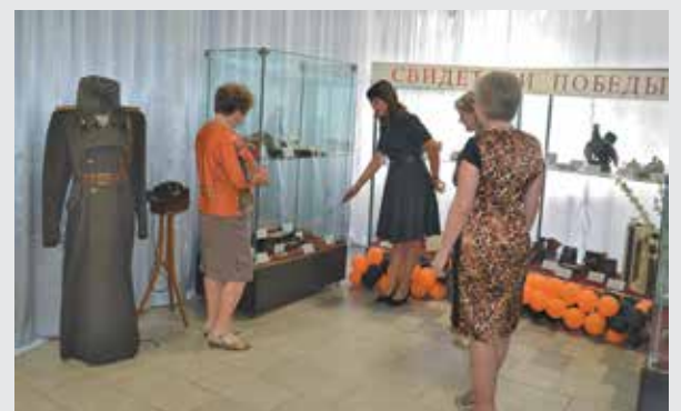
■ Осмотр экспозиции «Свидетели Победы».