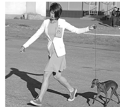
Красотки с родословной 2