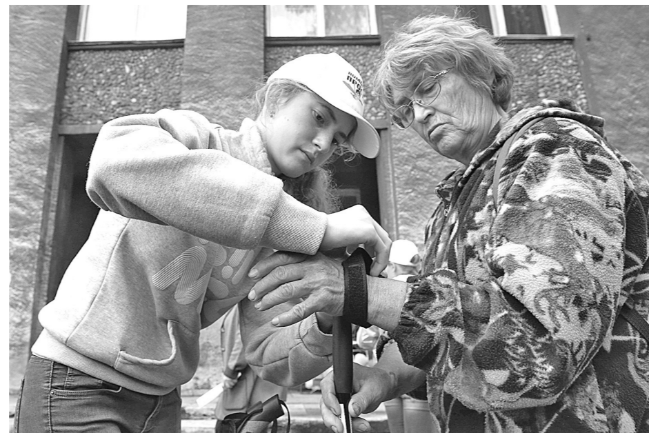
Волонтеры помогли ветеранам освоить новую технику.