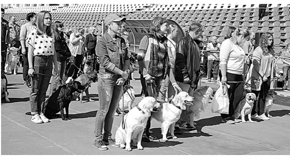
Подобные выставки – радость для собак и их владельцев.