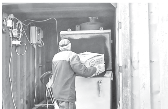
Изъятый товар отправляют в печь.