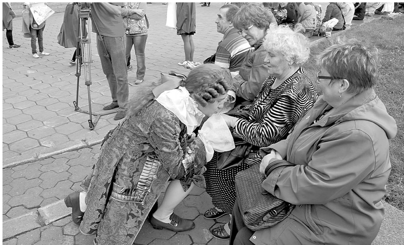
В ТЕАТРЕ ПО АКЦИИ. В Новокузнецке торжественно открылись театральные кассы драмтеатра. В честь этого мероприятия и в преддверии Дня шахтера прошла анция: два билета по цене одного. Эта инициатива театра уже стала традиционной и вызывает большой интерес зрителей. Так, в день открытия касс было продано около 3000 билетов. Одновременно на театральной площадке проходило представление профессиональных артистов вместе с волонтерами, студентами НФИ КеМГУ и воспитанниками детского дома-школы №95. По словам актёров, им будет чем удивить горожан и гостей Новокузнецка в предстоящем сезоне.