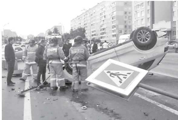
Последствия ДТП на пр. Ленина.