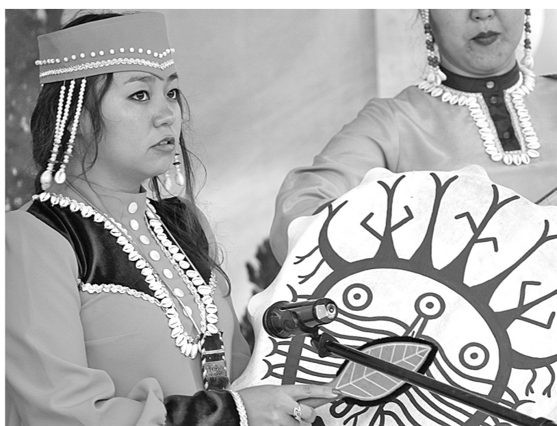
Праздник – это возможность перевоплощения...