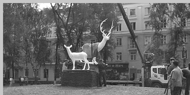
Момент установки обновленного памятника на старое место.