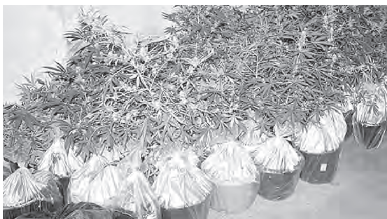
■ Подпольная оранжерея с марихуаной.

В Юрге полицейские задержали наркомана, который обустроил в своем гараже... марихуановую оранжерею