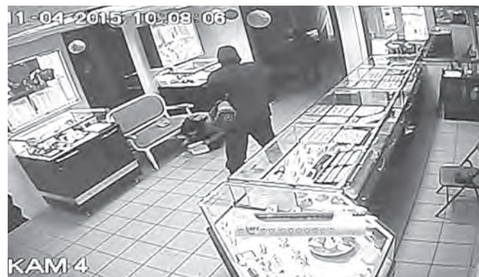
■ Камеры видеонаблюдения, установленные в ювелирном магазине на ул. Гагарина, отчетливо запечатлели все детали налета.