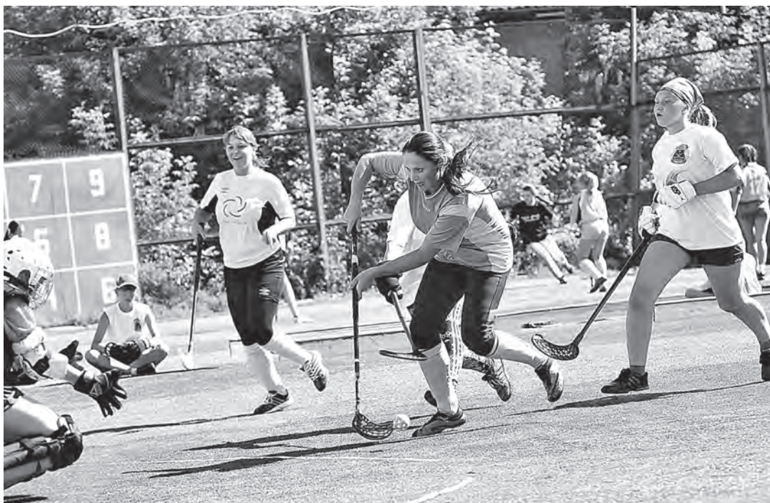
■ На стадионе «Шахтер» находится место для всех желающих заниматься самыми разными видами спорта.