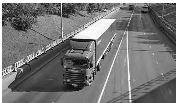
■ Перегруженным тяжеловесам по кузбасским дорогам ездить не рекомендуется: это чревато штрафными санкциями.

Как уточнили наши агенты, кузбасские дорожники уже давно работают в этом направлении. Ведь в нашем угольном регионе, где груженные тяжеловесы курсируют и по региональным, и по федеральным трассам, эта мера уже давно стала необходимостью. И пунктов весового контроля у нас тоже немало. Так, по состоянию на 1 августа 2015 года на 17 стаци-