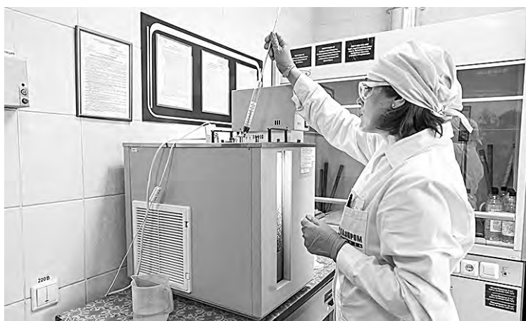
■ Проверка качества топлива в лаборатории.

В июне в «Газпромнефть-Лаборатории» был утвержден новый стандарт, который устанавливает повышенные требования к проверке качества нефтепродуктов. Так, например, сверх требований Технического регламента Таможенного Союза бензин дополнительно проверяется на отсутствие негативного влияния на оборудование топливной системы автомобиля и химическую стабильность при хранении. В свою очередь дизельное топливо проходит проверку по температуре фильтруемости.