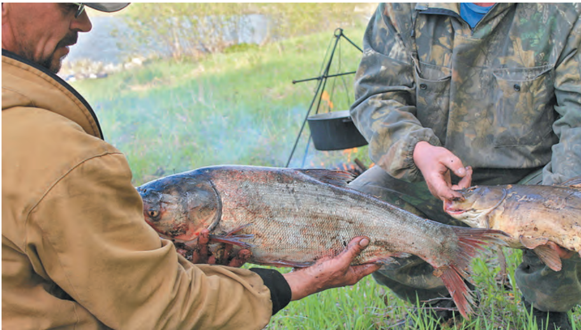
■ Рыба ищет, где лучше, а человек – где она больше.