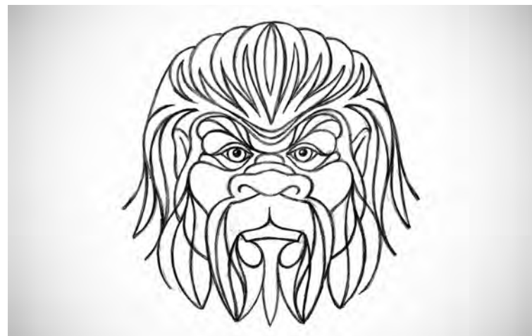
■ У Табана глаза человека, а не животного.

Как сообщают наши агенты, в исследованиях криптозоологов (энтузиастов, занятых поисками снежного человека) встречаются истории, где описывается, как йети общается с людьми с помощью гипноза или телепатии. Были даже описаны случаи, когда снежный человек в буквальном смысле слова спасал людей от гибели, показав телепатически картинку, например, упавшей в обрыв палатки. Благодаря этому предупреждению ученым удалось уйти с опасного места и выжить. Кузбасский йети Табан тоже, по всей видимости, дружелюбно настроен. И, вероятно, в скором времени он снова выйдет на связь.