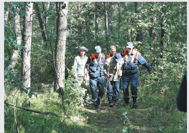
■ Спасатели помогают выбраться из леса заплутавшему грибнику.