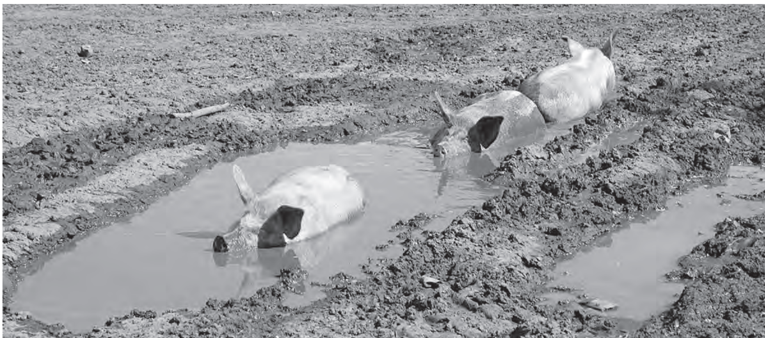
■ Похожие на корабли...