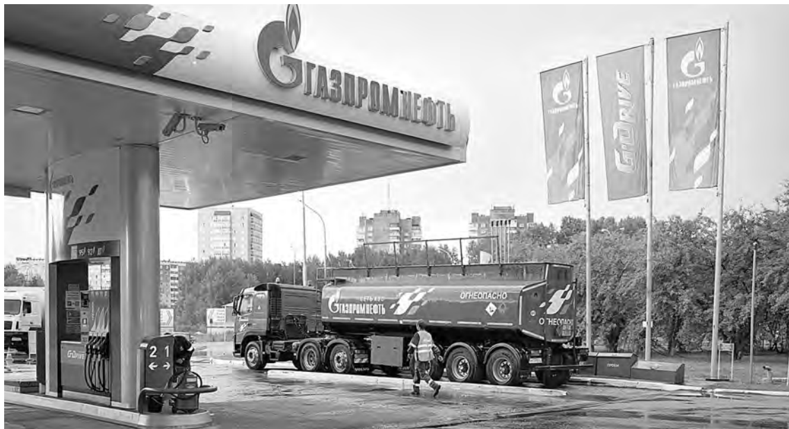
■ Прием топлива не начнется без строгой проверки.

«Каждая партия топлива приходит на нефтебазу с паспортом от производителя, – объясняет