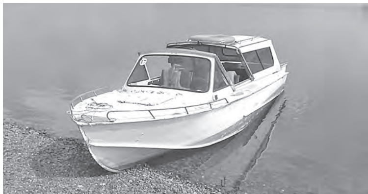
■ На этом небольшом речном суденышке полицейские выявили внушительный список нарушений, напрямую угрожающих безопасности людей.

Стоит отметить, что жители Юрги и небольшого села на противоположном берегу Томи могут пересечь реку по понтонному мосту совершенно бесплатно. Однако находятся желающие воспользоваться речным «такси», которое высаживает пассажира по его требованию прямо напротив дачи или в другом подходящем месте. Быстро, удобно и даже безопасно – но только при условии, если соблюдаются все необходимые правила.