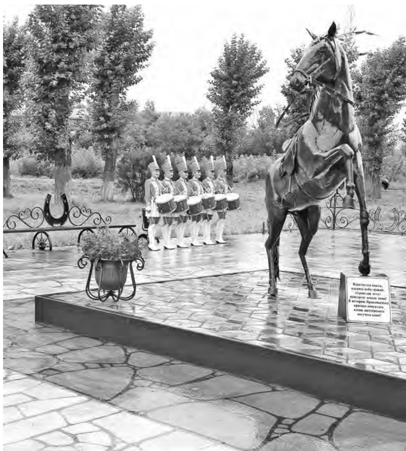
■ Так выглядит новый памятник в Прокопьевске.