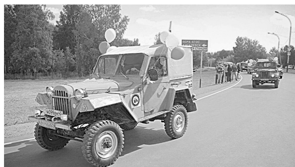
■ Открытие дороги стало настоящим праздником.