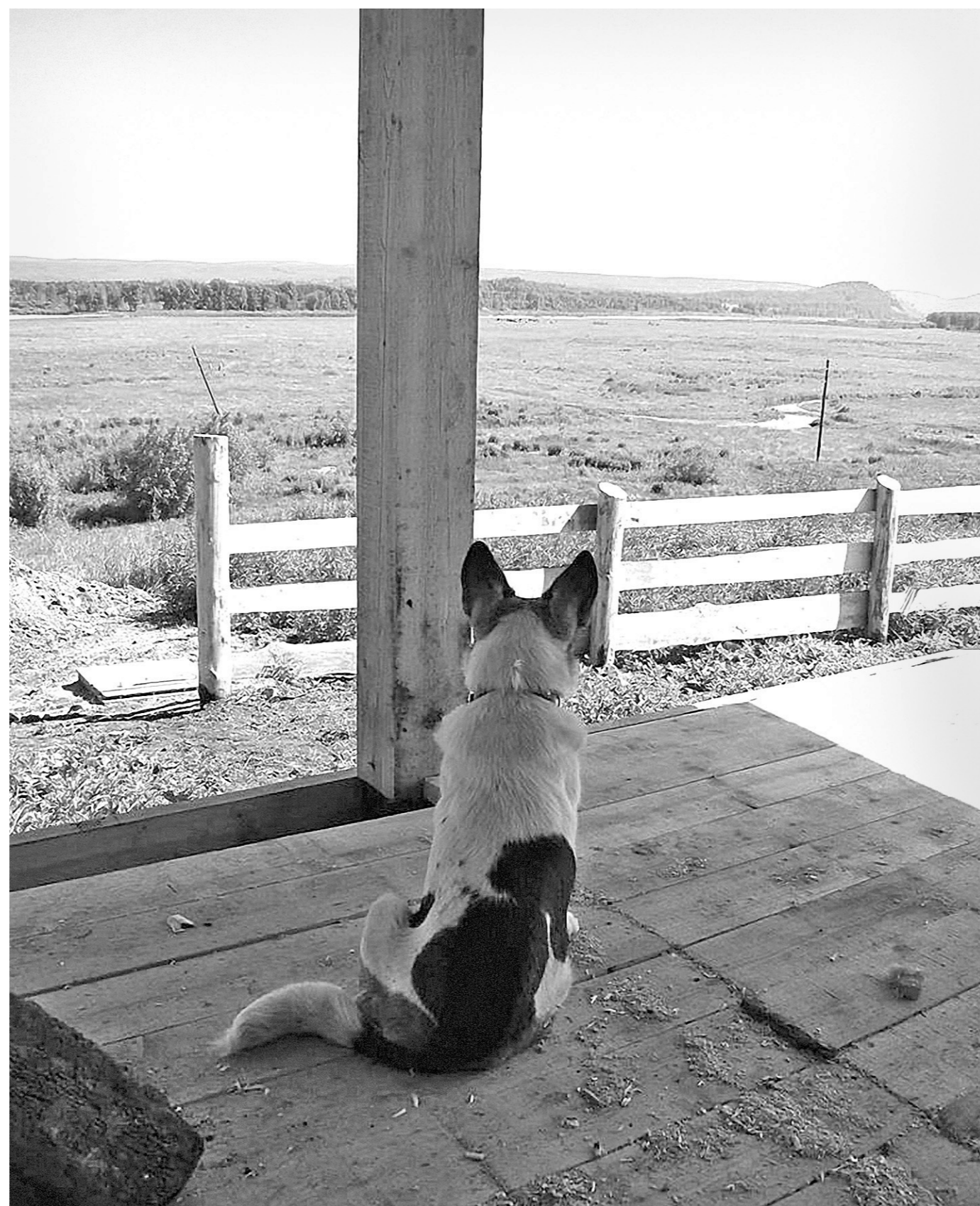
■ В Чумае нашлось немало пространства для творческой фантазии.

Кузбасский проект «То, что люблю» победил во Всероссийском конкурсе для малых городов и сел «Культурная мозаика». Теперь благодаря грантовой поддержке в селе Чумай Чебулинского района зарождается интересное творческое направление: формирование нового облика населенного пункта с помощью обращения к традициям современных средств работы с внешним пространством.