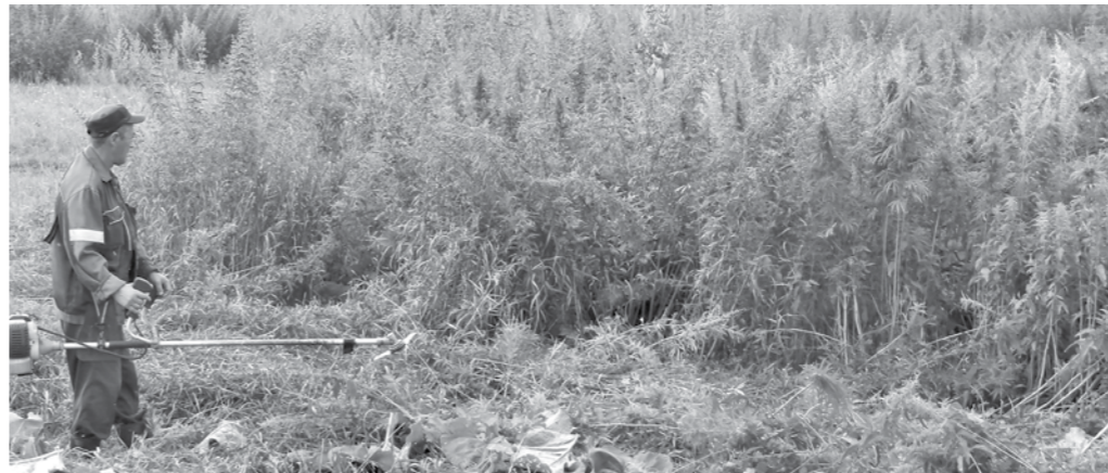
С дикорастущей коноплей борются и современными методами, и «дедовскими» - просто скашивая ее.