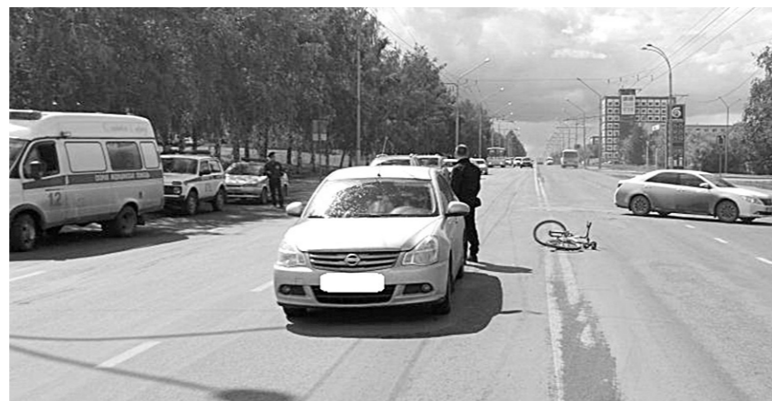
ДТП с участием велосипедистов - к сожалению, явление нередкое.

Пешеходов и велосипедистов могут начать штрафовать за появление на проезжей части в наушниках