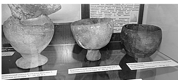
Найденные на раскопках керамические горшки.