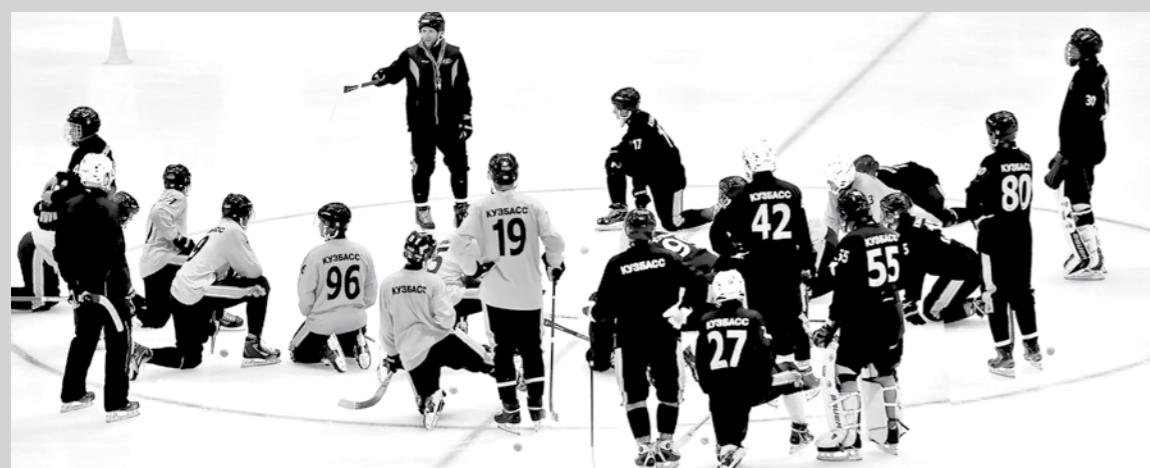
Установка перед первой тренировкой на льду.