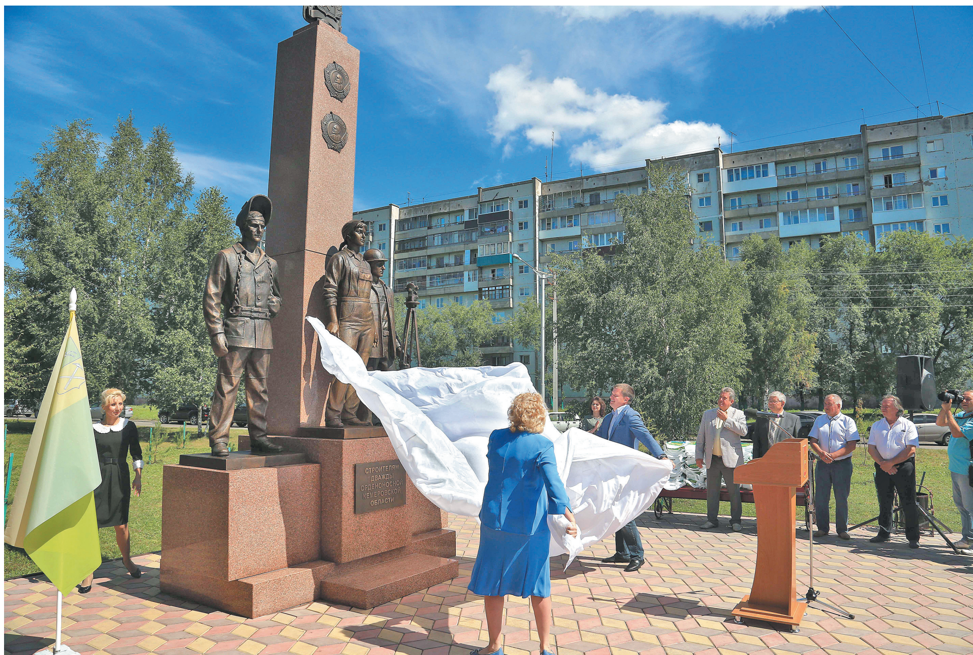
■ Новой скульптурой в Прокопьевске увековечили труд строителей.