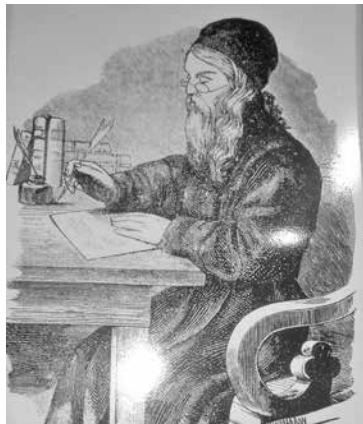
■ Макарий (Глухарев) одним из первых в России перевел в Бийске Библию на русский язык.