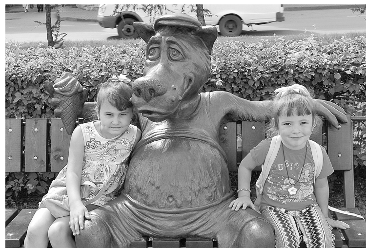
■ «Щас спую»: симпатяга Волк уже успел полюбить беловчанам.