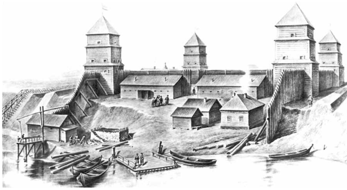
■ Бийская крепость. Изображения Бикатунского блокпоста не сохранилось.