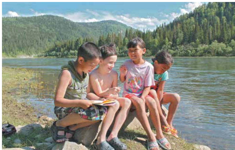
■ В Усть-Анзасе местная детвора с удовольствием общается с туристами.

Да-да, именно жили. Особенность экомузея «Тазгол» в том, что здесь можно остановиться и пожить. Цены просто смешные. Правда, здесь никто не обещает пять звезд. Зато весь набор экзотики, нетронутой человеком природы - вволю.