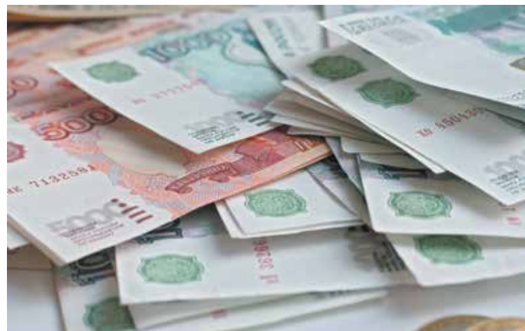
■ Банкиры стараются навязать свои услуги населению самыми разными способами...

яснилось, что банкиры старательно прописали в договоре проценты по кредиту, штрафные санкции за несвоевременные платежи, но ни слова не сказали про льготный период кредитования (обещанные 50 дней без процентов). Это, по их словам, оказалось зашифровано в дебри другого циркуляра... Но факт остается фактом: хитрые банкиры обходят все попытки законодателя ограничить навязчивое предложение кредитных услуг населению. Сейчас они перешли в плоскость «адресной» рекламы, по сути, модификации пиар-технологии «от двери к двери».