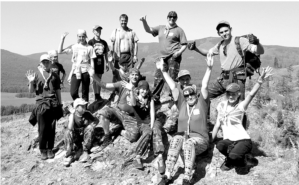
■ Каждый вечер в лагере подводились итоги эстафеты добра «Помоги другому», когда, получив помощь, скаут, в свою очередь, чем-то поддерживал трех человек из числа своих товарищей или местных жителей.