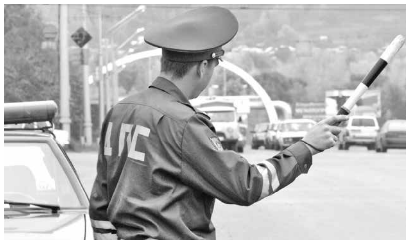
■ Дорожные полицейские могут штрафовать не только водителей, но и пешеходов.

Организатор торгов - государственная корпорация «Агентство по страхованию вкладов» (адрес: 109240, Москва, Верхний Таганский тупик, д. 4, электронная почта: etorgi@asv.org.ru), являющаяся на основании решения Арбитражного суда Кемеровской области от 27 февраля 2014 года по делу № А27-472/2014 конкурсным управляющим (ликвидатором) Акционерного коммерческого банка «Новокузнецкий муниципальный банк» открытое акционерное общество, (АКБ НМБ ОАО, адрес регистрации: 654000, Россия, г. Новокузнецк, ул. Кирова, д. 38, ИНН 4216003682, ОГРН 102420001770), сообщает о результатах повторных торгов имуществом АКБ НМБ ОАО (сообщение в газете «Коммерсантъ» от 21.03.2015 № 49(5559)), проведенных 08.07.2015 г.