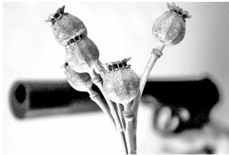
■ Теперь пенсионеру-стрелку придется держать ответ за культивирование наркосодержащего мака.