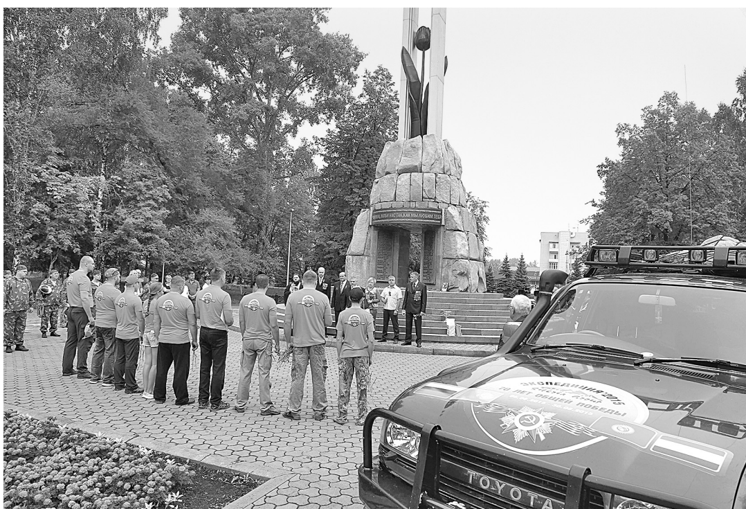
Участники экспедиции.