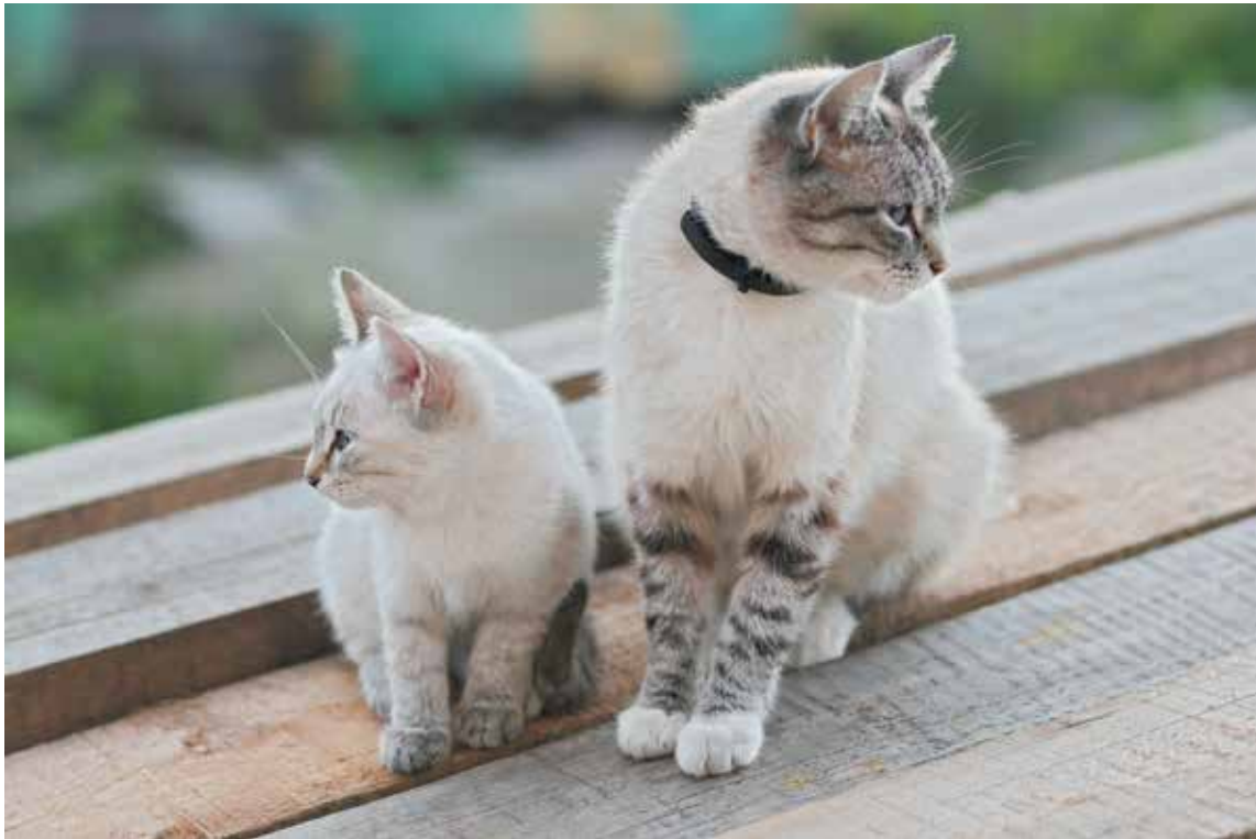
■ Разные взгляды.