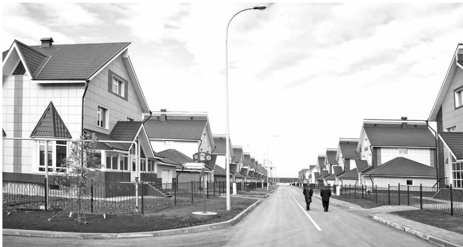
■ Лесная Поляна - амбициозный проект, который продолжает успешно реализовываться.