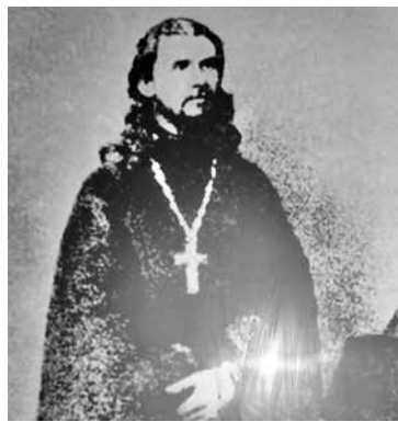
■ Другой Макарий (Невский), святой из Бийска, стоял во главе православной церкви России вплоть до Февральской революции.

на то, чьи же пилы визжат на всю тайгу, чей же мат да кашель слышны, чьи костры дымят, сбивая в сторону полчища мошкары.