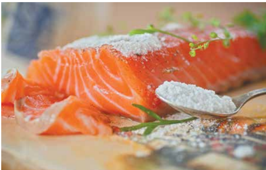
■ Скандинавские бизнесмены нашли способ обойти санкции. Хотя еще год назад ИКЕА заявляла, что лосось в ее российских филиалах будет только норвежский или не будет вовсе...

Наши агенты выражали сомнения в том, удастся ли такой «тайный ход» шведской компании в связи с последними событиями, но оказались неправы: уже сейчас рекламные рассылки новосибирской ИКЕА предлагают кузбассовцам, многие из которых охотно бывают в соседнем регионе и захаживают за покупка-