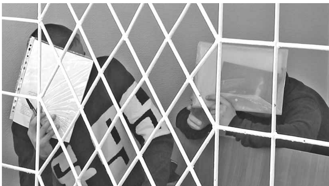
■ Большинство аферистов рано или поздно все равно попадают в руки полиции.