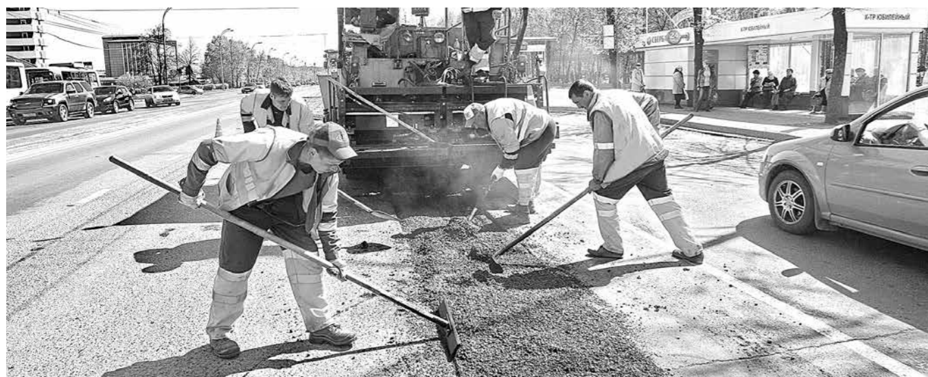
В текущем году в Кузбассе планируется отремонтировать дороги на площади около 1 млн квадратных метров.