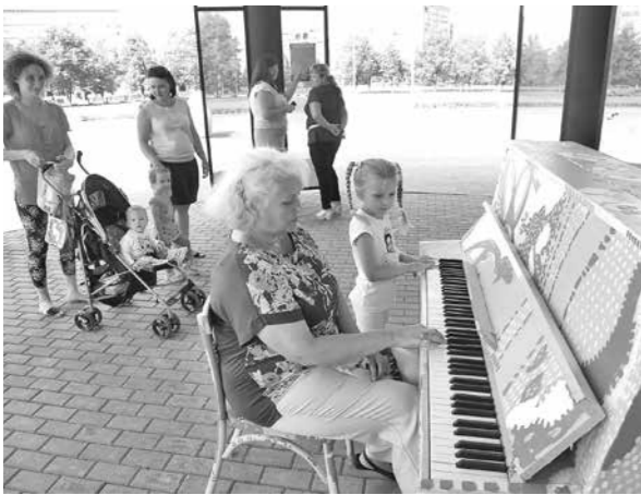
Новый арт-объект в Новокузнецке.