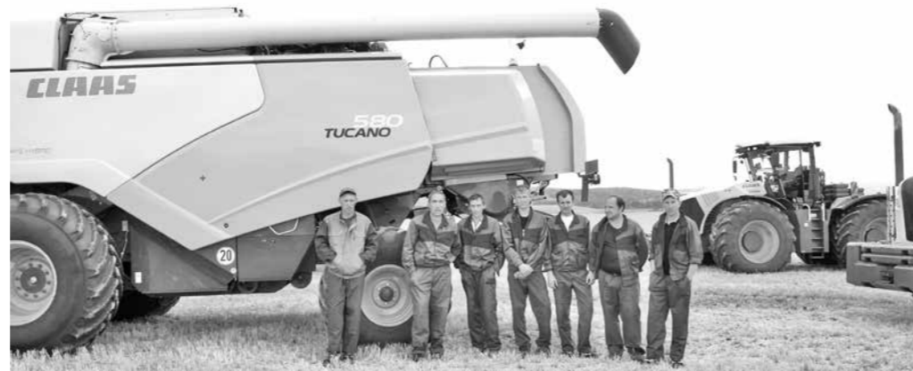
На линейке готовности.