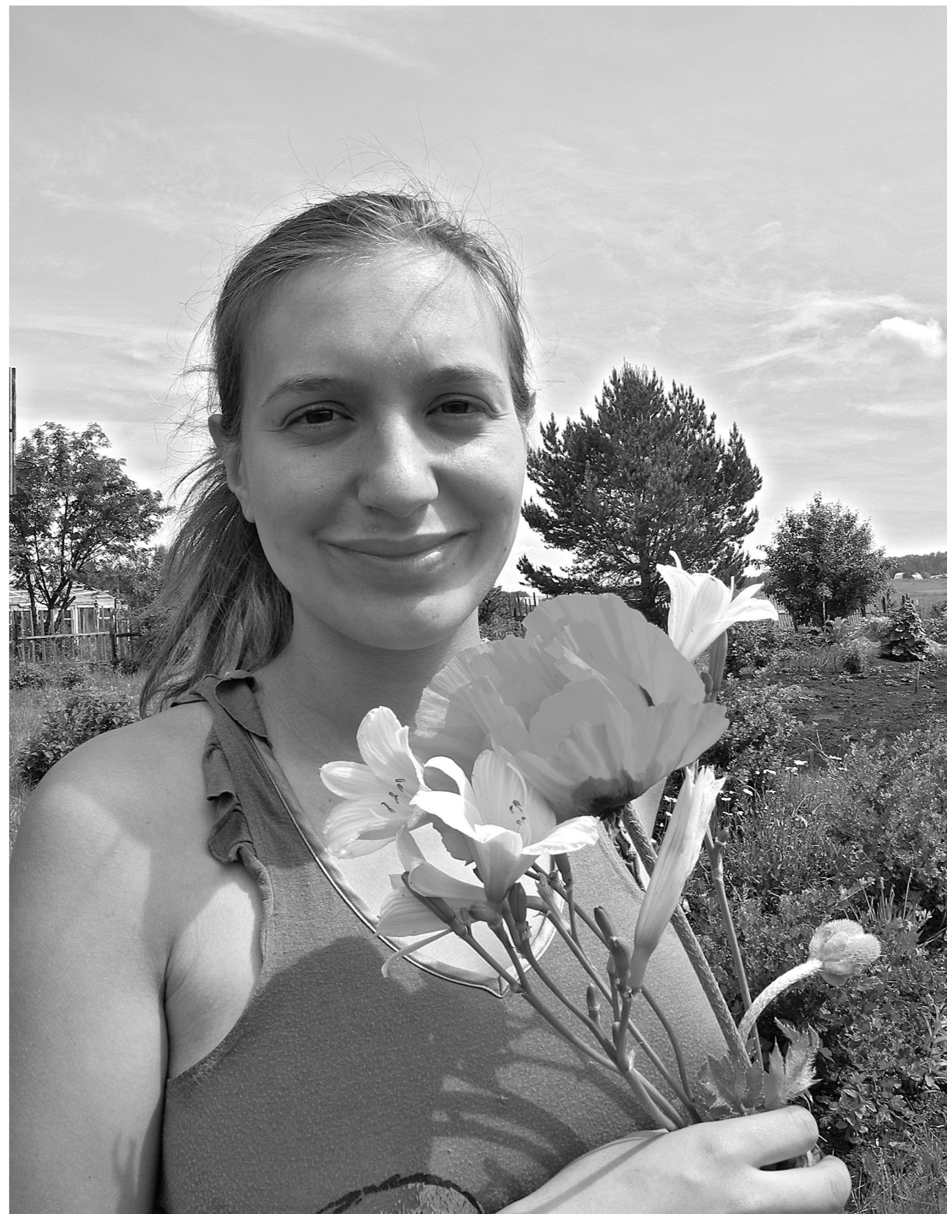
Еще есть время насладиться летом. Синоптики обещают в августе теплую, но дождливую погоду.

Август еще порадует кузбассовцев летним теплом