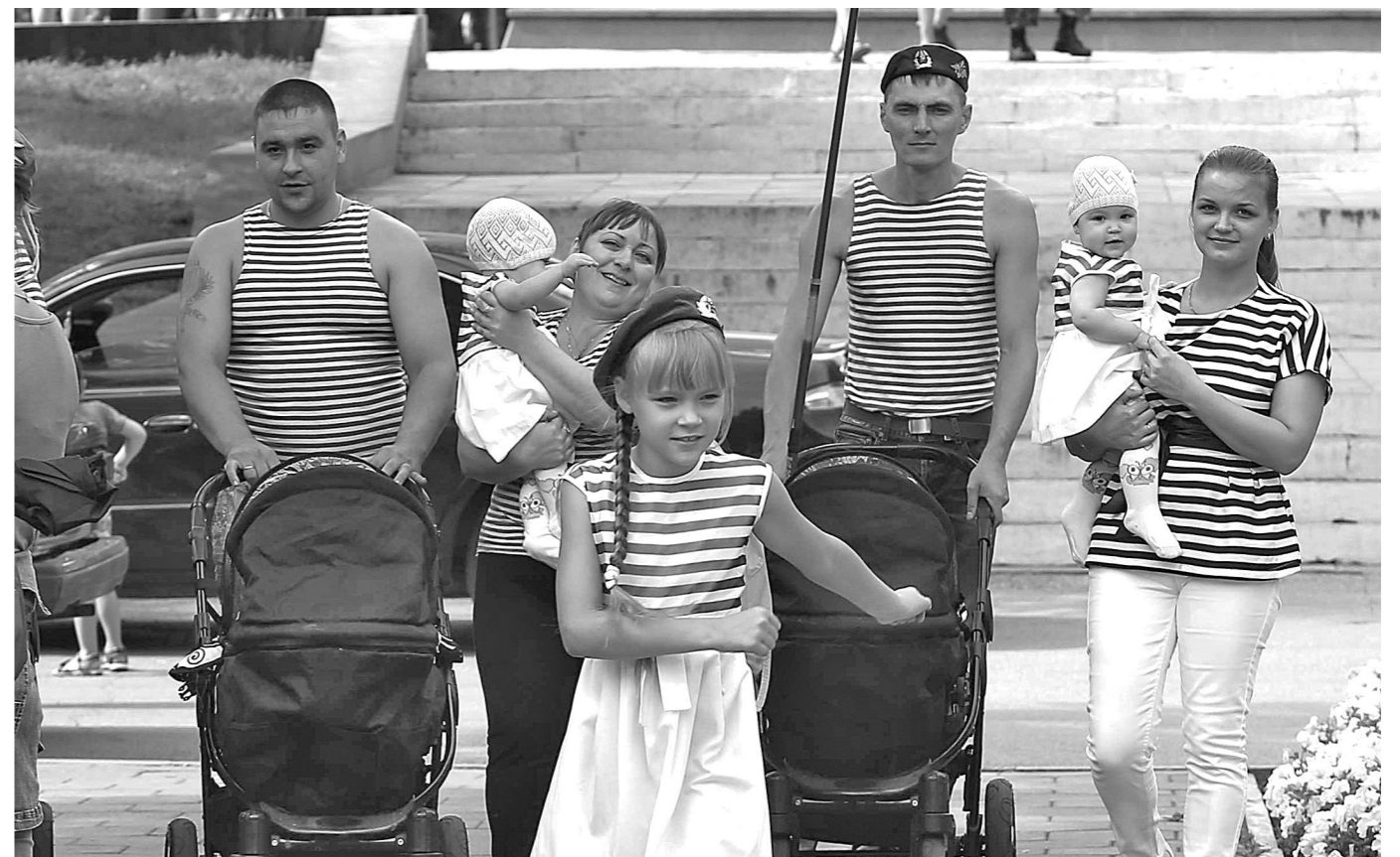
Гуляй, десант! Без шумных увеселений и эксцессов отметили «голубые береты» Новокузнецка День воздушно-десантных войск России, хотя был повод – 85-летие со дня образования ВДВ. Утром ветераны провели митинг у мемориала жертвам локальных конфликтов «Черный тюльпан», возложили цветы. Почтили память дедов на бульваре Героев у Вечного огня. Потом до вечера гуляли в городских парках и на площадях, многие – вместе с женами и детьми, тоже одетыми в тельняшки и голубые береты. Ездили по городу с флагами. Правда, без купания в фонтанах все же не обошлось. Традиция!