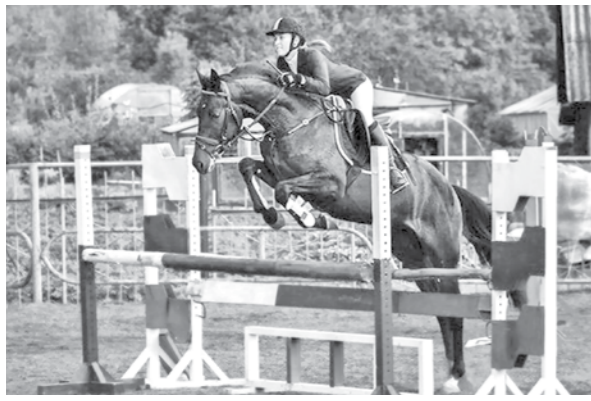
Впервые в Березовском запущена трасса для тробеоря, аналогов которой нет в Кузбассе.