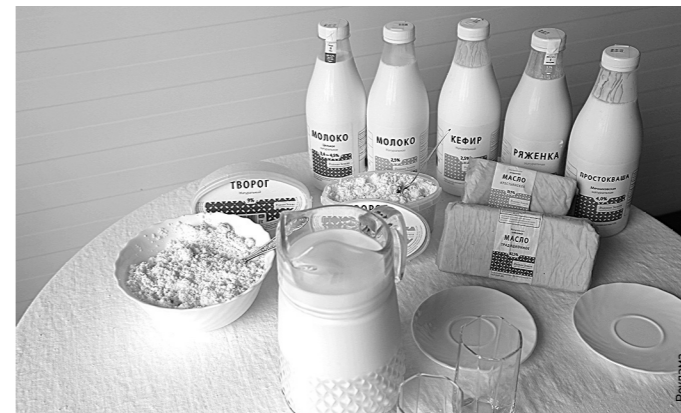
Молочные продукты «Родная Земля» - это то, что хочет видеть на прилавках покупатель.

На строительство завода ушел всего один год. Инвестиции составили 78 миллионов рублей.