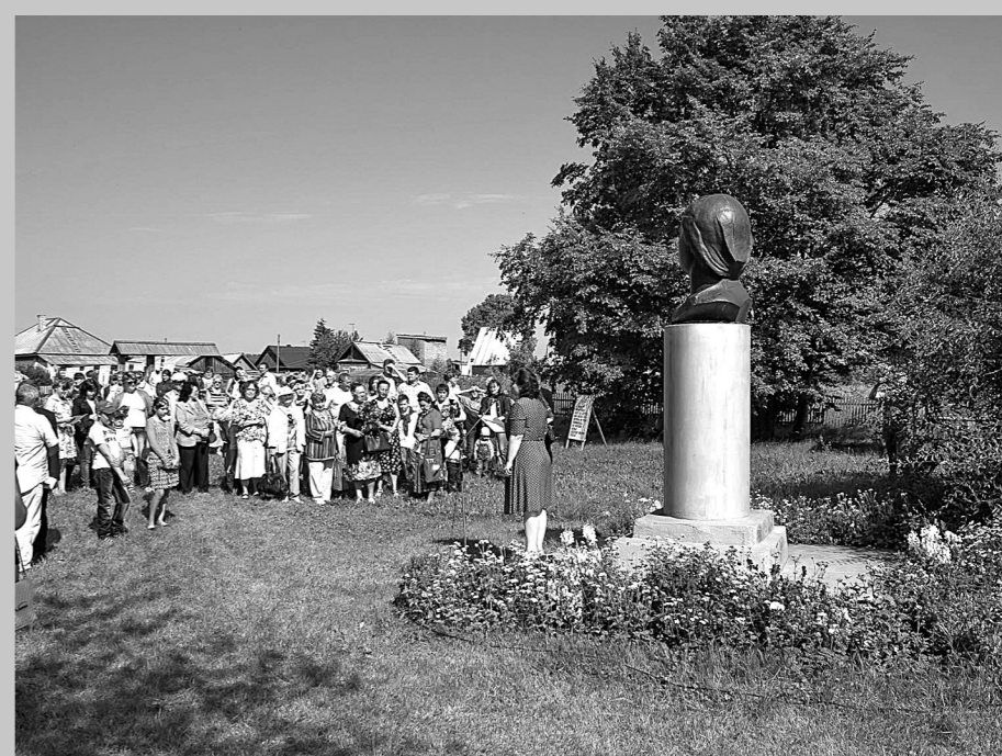
Фёдоровские чтения собрали более полутора тысяч почитателей таланта знаменитого земляка.