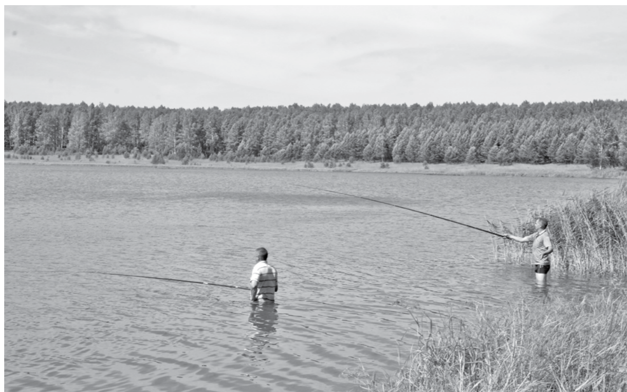
На озере Пустом - не пусто.

нией приехала на Пустое из Мариинска. За микроавтобус заплатили частнику 700 рублей.