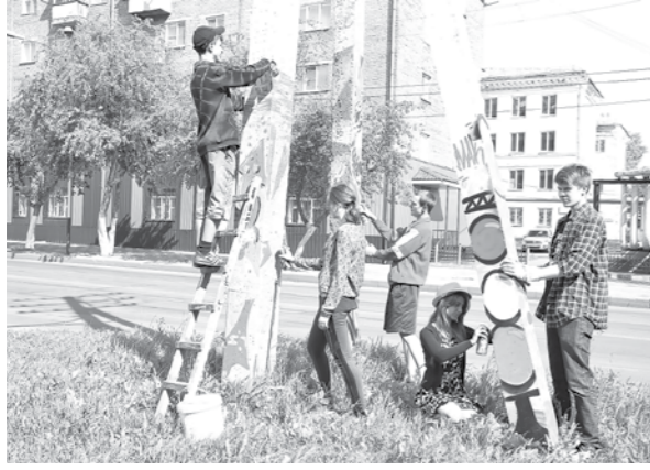
Креативные уличные фонарные столбы от прокопьевских граффитистов.