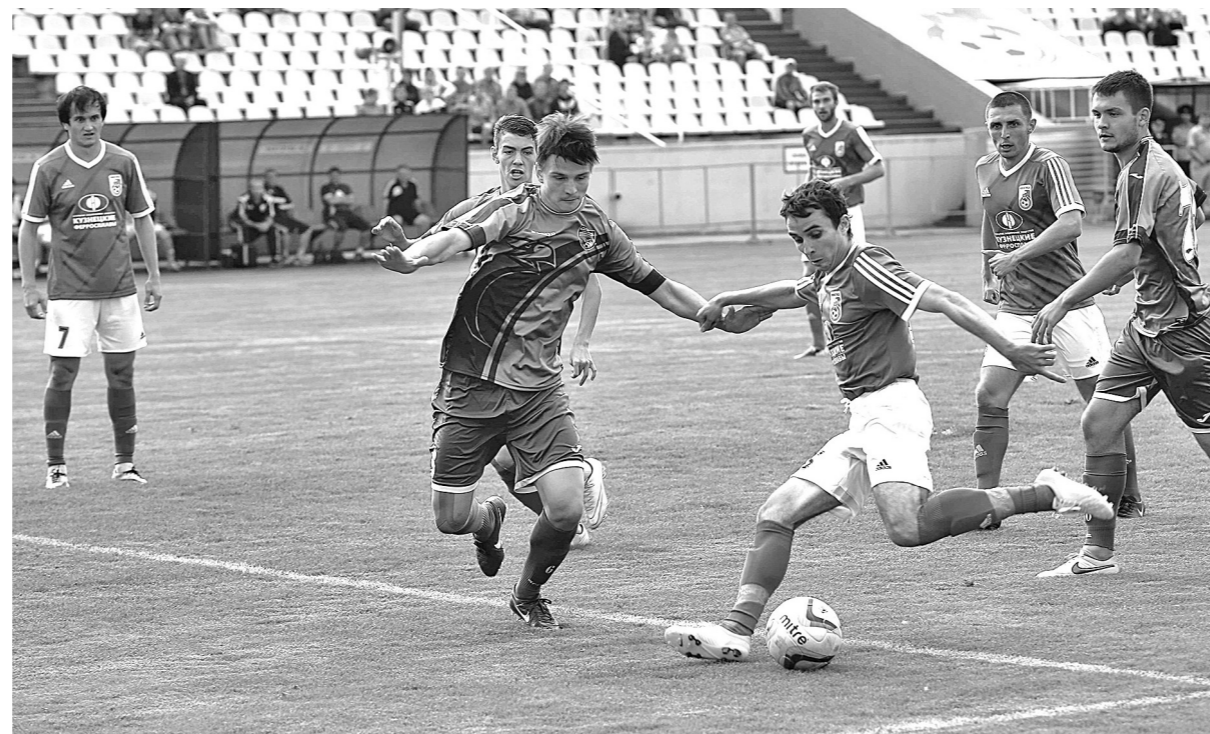
Новокузнецкие футболисты в трёх домашних матчах зонального первенства страны имели территориальное преимущество, но только в одной игре одержали победу.