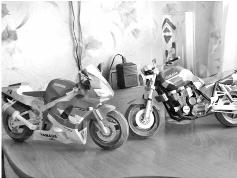
■ Так выглядят бумажные копии мотоциклов.