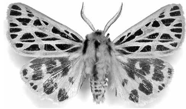
■ Редчайшая ночная бабочка-медведица даурская.

Коллектив Территориального управления Федеральной службы финансово-бюджетного надзора в Кемеровской области выражает искренние соболезнования родным и близким