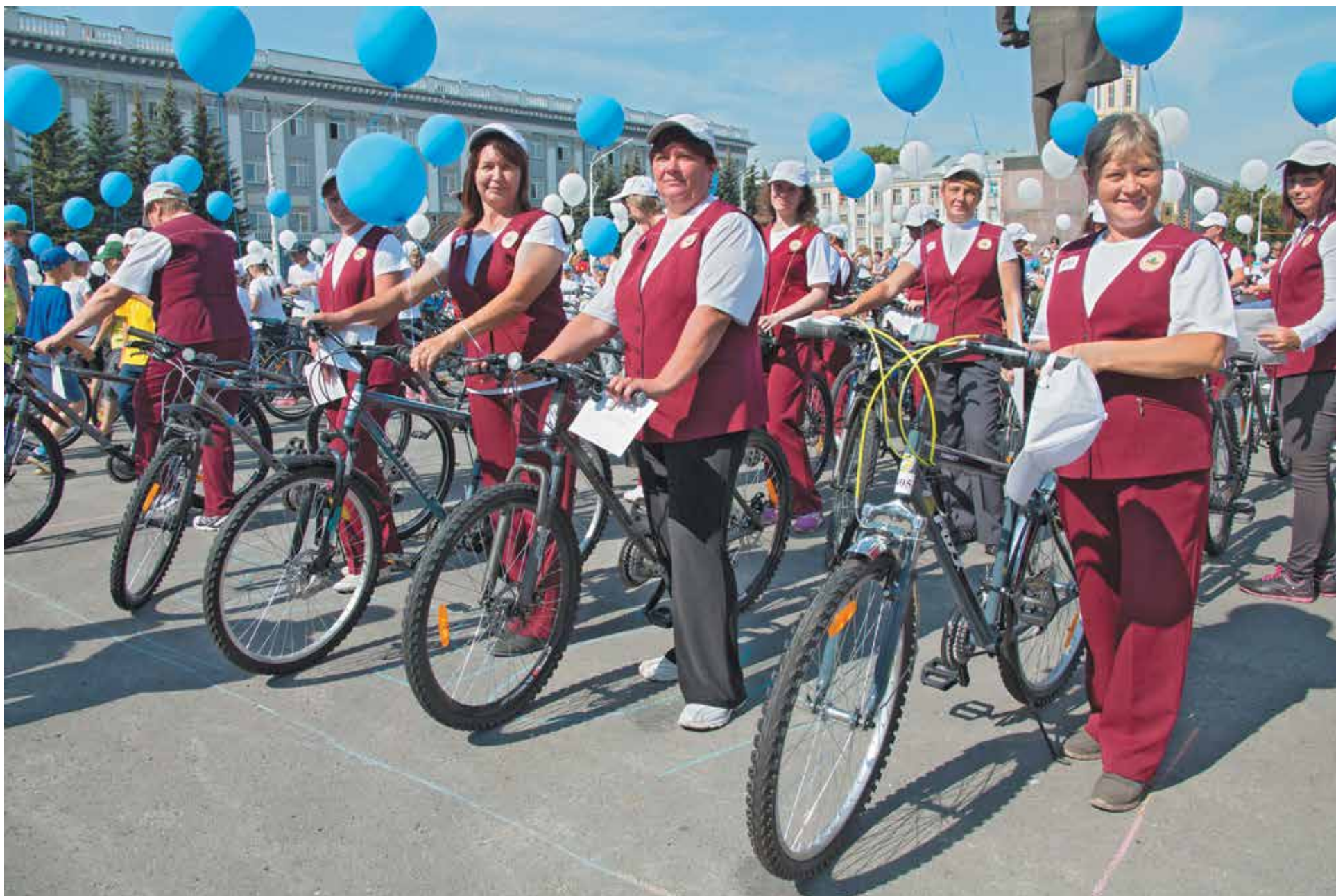
С двухколесными помощниками социальные работники станут мобильнее.