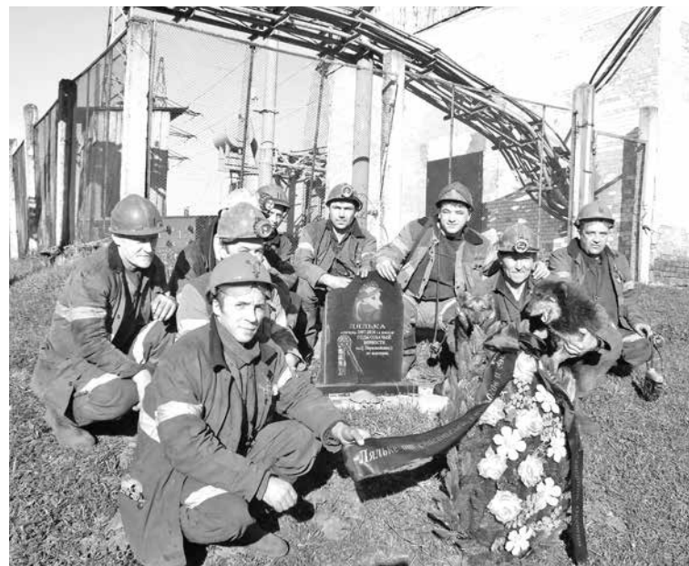
■ Шахтеры, положив венок с Кавказа на могилу Ляльки, говорят: спасибо, что тоже помните!

Собачке-горнячке отдали честь одни из самых крутых псов России, с чемпионскими титулами, с супер-родословной.