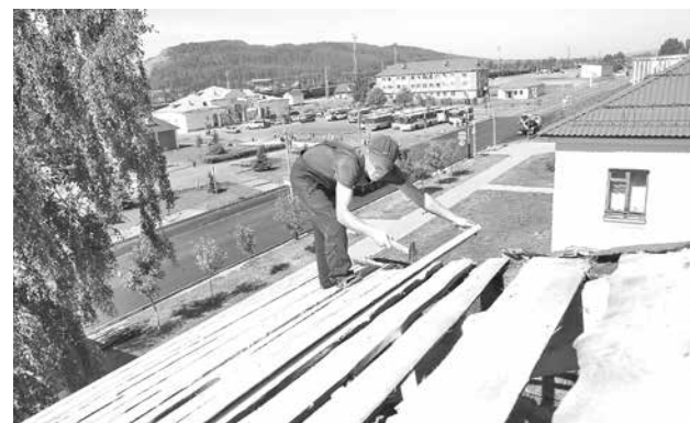
■ Фото Ярослава Беляева.