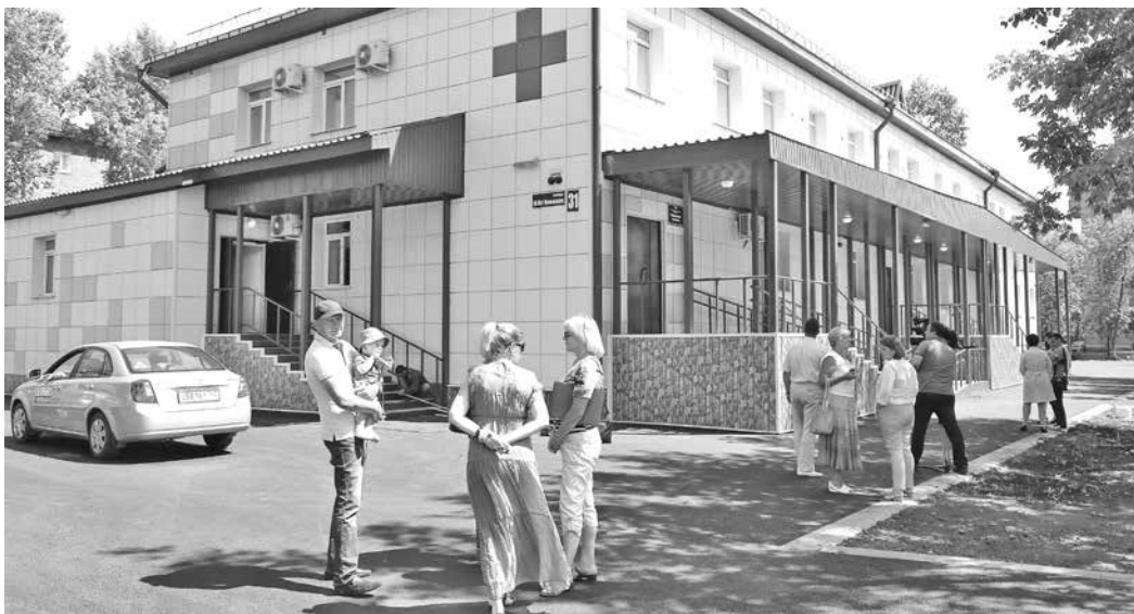
■ Фото Ярослава Беляева.