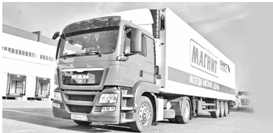
■ Скоро товары в «Магнит» будут поступать из кемеровского логистического центра...

Кстати, уже в эту субботу в Кемерове станет еще одним супермаркетом больше. Правда, строительным. На проспекте Шахтеров 25 июля открывается торговый центр «Доминго».