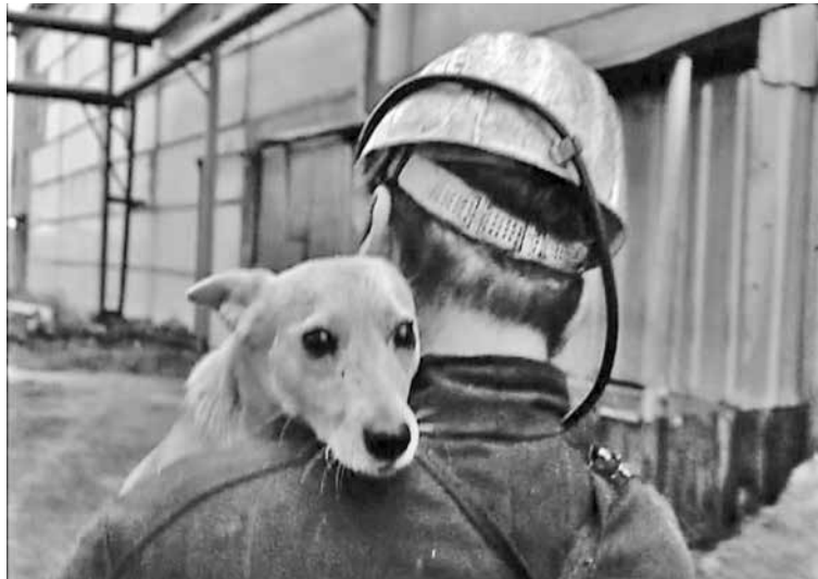
■ Лялька пошла в шахту – так было еще несколько лет назад.

А подросла собачка – стала проситься взять ее с собой и ездить вниз, в шахту, изредка, в кармане робы... Еще подросла – спустились под землей на лапки. Стали Ляльку назначать дежурным, ответственным за бутерброды. Она «наряд» поняла. Ни