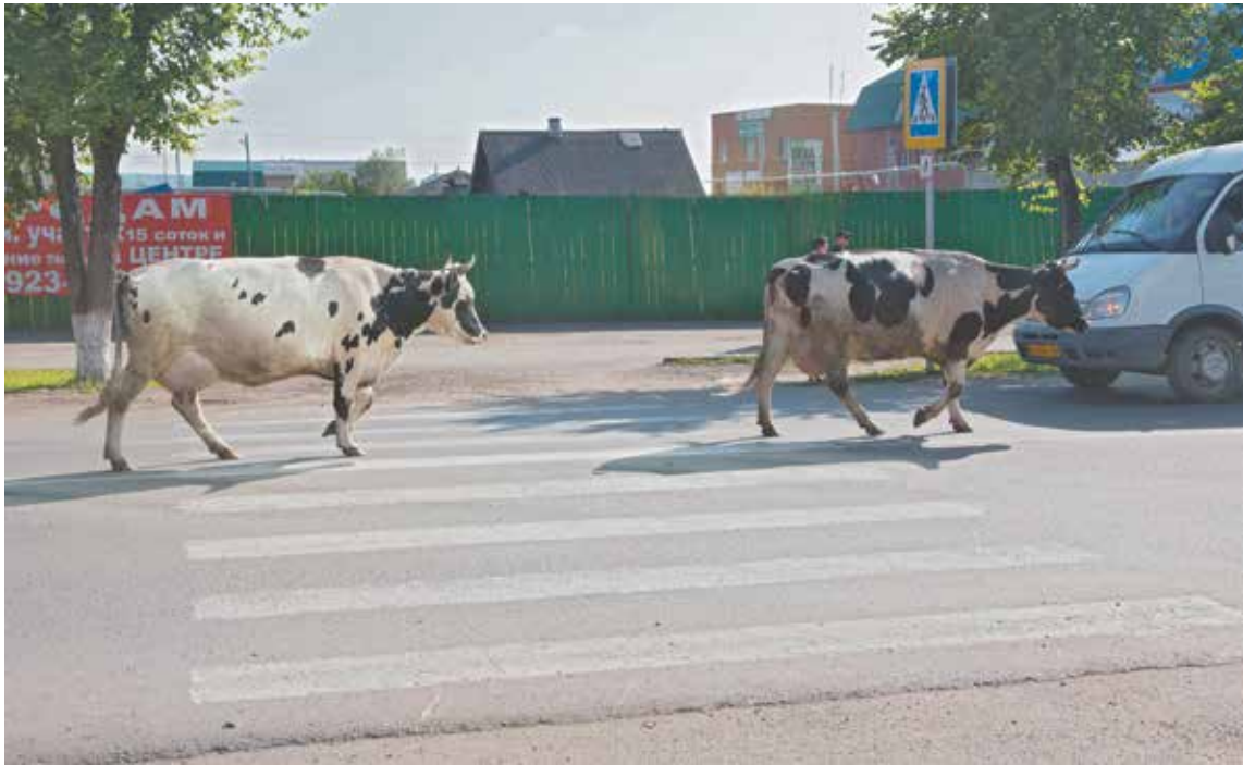
■ Мариинский корован.