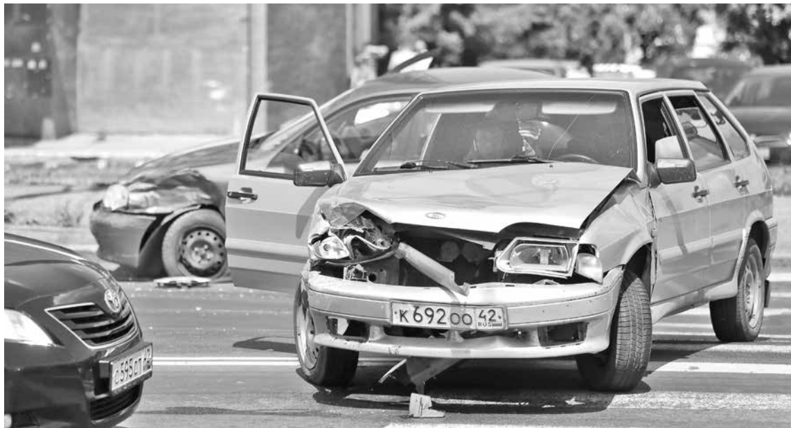
Многие водители до сих пор не знают, что по новым правилам они обязаны освободить проезжую часть после ДТП.

Это его предположение, как ни странно, подтвердили оба участника аварии. Потерпевший Сергей Иванович, у машины которого поврежден задний бампер, поясняет, что сам он из