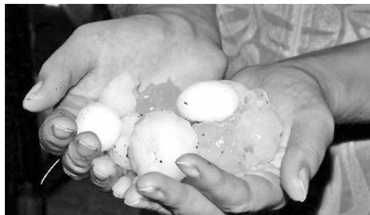
■ Такие вещдоки еще не гарантия получения страховки.

Действительно, без соответствующих справок и документов не обойтись. Но доказать, что урон произошел именно вследствие природного явления, вполне возможно. Кузбасские метеорологи по нашему запросу предоставили редакции пространный документ, разъясняющий порядок действий. Попробуем изложить его кратко.