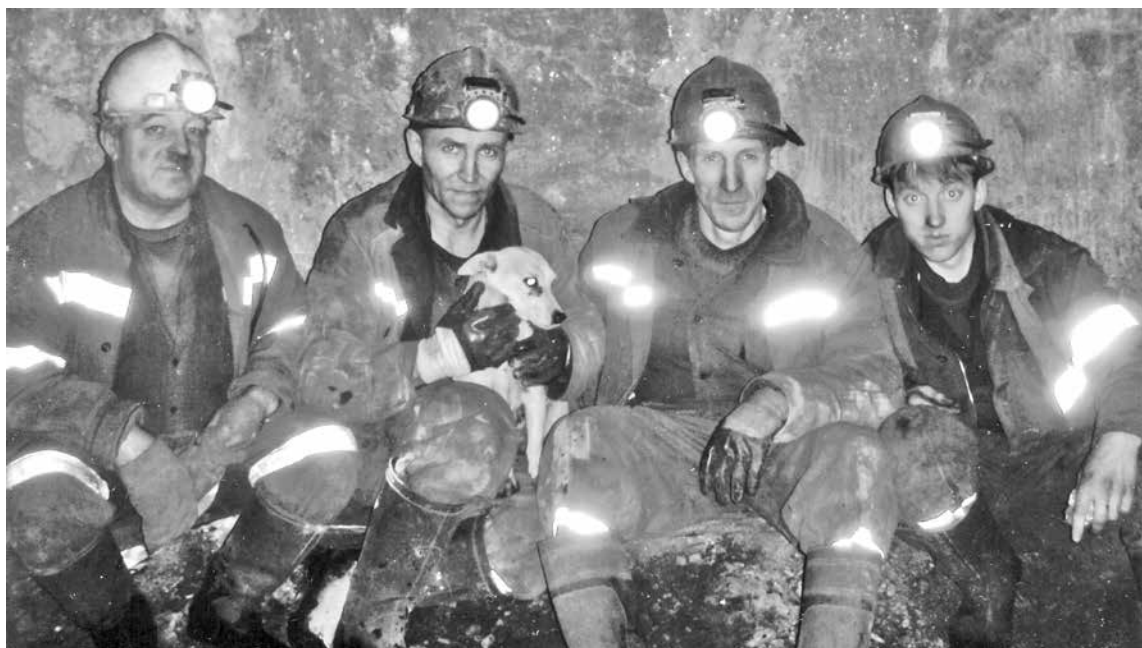
■ Подземная собачка Лялька – еще при жизни, в шахте под землей.

«А у нас в Осетии лето дождливое. Начались отпуска, в основном отдыхаем на месте – 5 км от города, и ты уже в горах... Всем ребятам-шахтерам горячий кавказский привет, всем вместе – здоровья, Ляльке – долгая память!»