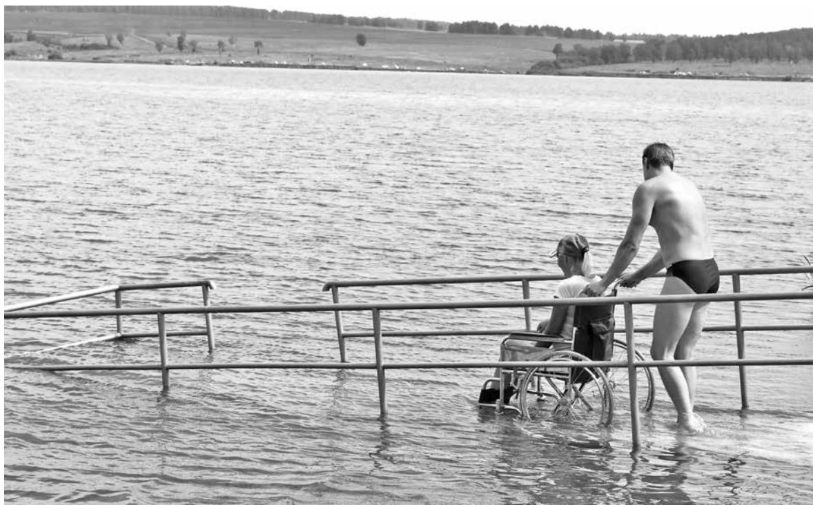
■ Фото Сергея Ярцева.