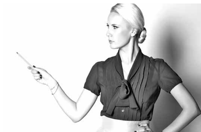
■ Елена Летучая - гроза рестораторов...

По большому счету, такой визит вполне возможен, ведь ресторанный критик Елена Летучая уже побывала в сибирских городах. Например, в Омске, Новосибирске, Барнауле. И закономер-