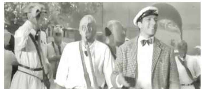
■ Знаменитая сцена из «Золотого тельника», когда Александру Корейко удается улизнуть от Остапа Бендера во время «химических учений», основана на вполне конкретных реалиях того времени.