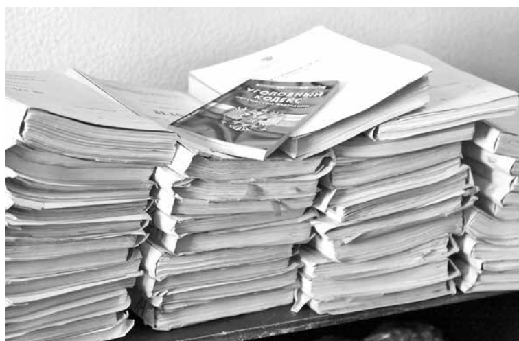
Уголовные дела по преступлениям прошлых лет, которые готовятся к передаче в суд.